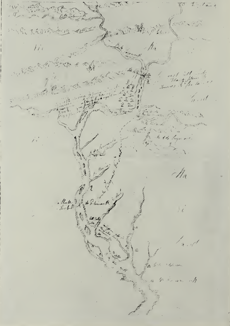
GRAFFENRIED'S MAP OF HIS PROPOSED SETTLEMENT ON THE POTOMAC

Apr 20/76 Report de C. H. Graffenried sur le projet de son établissement sur la rive de la Potomac