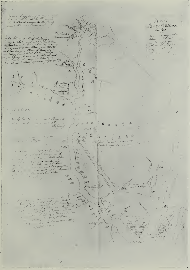
GRAFFENRIED'S PLAN OF THE TOWN OF NEW BERN