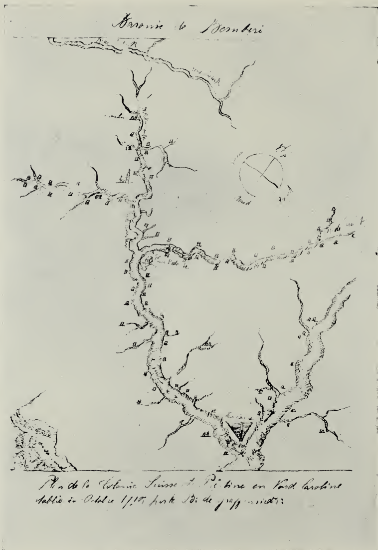
GRAFFENRIED'S MAP OF HIS COLONY