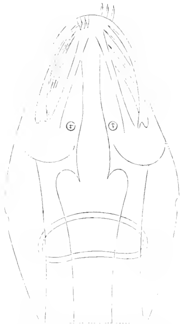
Testa ed estremità anteriore del tronco d'una Sagitta Cephaloptera (secondo Busch)

Raccoglio in una formola diagnostica la descrizione di Busch, aggiungendovi dei particolari, che risultano evidenti dalle sue figure. «Lunghezza massima 5 mmt.; l'animale compare schiacciato nel senso dorso-ventrale. Uncini 8; denti 3 ( 1 ); 2 tentacoli alla testa. Il capo è più sottile e più lungo che negli altri Chetognati. Il