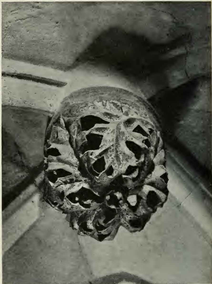
20. Schlußstein (Lettner-Pforte)