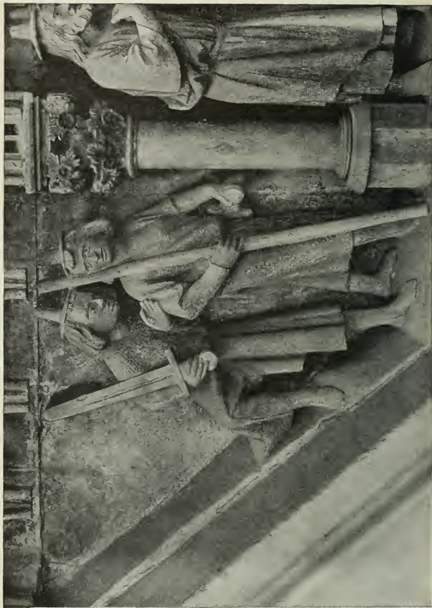
10. Des Raiphas Wache