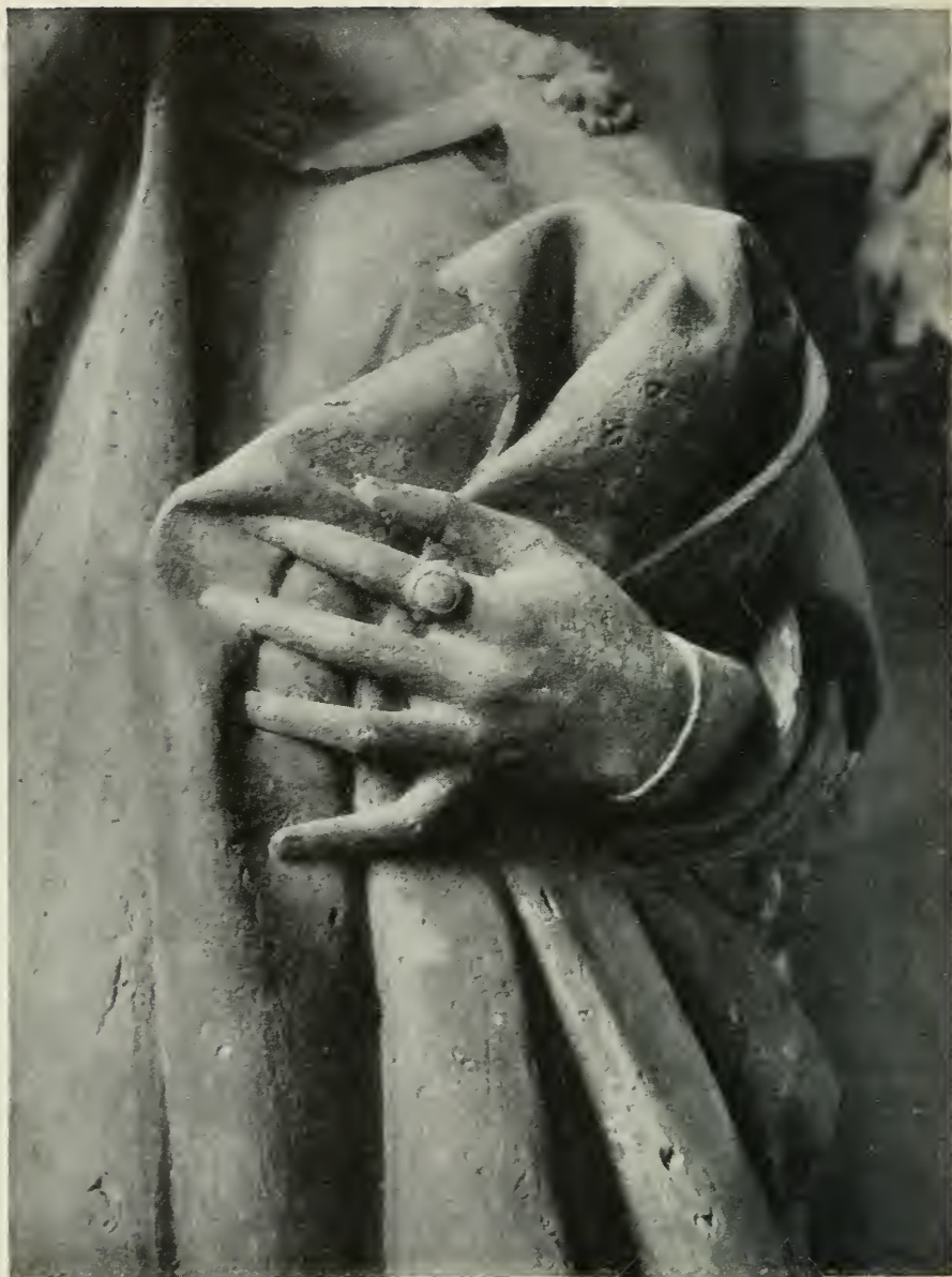
44. Hand der Uta