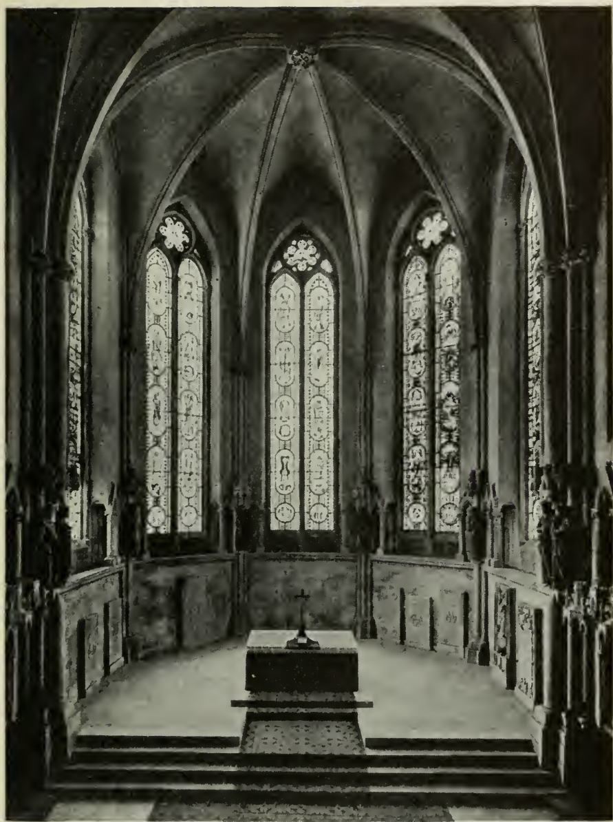
21. Der Stifterchor