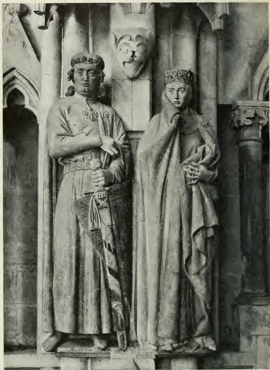
28. Ekkehard und Uta