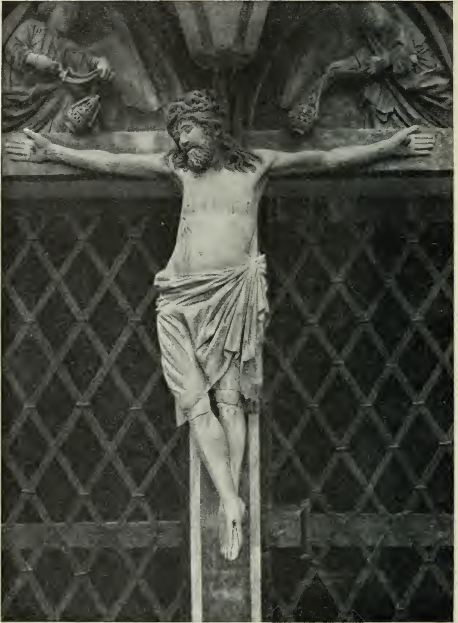
14. Christus am Kreuz