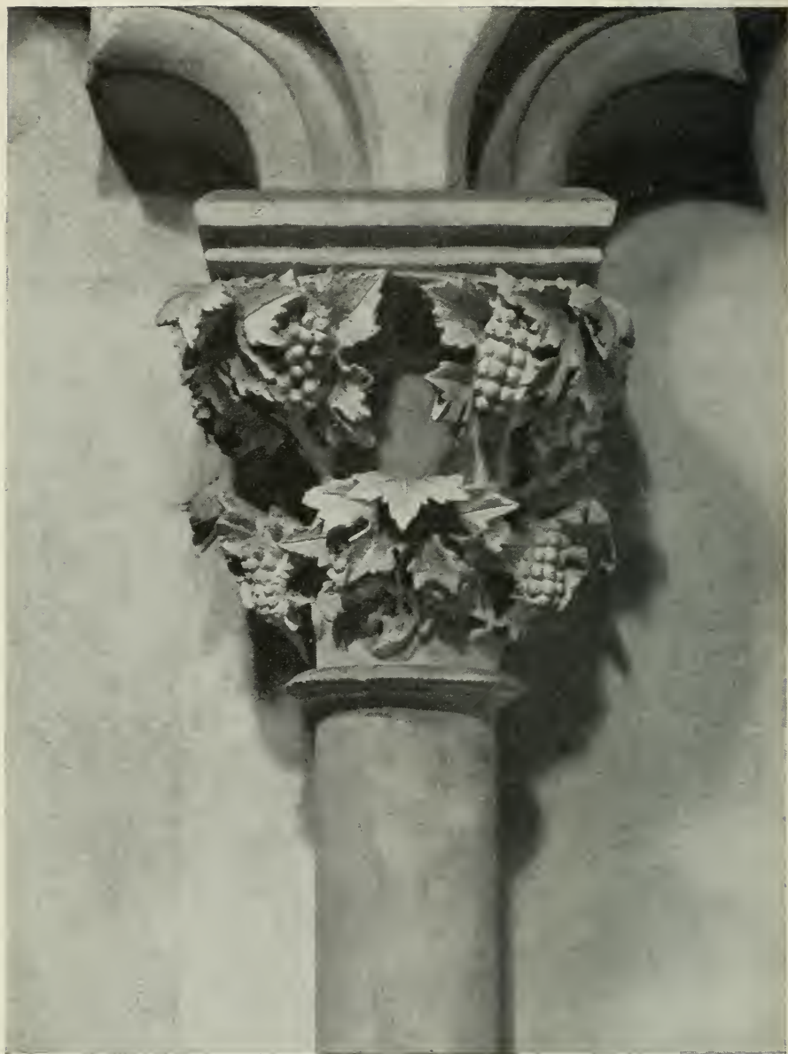
12. Weinlaub (Lettner-Kapitell)