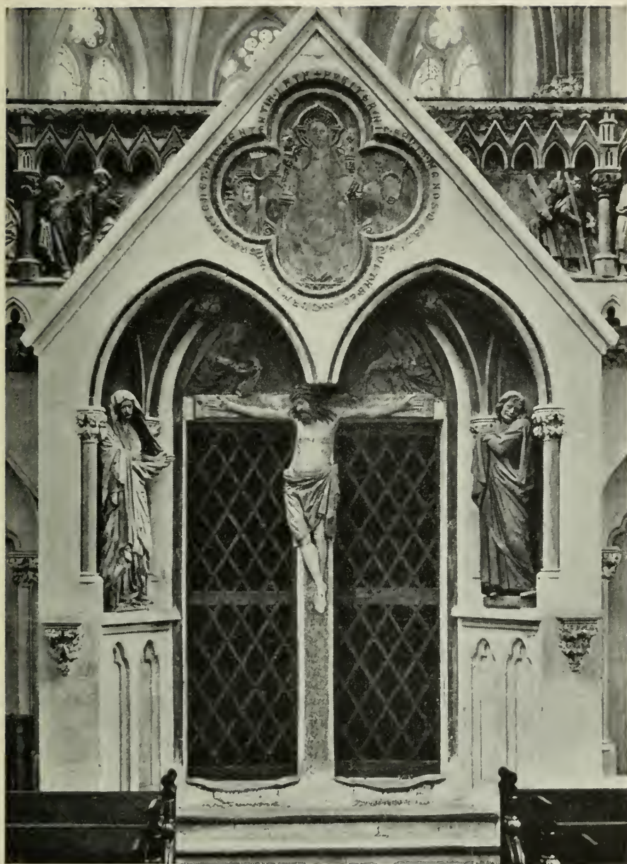
15. Die Lettner-Pforte