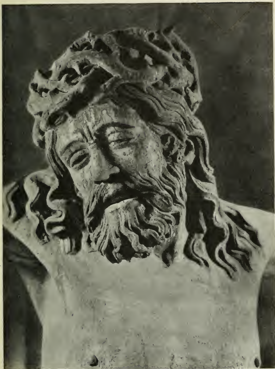
13. Der Gefreuzigte