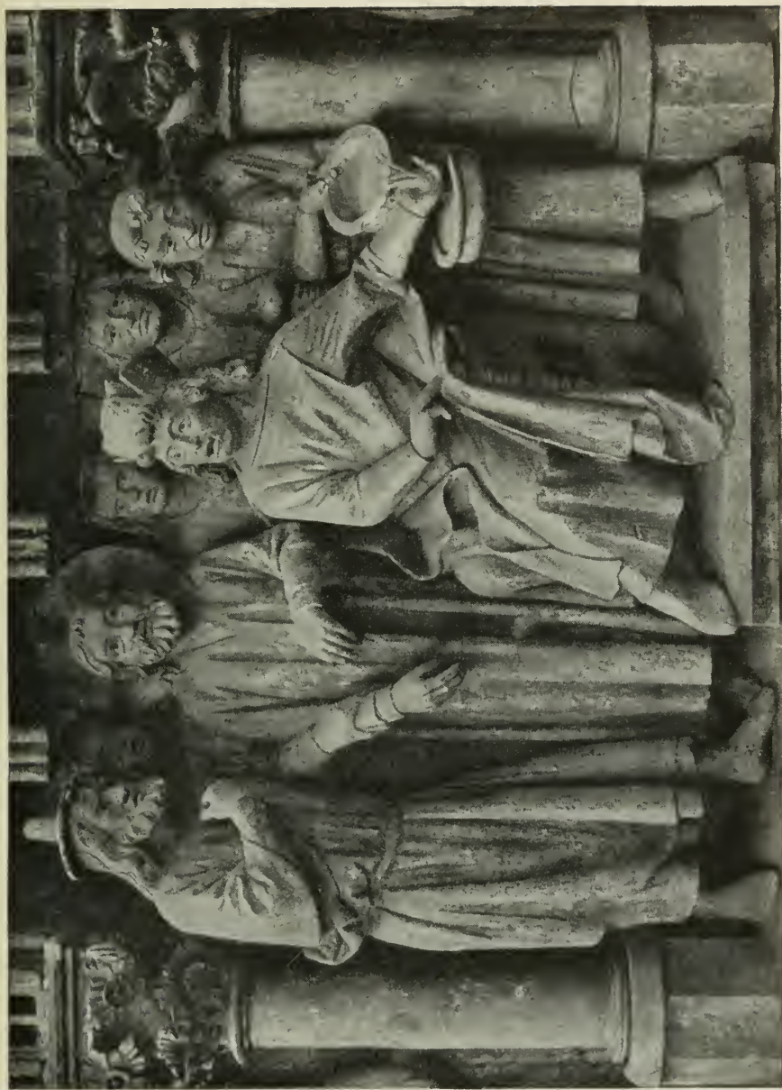
11. Christus vor Pilatus