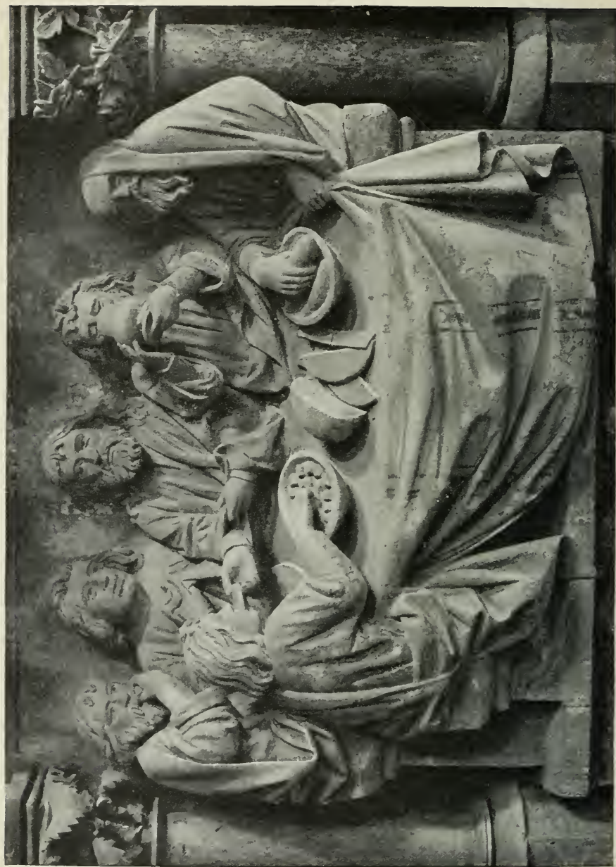
4. Das Abendmahl