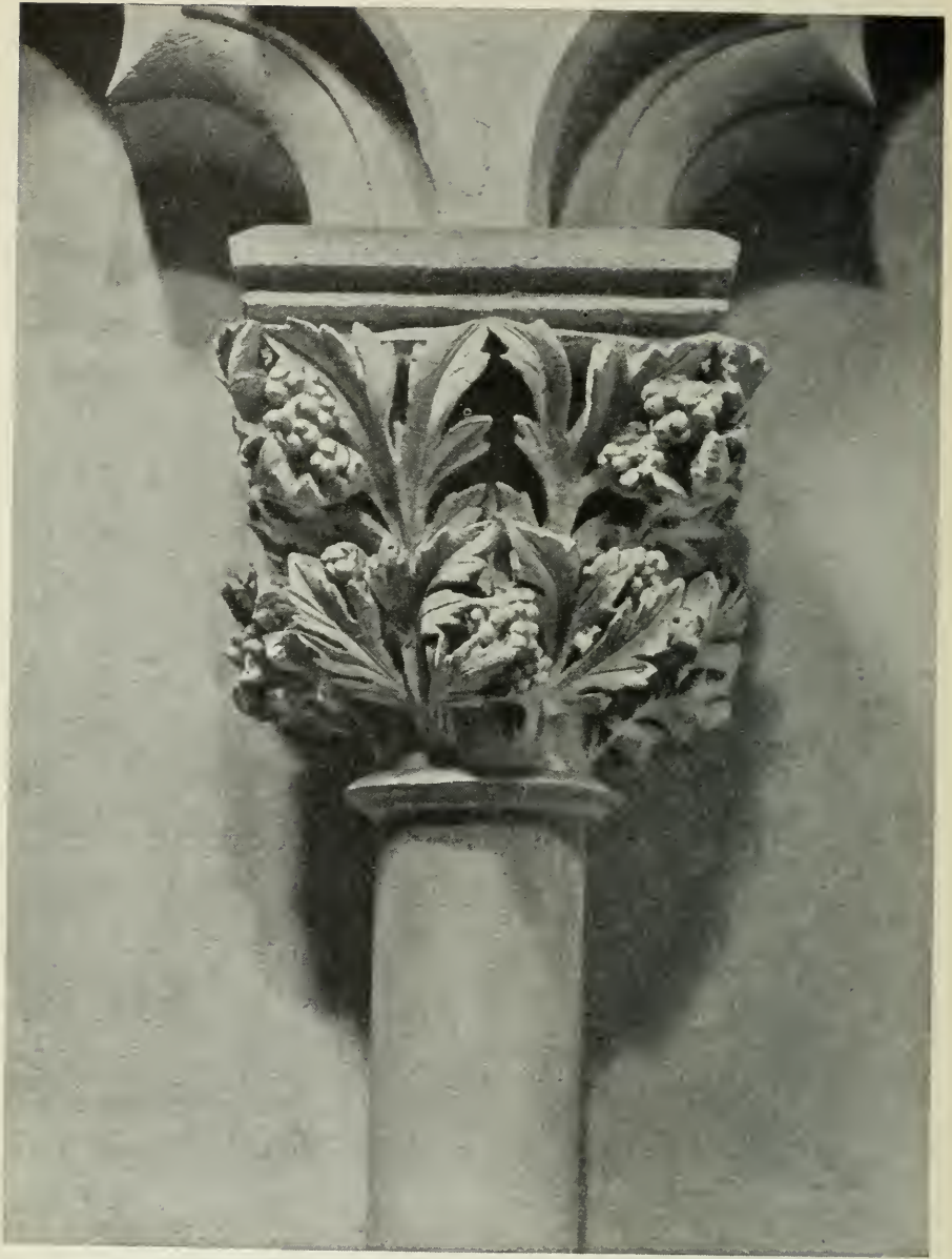
2. Distellaub (Lettner-Kapitell)