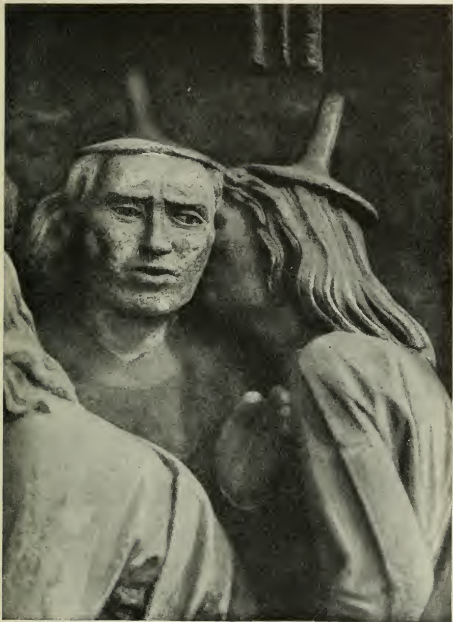
7. Berater des Hohenpriesters