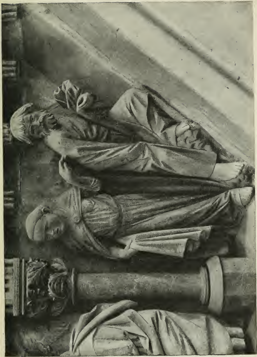
9. Die Verleugnung durch Petrus