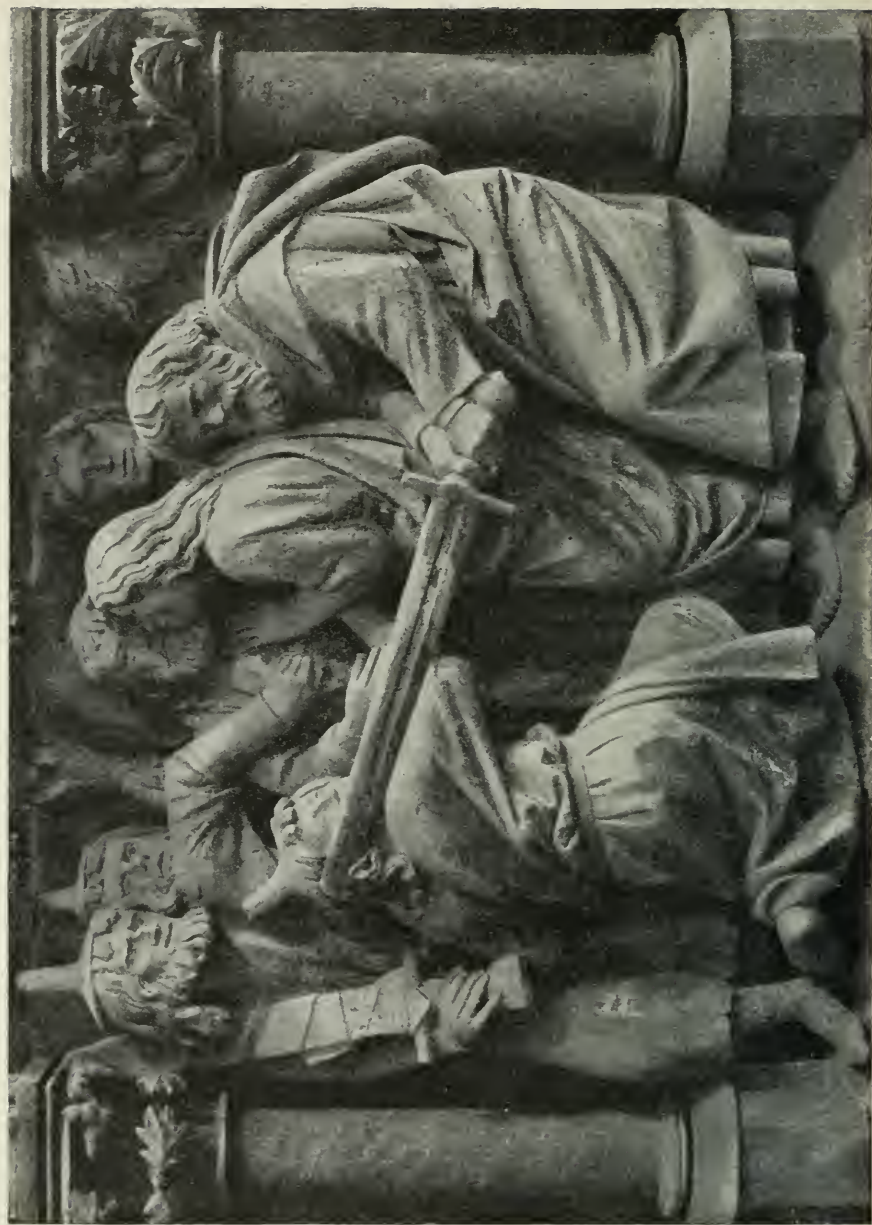
8. Die Gefangennahme