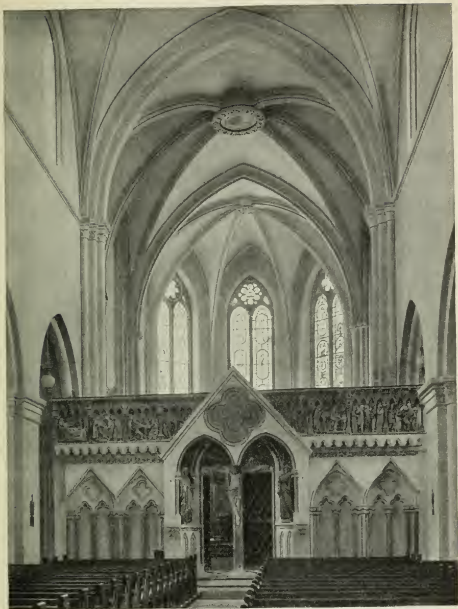
1. Der West-Lettner