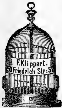
Nur 7 M

Fabrik sämtlicher Vogelbauer von verzinntem Draht, vom kleinsten bis zum größten Heckkäfig, nach Dr. Ruff Angabe angefertigt. Preisverzeichnis gegen 50 S. Bitte stets anzugeben, für welche Vogelart.