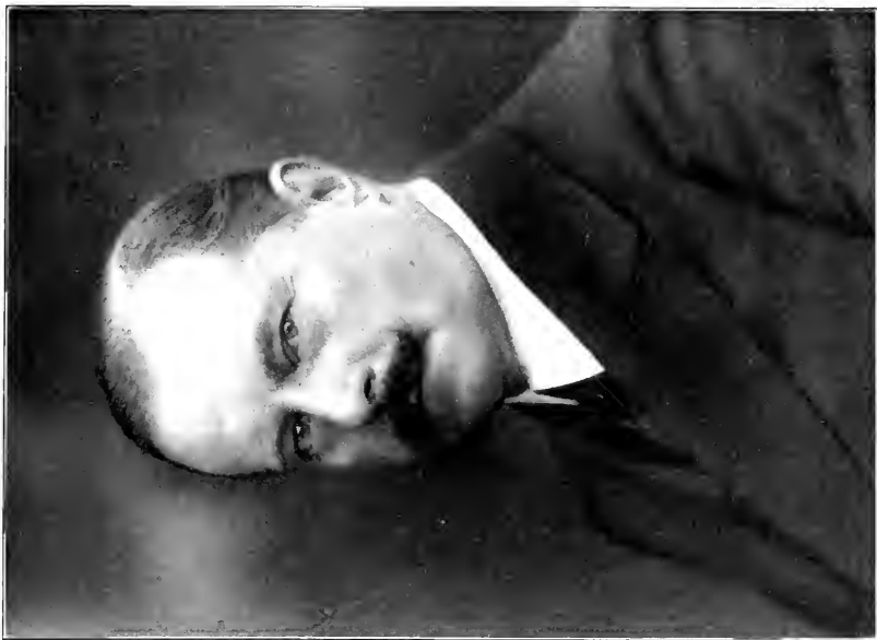
Heinrich Edmund Soblen Präsident: 1911 — 1914