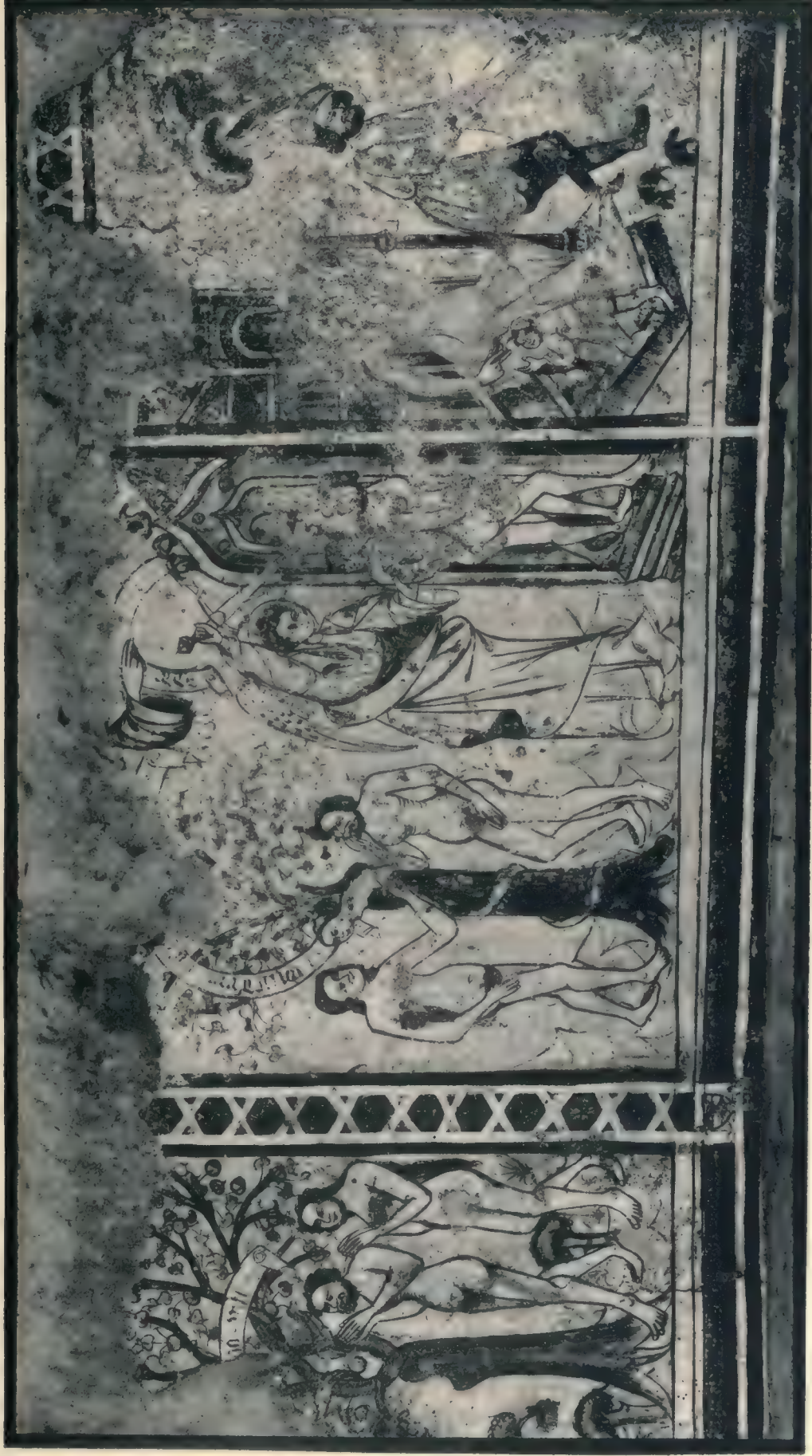
Geschichte der ersten Eltern.