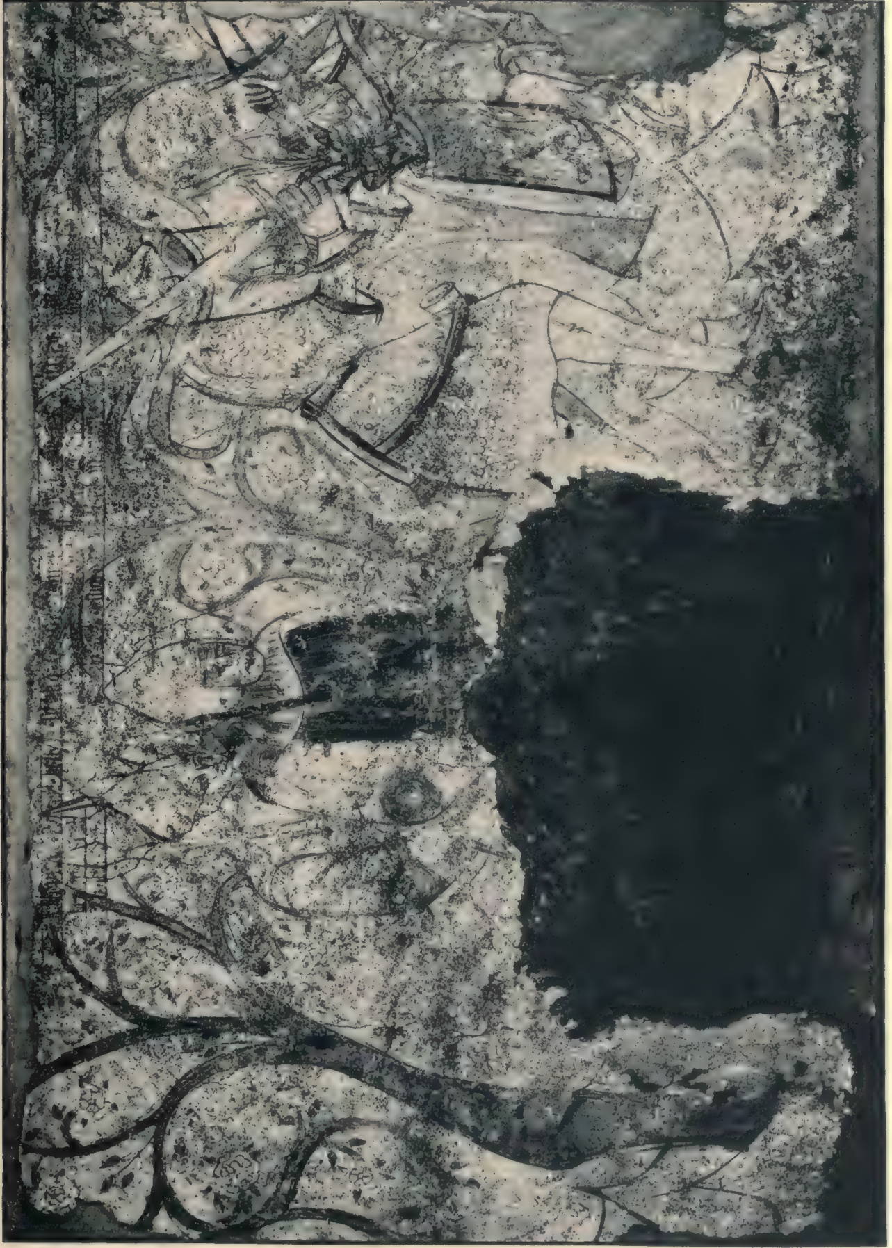
Dietrich von Bern kämpft mit Laurin.