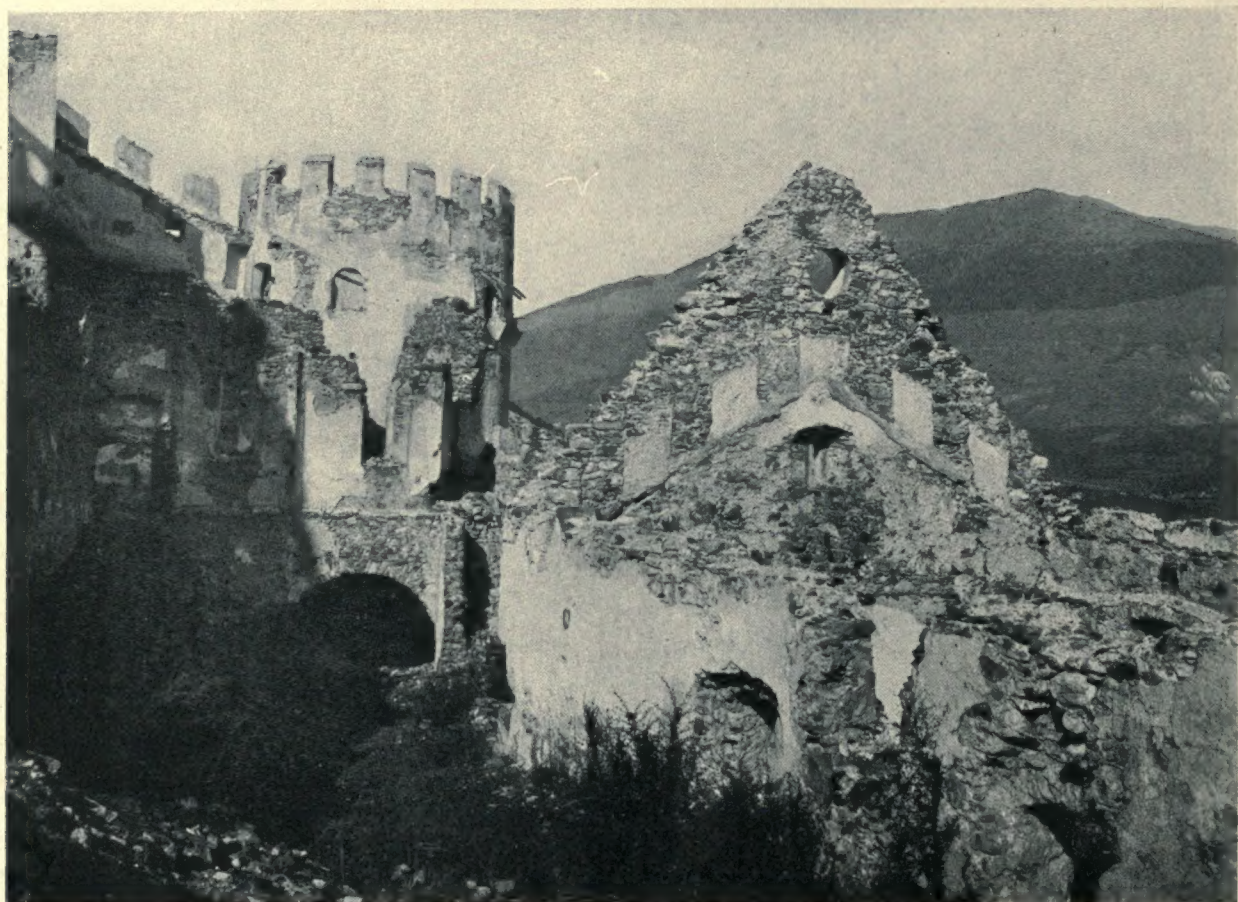
Blick auf die Ruine Lichtenberg