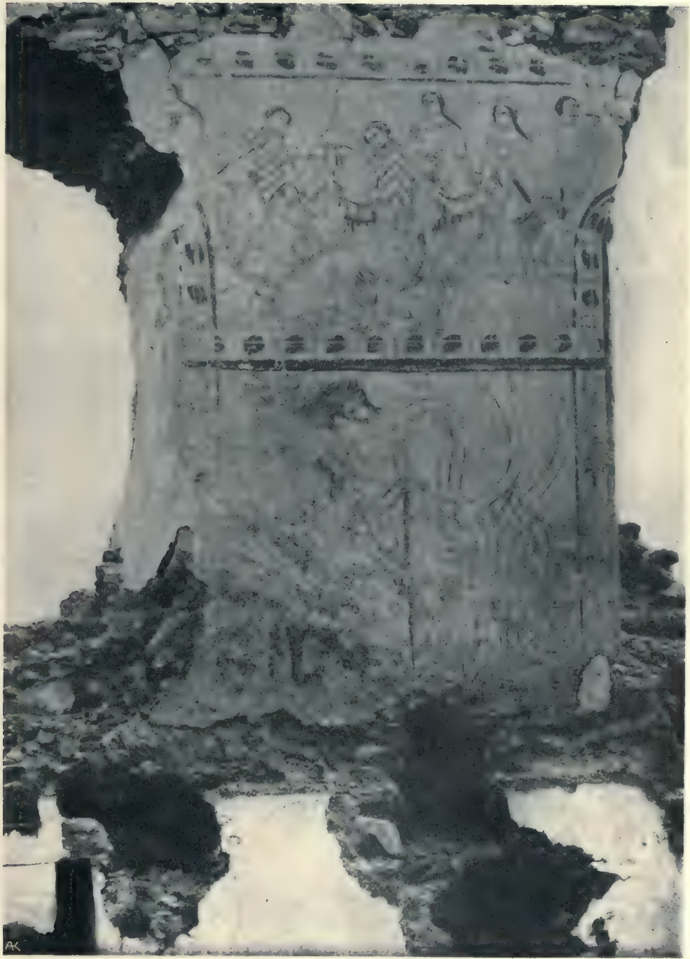
Die Sauhas — Gänsepredigt.