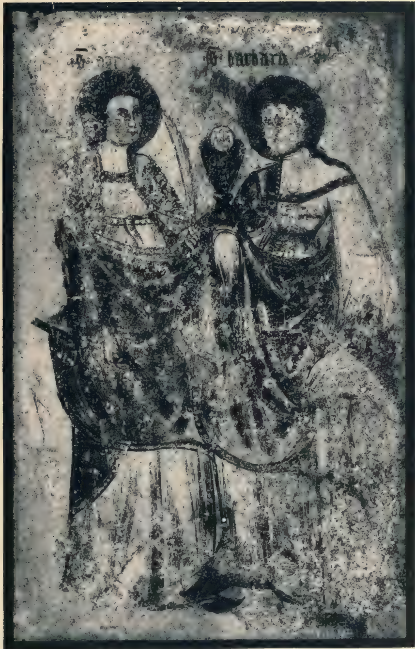
St. Agatha und St. Barbara.