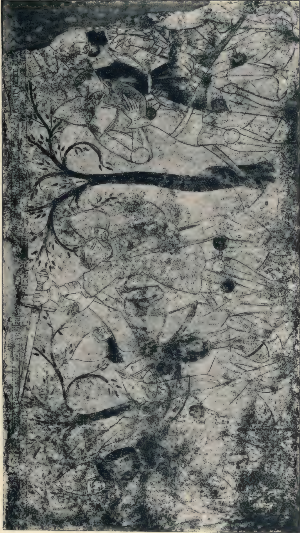
Kampf Dietrichs mit Dietleib von Steier.