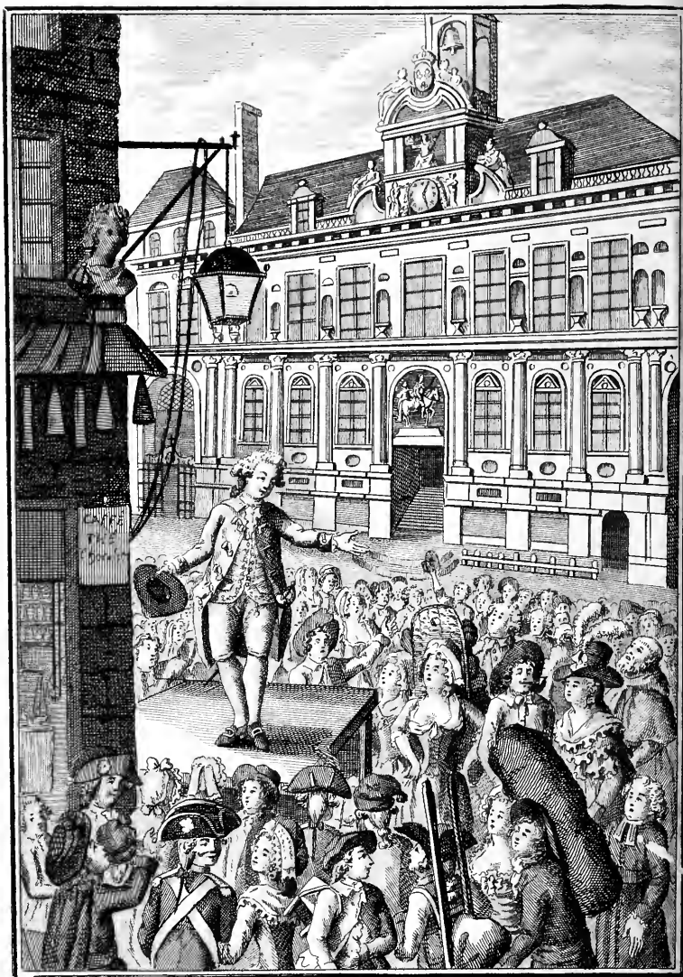
Discours de la lanterne aux Parisiens, le Procureur Général portant la parole.