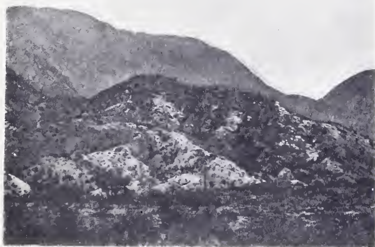
Fig. 2. — Pucará de Los Sauces. El cerro fortificado visto desde el camino carretero

En la parte de la fortaleza accesible por el espolón BB hay una puerta de entrada a . Las murallas se dirigen de ambos lados de esta puerta hacia adentro, formando curvas, desde el interior de las cuales los defensores con facilidad podían defenderla contra un asalto de enemigos que hubiesen subido por el espolón, disparándoles flechas y lanzas de un lado y de otro. Esta entrada está también defendida