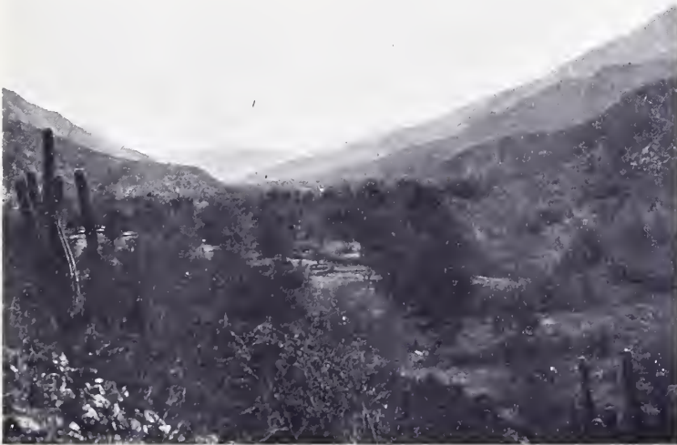
Fig. 1. — La Quebrada de Sanagasta vista del Pucará de Los Sauces hacia Sanagasta

allí hasta su desembocadura de la sierra (672 metros sobre el nivel del mar), es mucho más estrecha que en su parte superior y forma innumerables vueltas. Las paredes de la quebrada las forman montañas altas, estériles, casi siempre á pique, compuestas, como las de la mayor parte de la Sierra de Velazco, de rocas muy friables que dificultan el ascenso aún en las pocas partes donde la pendiente lo permitiría, si las rocas fuesen más sólidas. En la parte superior de la quebrada la vegetación es pobre, los árboles y arbustos especialmente son muy escasos. Pero en Los Sauces hay un pequeño bosque del lado