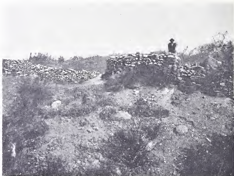
Fig. 3. — Pucará de Los Sauces. Entrada principal al recinto fortificado ( a en el plano)

Por fin, hay en dos partes, donde la naturaleza de la pendiente lo ha aconsejado, defensas avanzadas, las murallas i y j , situadas á unos 15 m. abajo del borde de la planicie.