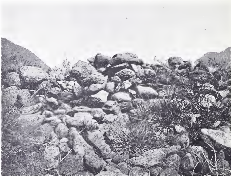
Fig. 4. — Pucará de Los Sauces. Parte de la muralla de la meseta cercada (cerca del punto l en el plano)

Tanto el cerro fortificado como la meseta cercada, me proporcionaron muy pocos objetos arqueológicos: unos cuantos fragmentos de alfarería antigua y una sola punta de flecha en sílex constituyen