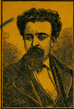
FREDERIC SOLER (PITARRA)