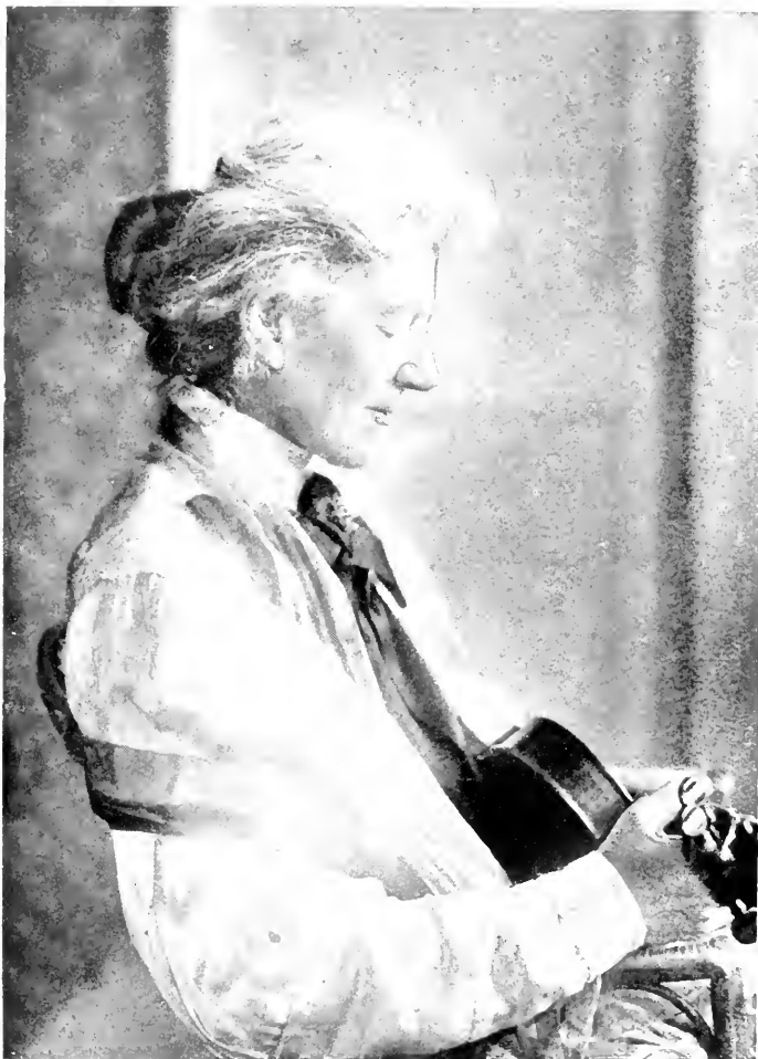
Natalie Bauer-Lechner geb. am 9. Mai 1858. gest. am 8. Juni 1921