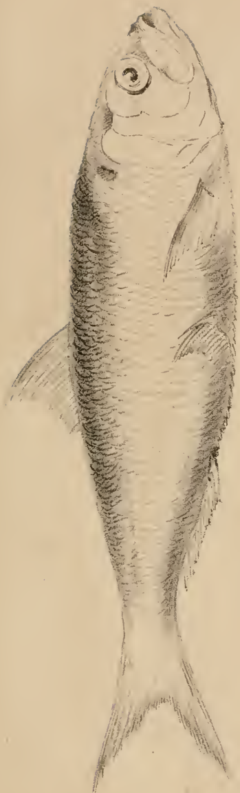
Clupée alossette. Clupea alossetta , Desv.

AMERICAN MUSEUM CENTRAL PARK, NEW YORK. OF NATURAL HISTORY.