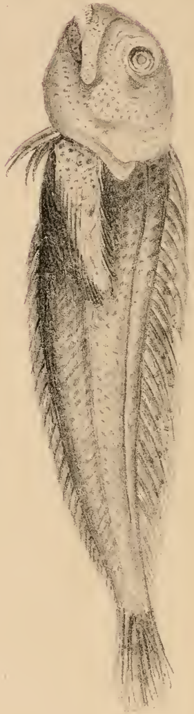
Blennius lentecus , Desv.