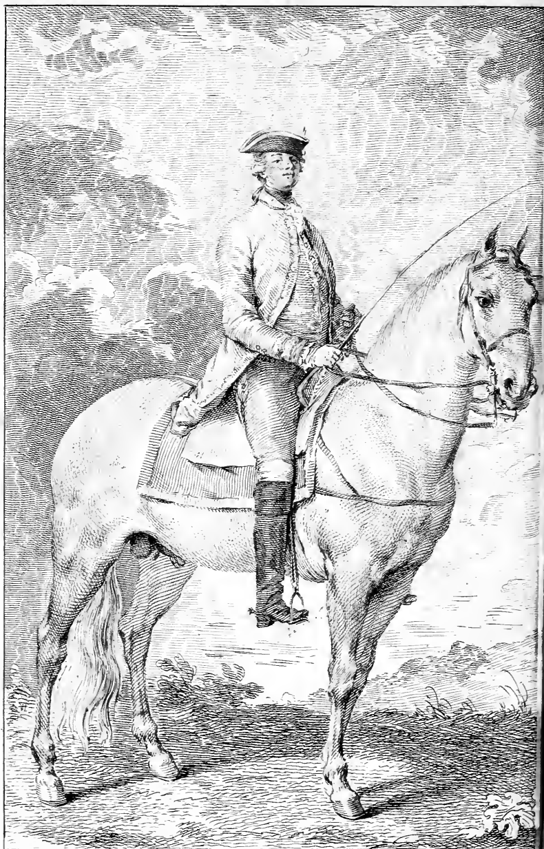
Posture à Cheval, Dessinée d'après nature; où le Cavalier est vu aux trois quarts, et à quatre pieds au-dessous de la Ligne Horizontale.