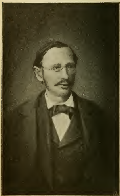
† A. Gremler Verfasser der Exkursionsflora der Schweiz