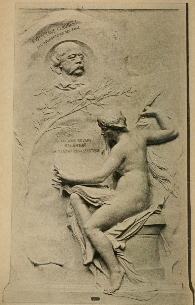
MONUMENT DE GUSTAVE FLAUBERT À ROUEN SCULPTÉ PAR CHAPU