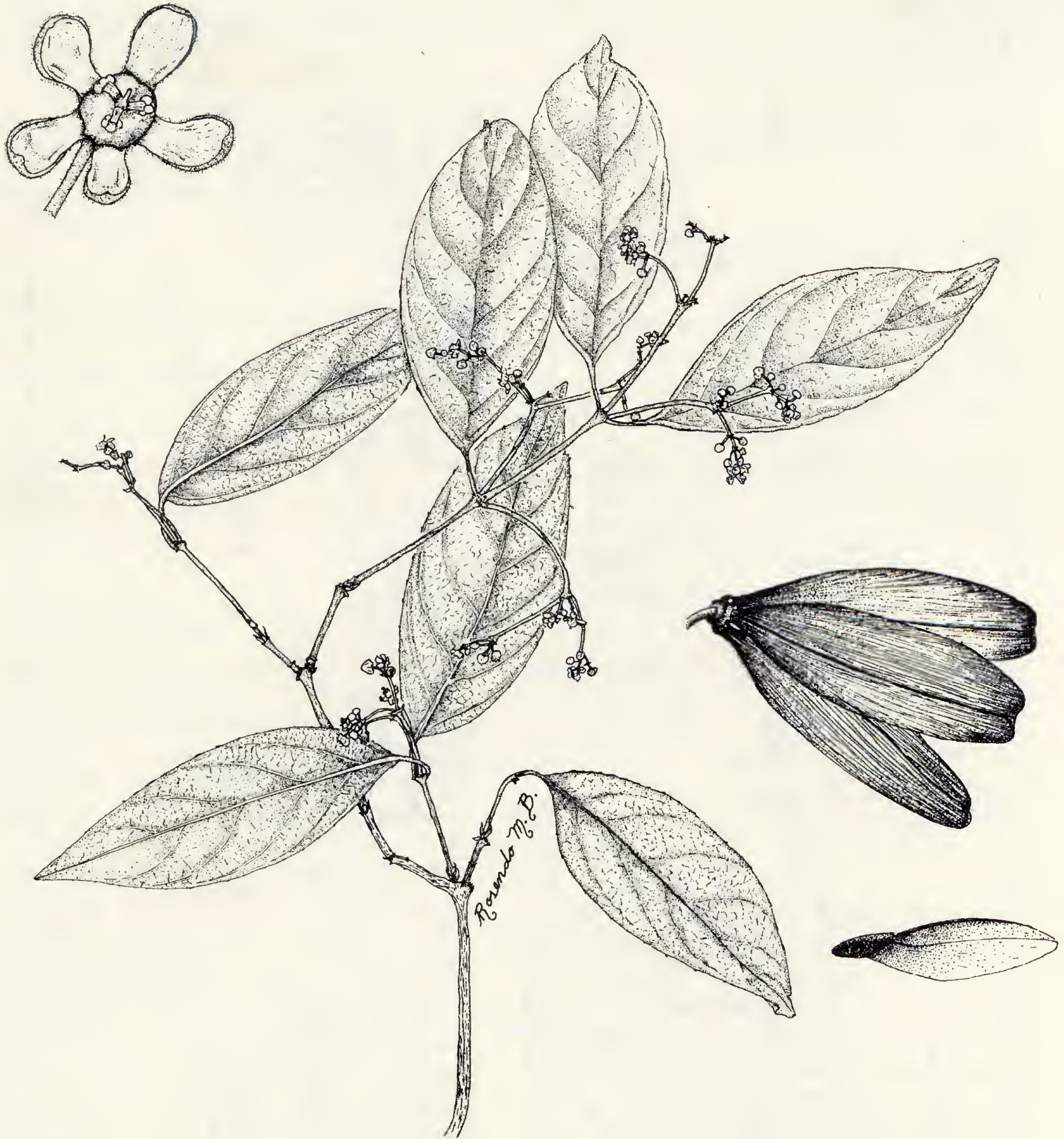
Hippocratea volubilis . a) Rama con flores. b) Detalle de la flor. c) Fruto. d) Semilla. Basado en C. Verduzco 317 y en A. Carter y Chisaki 1185.