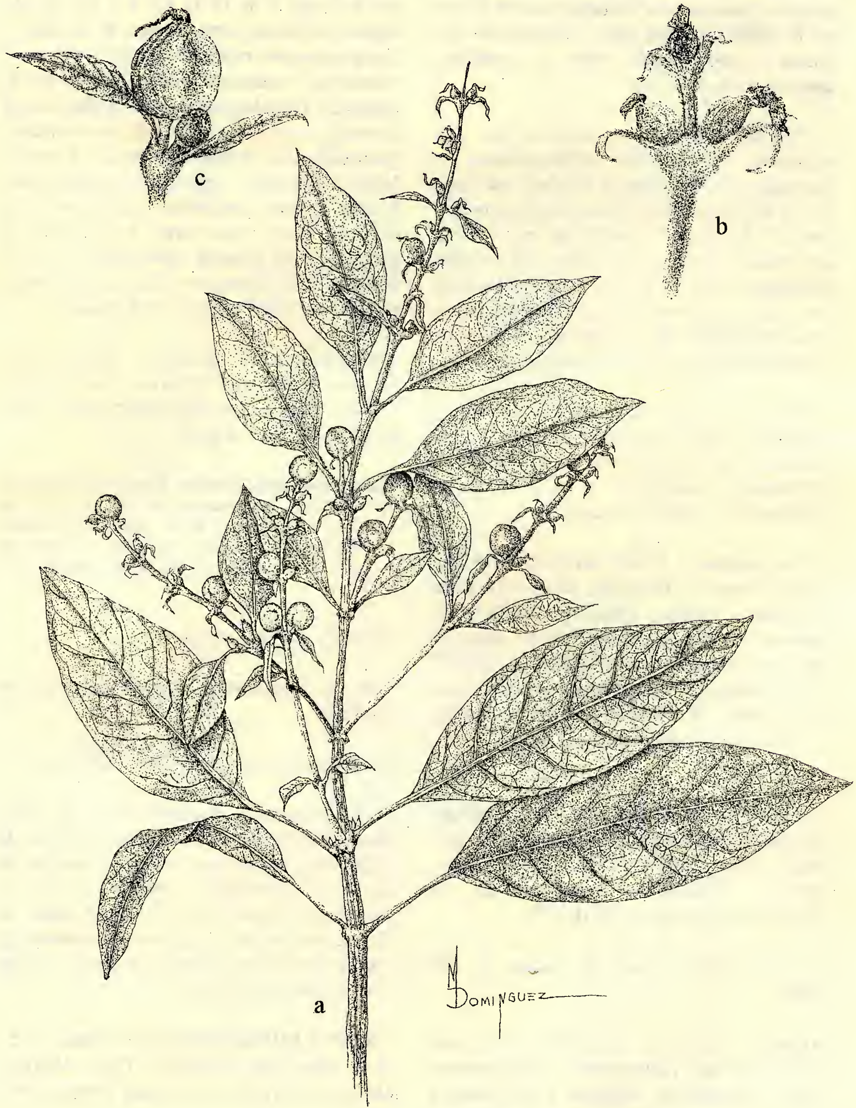
Garrya longifolia a) Rama con estructuras reproductoras. b) Detalle de la flor pistilada. c) Detalle del fruto. Basado en N. Diego 7072.