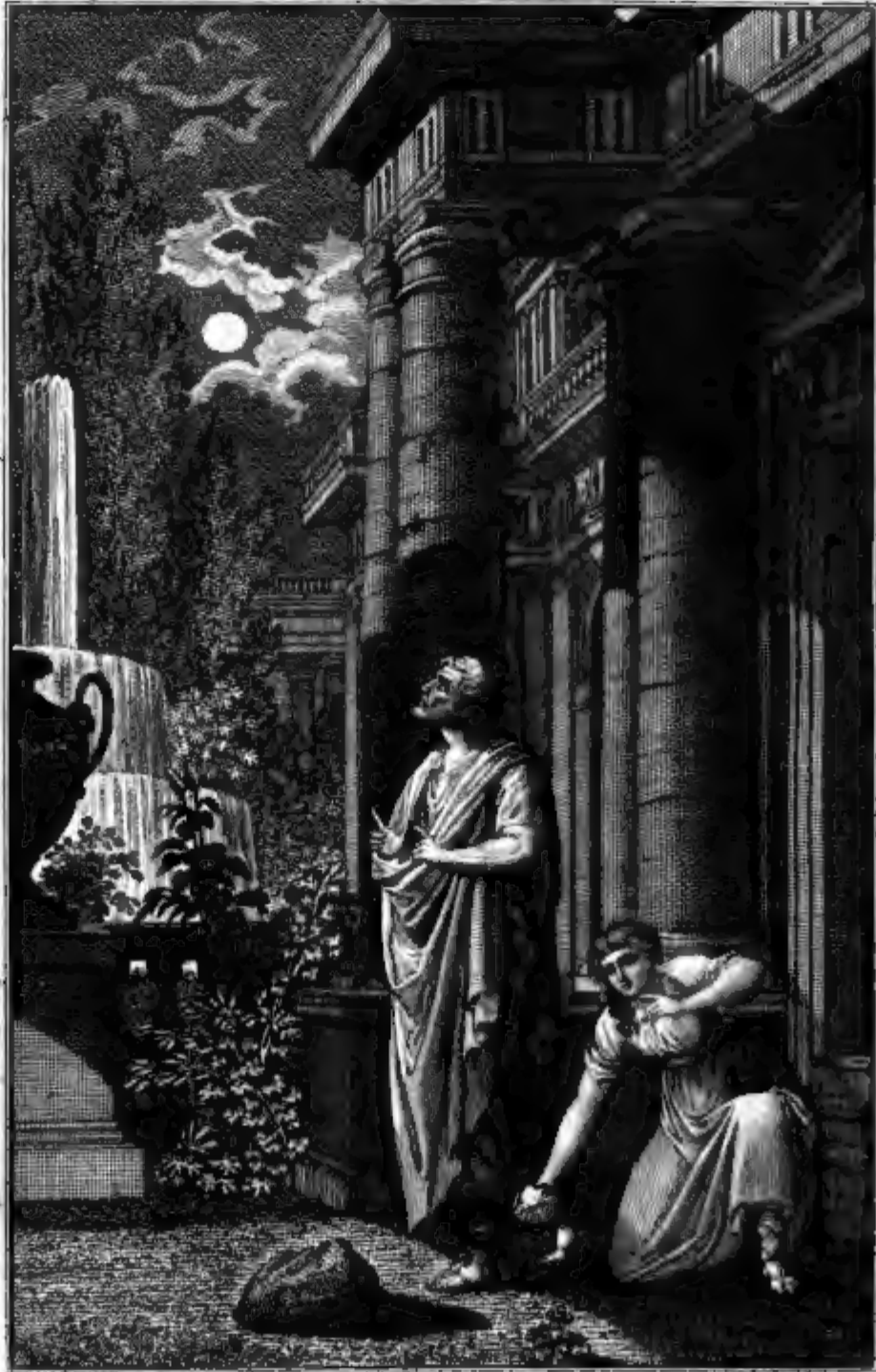
Das milesische Mädchen, und der forschende Philosoph Thales.