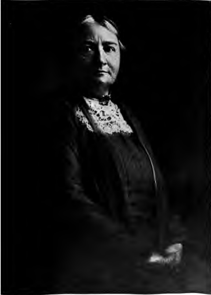
ELLEN KEY, AUTHOR OF "THE YOUNGER GENERATION" G. P. PUTNAM'S SONS