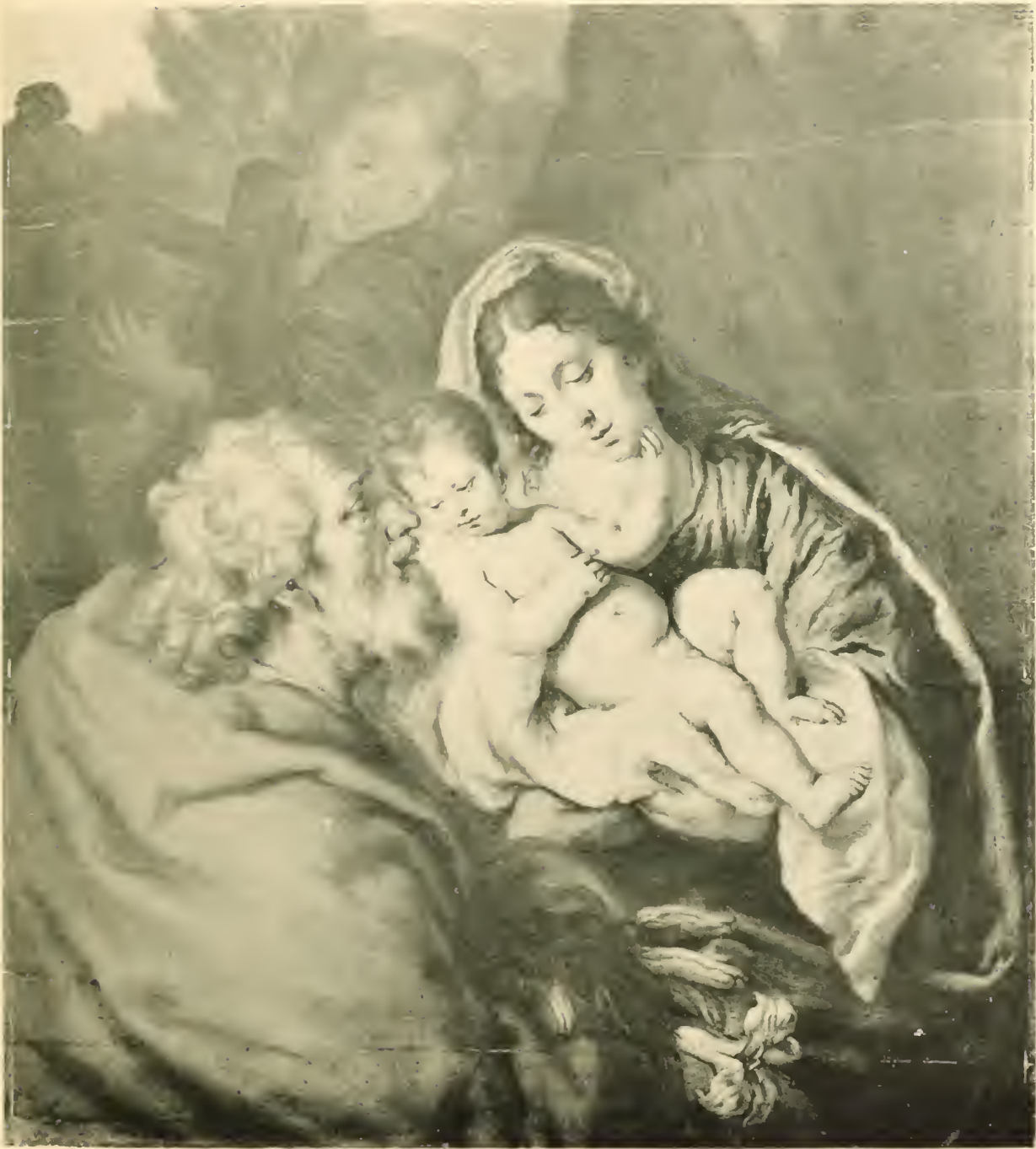
No. 51. J. v. Sandrart.