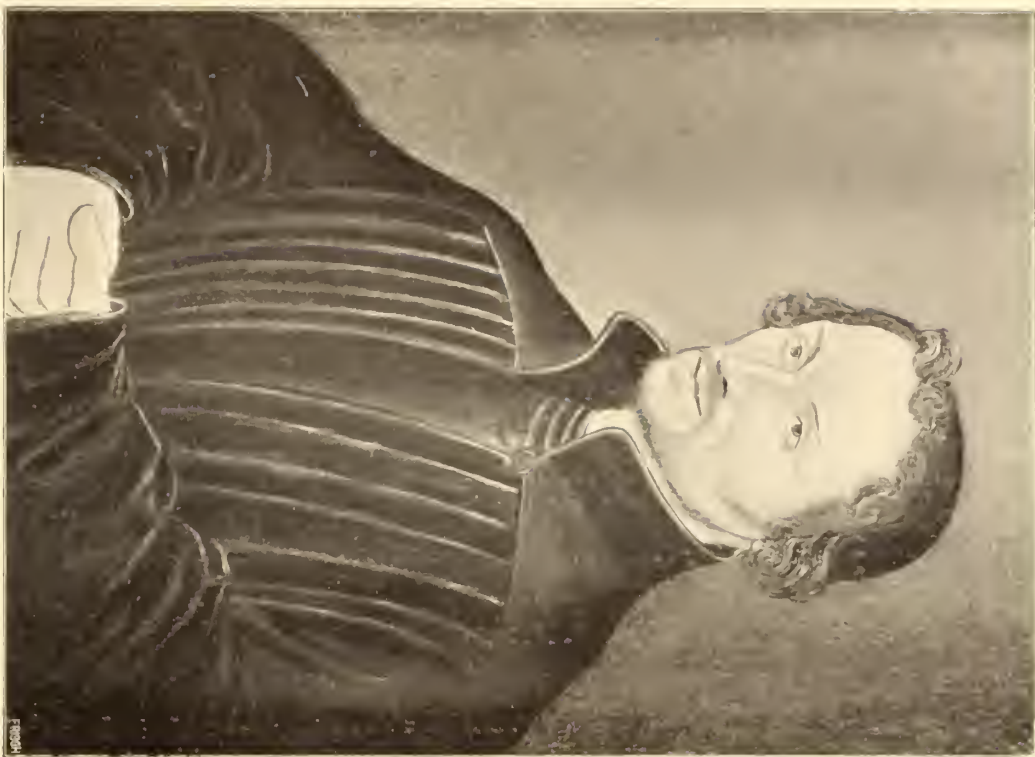
No. 125. Lucas Cranach.