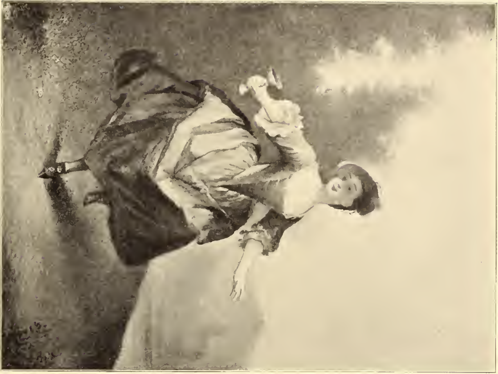
No. 104. Nicolas Lancret zugeschr.