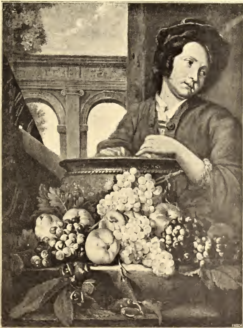
No. 25. Pieter Aertsen.