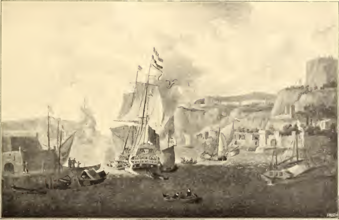
No. 10. Abraham Storck.