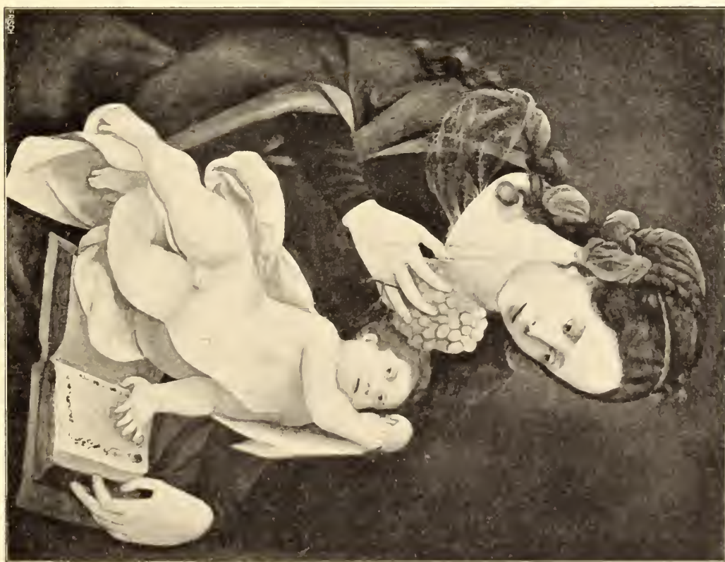
No. 76. Meister der weiblichen Halbfiguren.