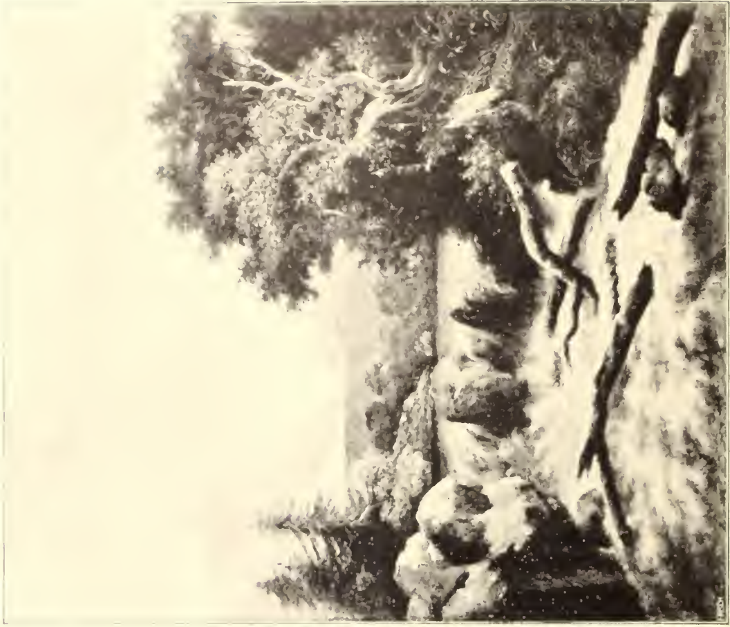
No. 115. J. v. Ruysdael zugeschr.