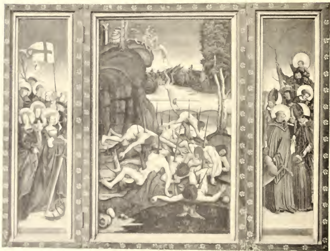
No. 97. Bernhard Strigel.