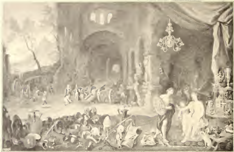
No. 89. Monogrammirt L. H.