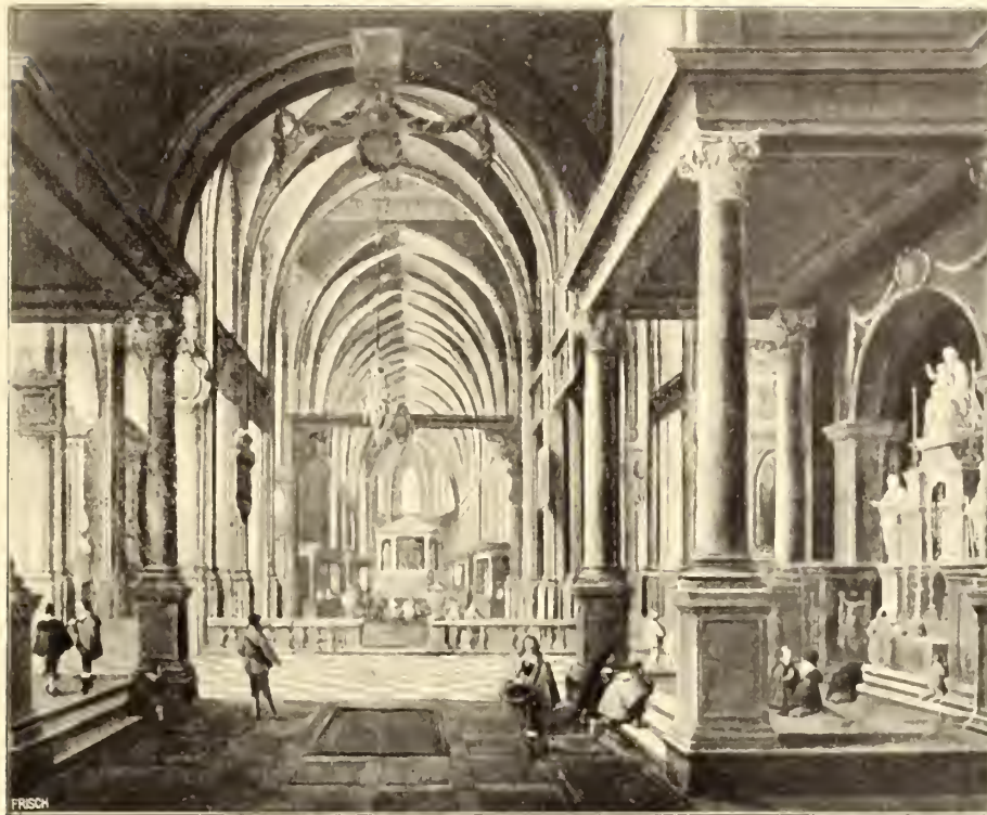
No. 91. Pieter Neeffs.