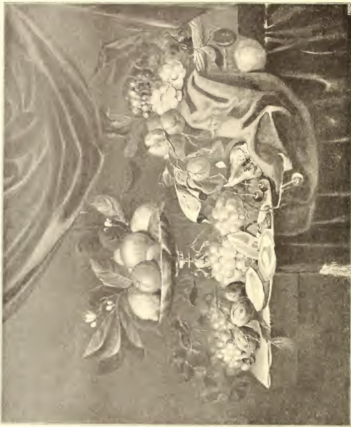
No. 101. Willem Kalf.