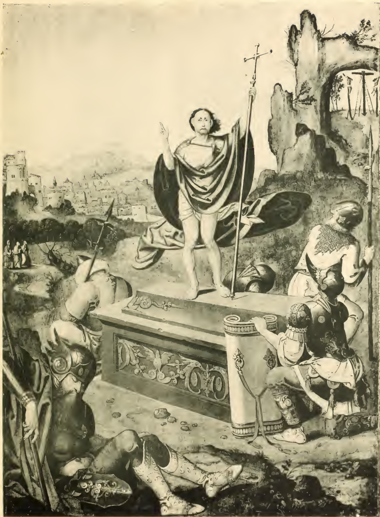
No. 70. Meister der Anbetung der heil. drei Könige.