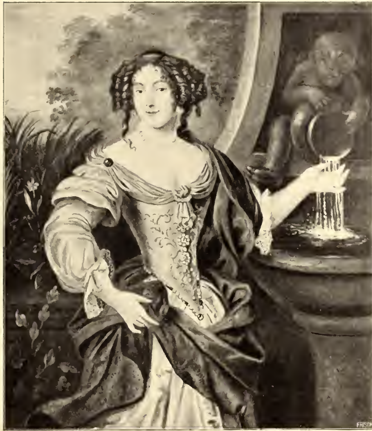
No. 39. Pierre Mignard.