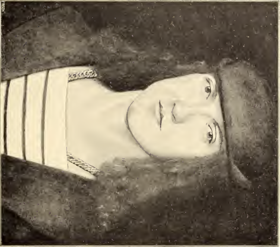
No. 80. Hans Burckmair d. J.