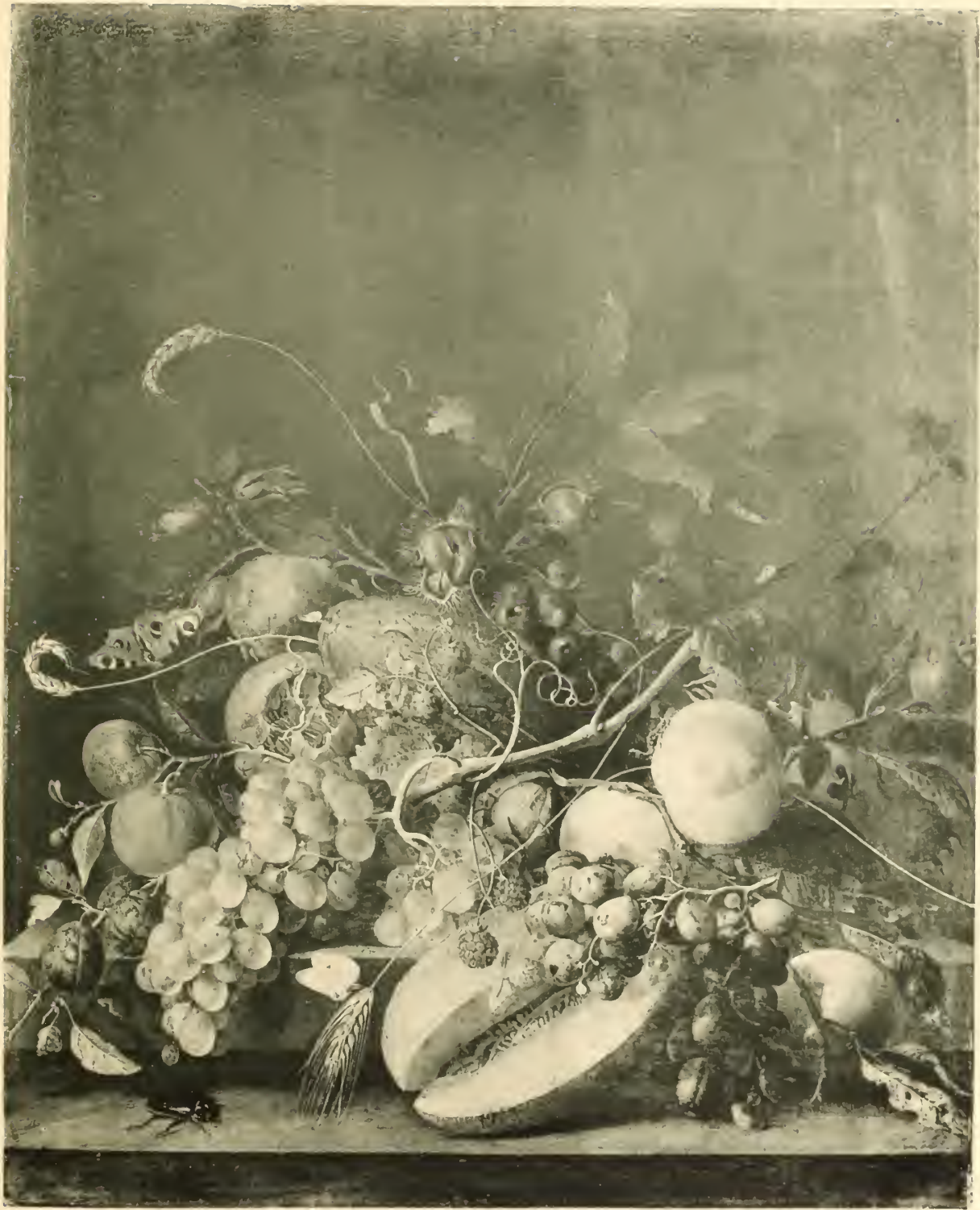
No. 128. J. D. de Heem.