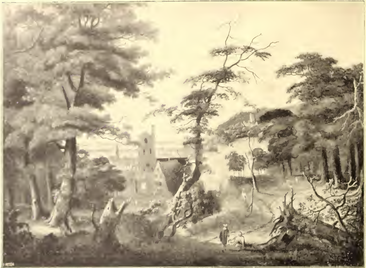
No. 31. Niederländische Schule.