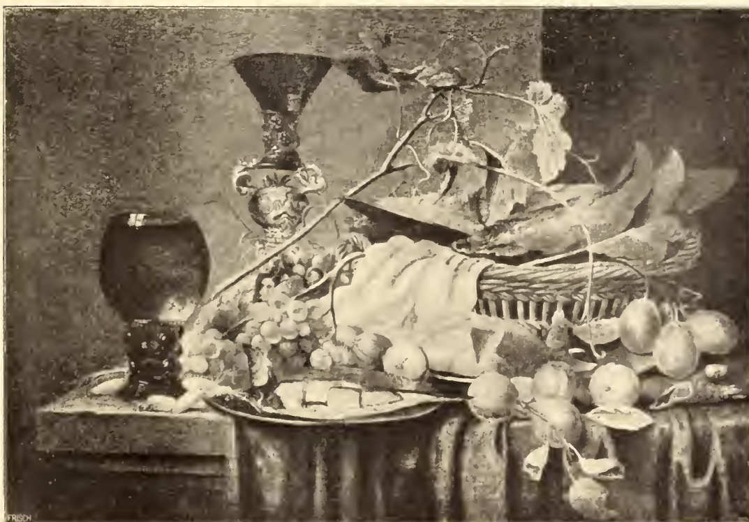
No. 102. Abr. Susenier.