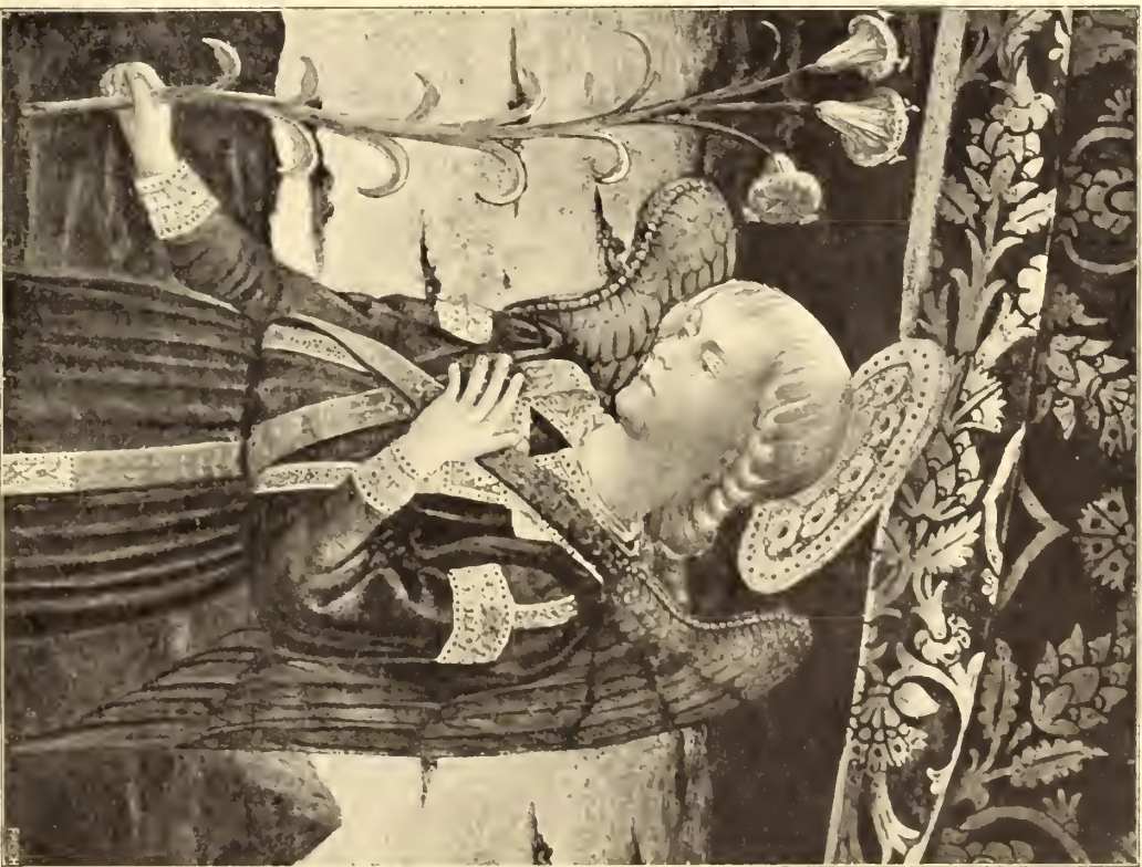
No. 105. Benozzo Gozzoli.