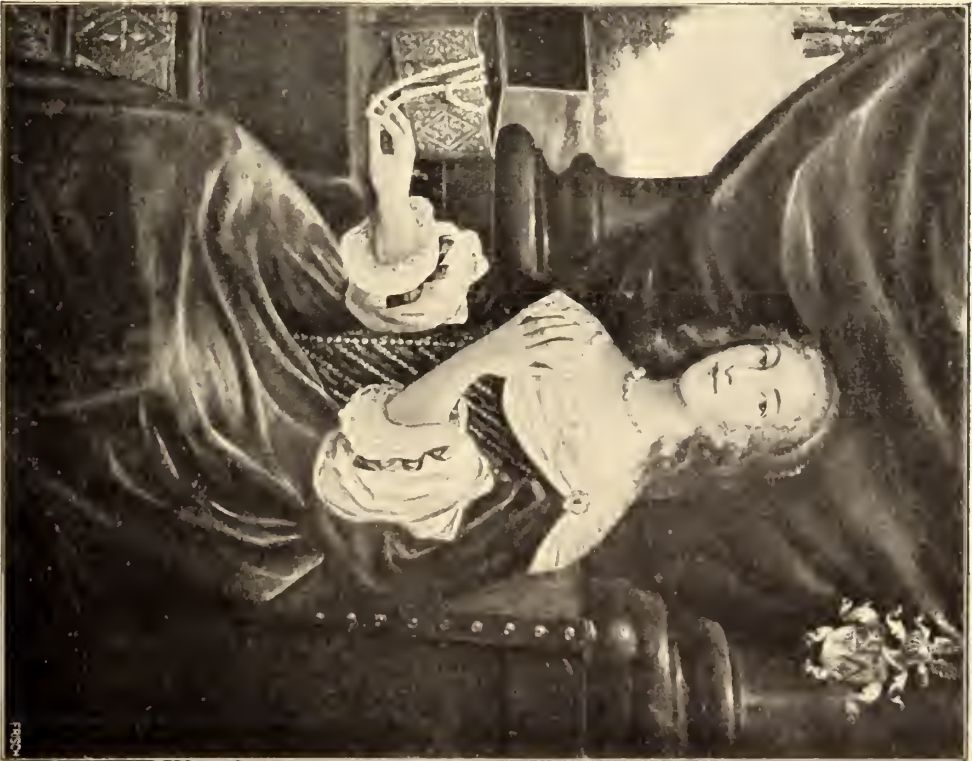
No. 83. Niederländische Schule.