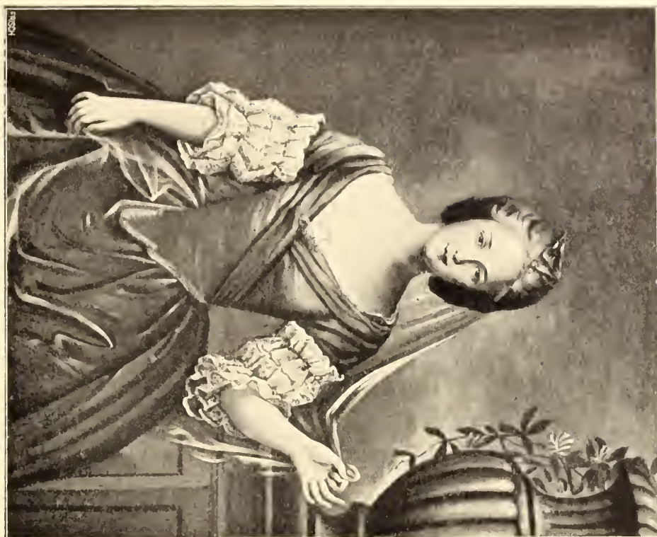
No. 71. J. M. Nattier?