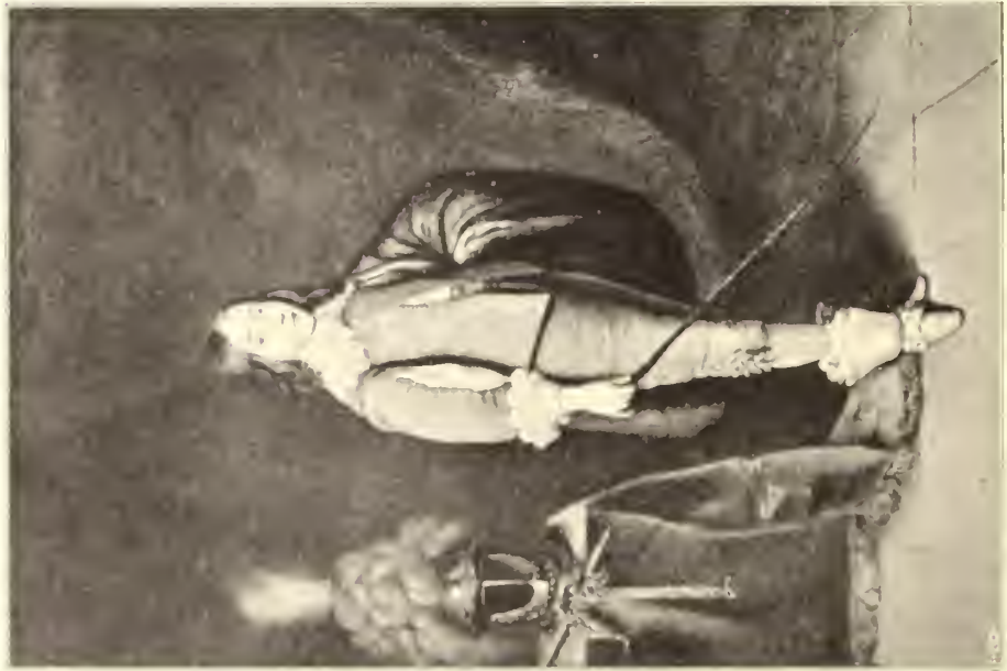
No. 111. Schule des A. van Dyck.