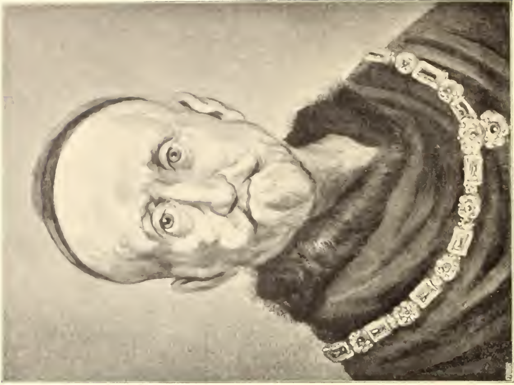
No. 68. Leydener Meister.