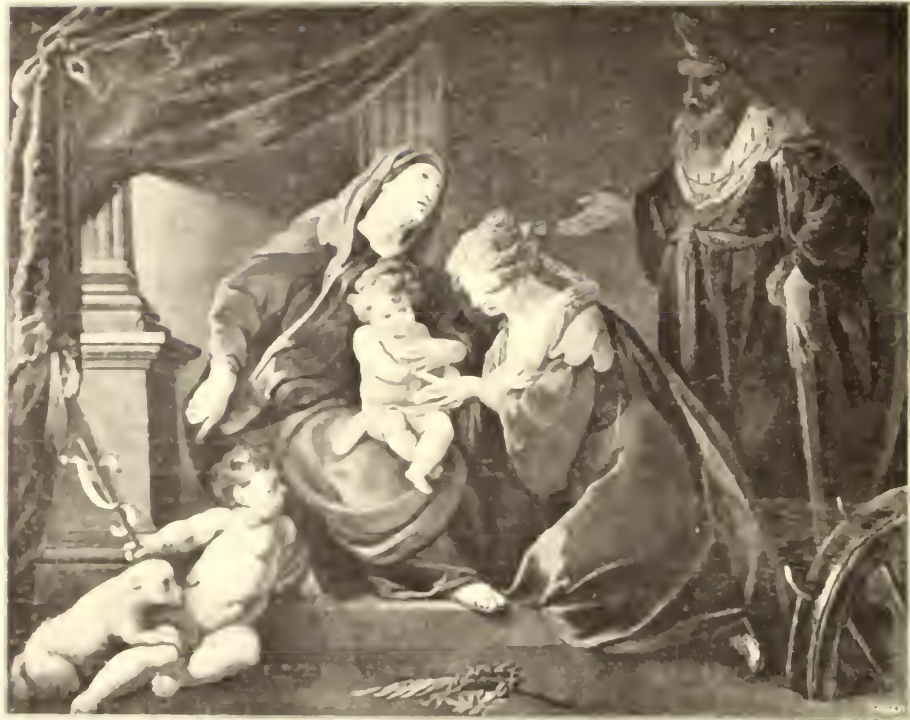
No. 134. Graffonaro.