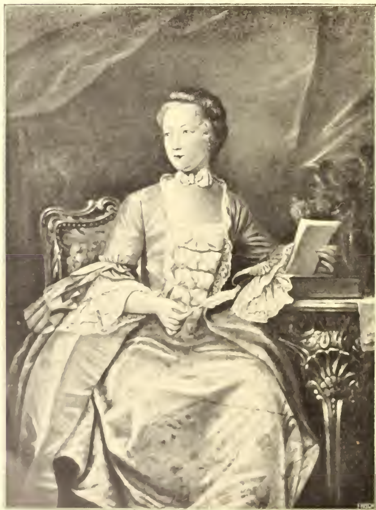
No. 35. J. M. Nattier?