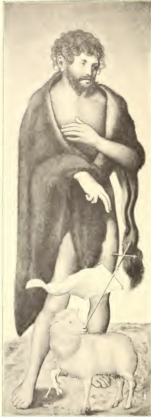
No. 78. Lucas Cranach.