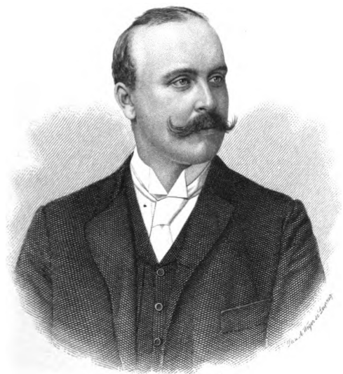
Ernst Fürst zu Löwenstein - Wertheim - Freudenberg.