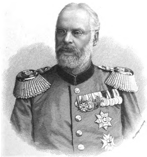
Ludwig Prinz von Bayern