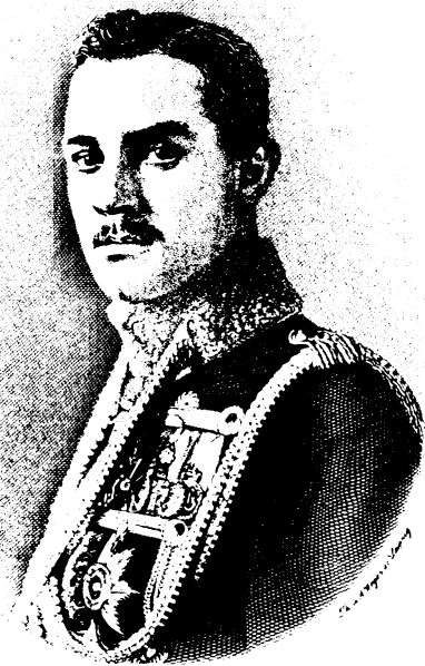
Prinz Ernst August Herzog zu Braunschweig und Lüneburg.