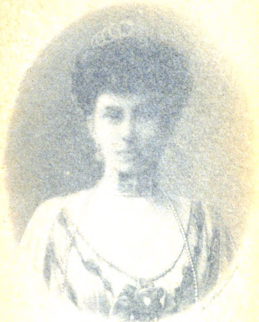
Sophia Königin der Hellenen