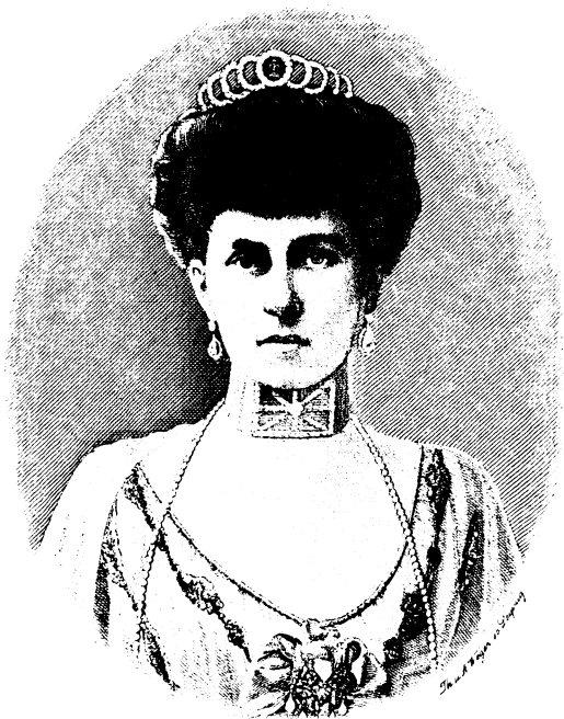
Sophie Königin der Hellenen