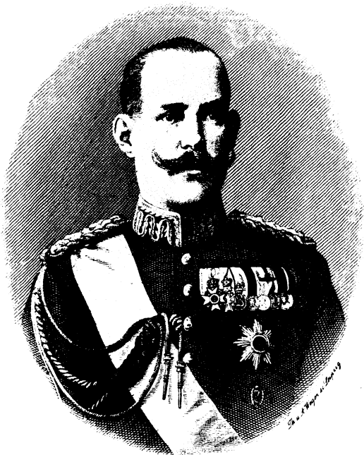
Konstantin König der Hellenen