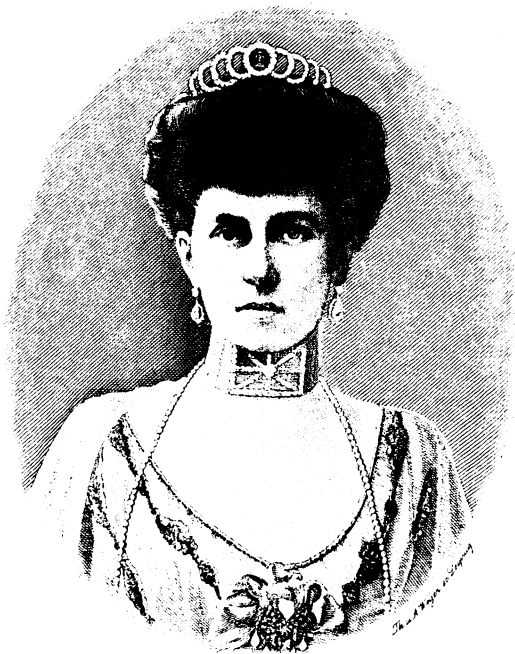
Sophie Königin der Hellenen