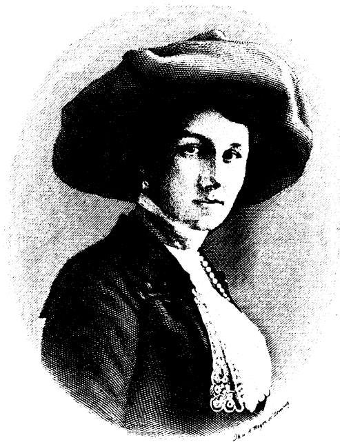
Prinzessin Viktoria Luise Herzogin zu Braunschweig und Lüneburg.