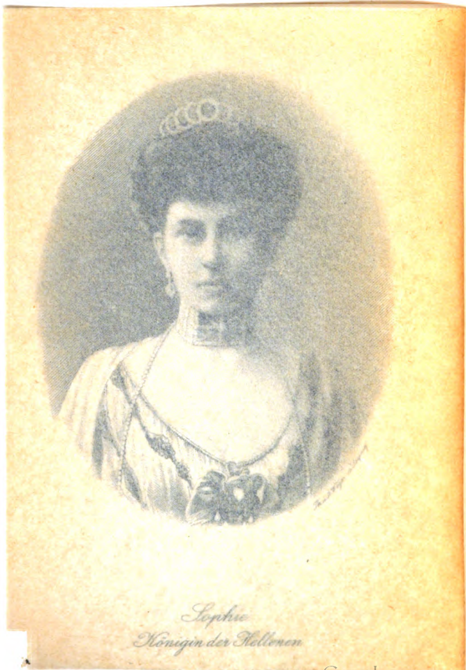
Sophie Königin der Hellenen