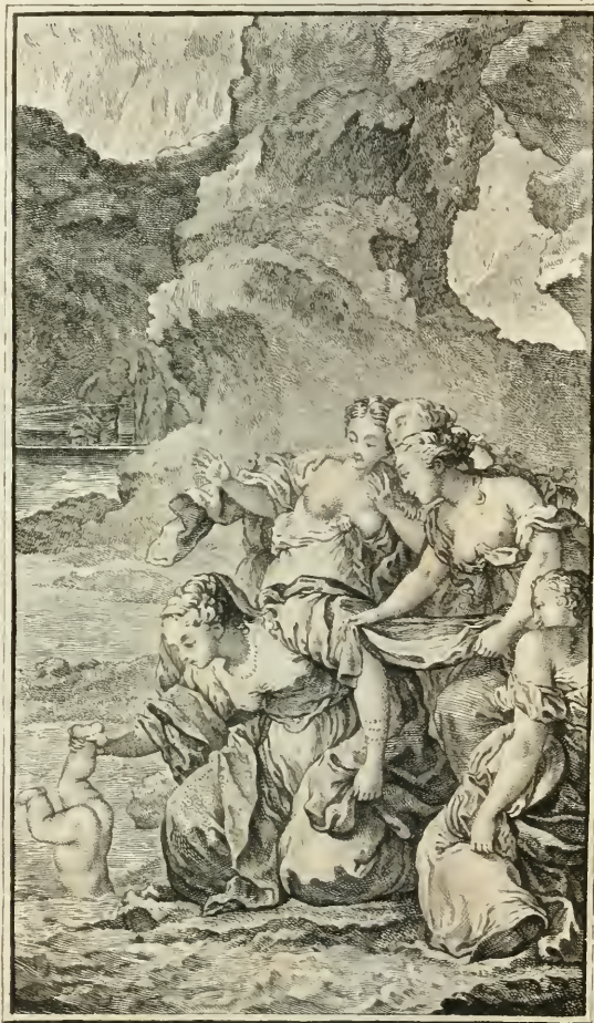
Thetis, liv. I.