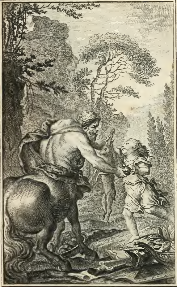
C. Lascu del.