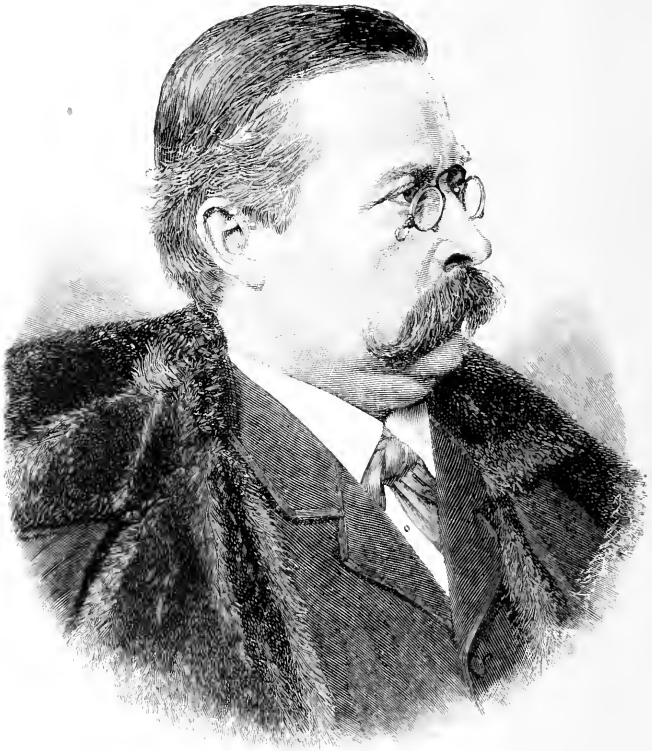
Ernst von Wildenbruch.