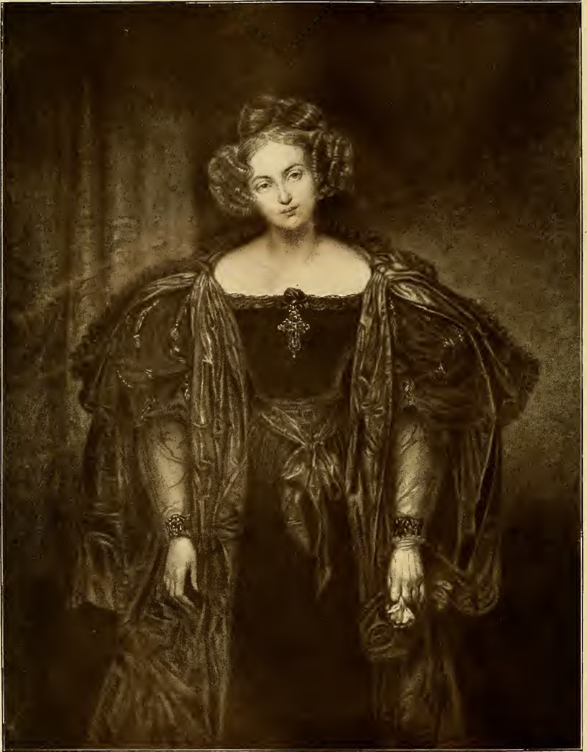
Henriette Sontag als Donna Anna