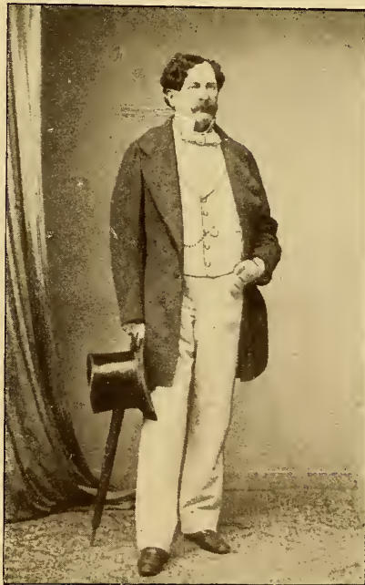
Graf Carlo Rossi Nach einer Photographie