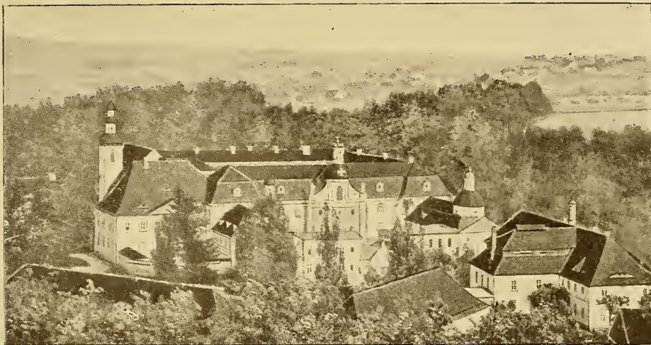
Kloster Marienthal in Sachsen Nach einer Photographie