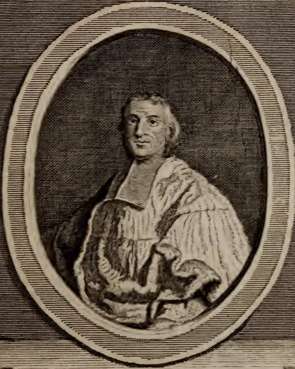
M. L'ABBÉ DE FLEURY DEPUIS CARDINAL.