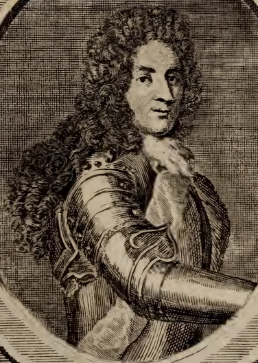
M. LE MARECHAL DE VILLEROY.