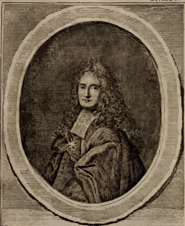
M. FLEURIAU D'ARMENONVILLE GARDE DES SCEAUX.