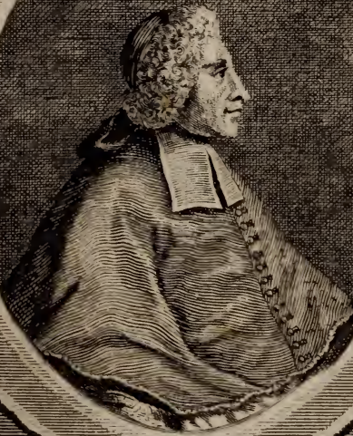
M. LE CARDINAL, DU BOIS PREMIER MINISTRE.