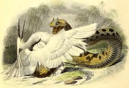
LE CERASTE .