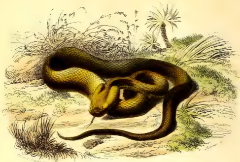
LA VIPÈRE FER DE LANCE.