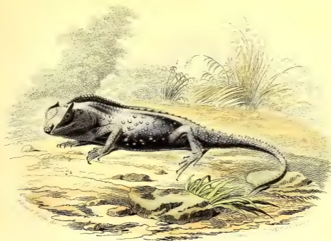
LA TÊTE FOURCHUE.