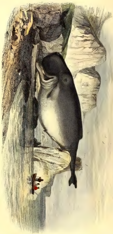
LE CACHALOT MICROCÉPHALE.