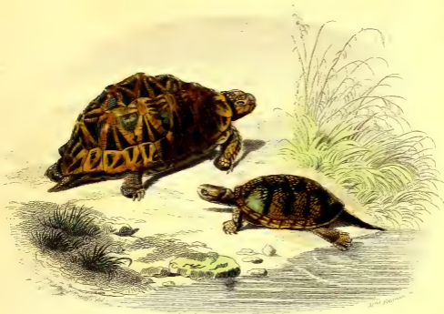
LA TORTUE GÉOMÉTRIQUE.