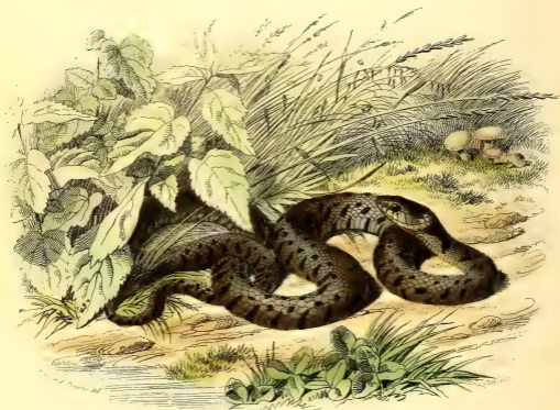
LA COULEUVRE A COLLIER