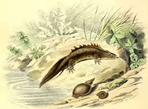
LA SALAMANDRE À QUEUE PLATE (male)