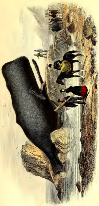
LE PHISMALE CYLINDRIQUE.