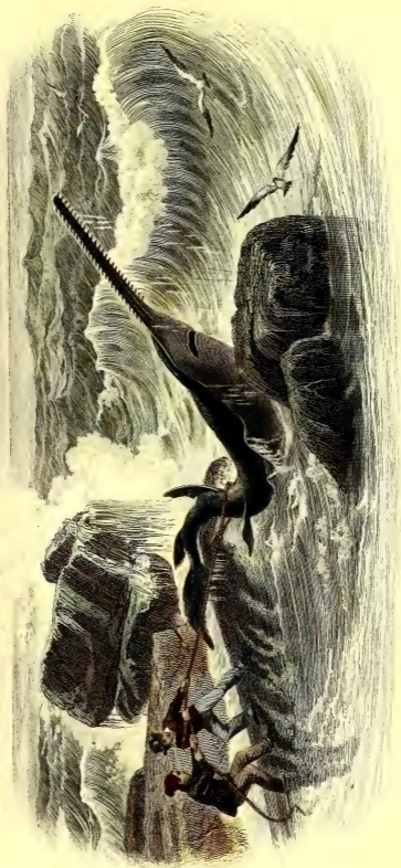
LE SOU-ME SCIE.