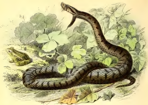
LA VIPÈRE COMMUNE .