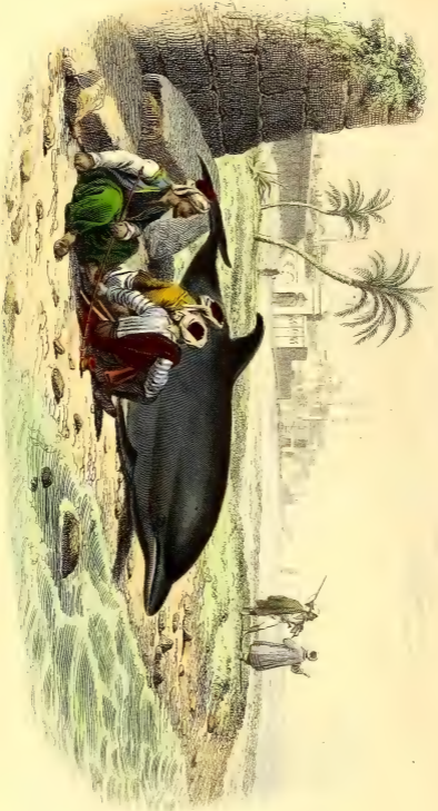
LE DOLPHIN VILGAIRE.