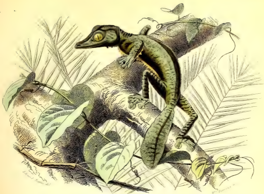
LA TÊTE PLATE.