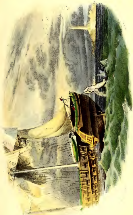
LA PÊCHE DU REQUIN.