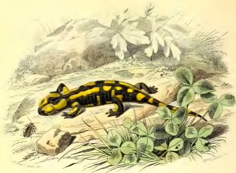
LA SALAMANDRE TERRESTRE.