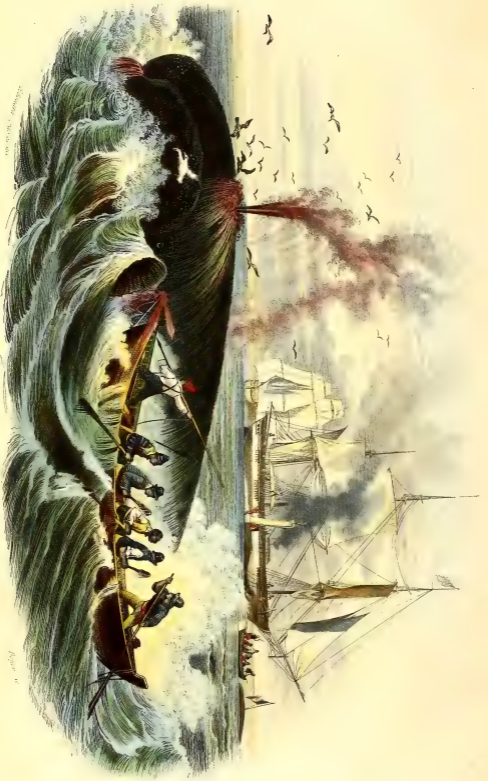
PÊCHE DE LA BALEINE.