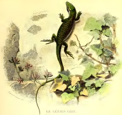
LE LÉZARD VERT.