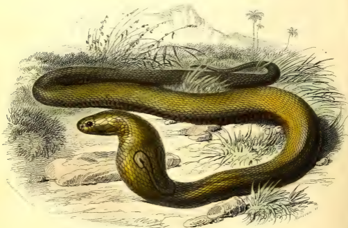
LE SERPENT À LUNETTES.