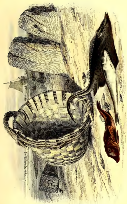
LA TRIGLE CRONDIN, LE MERLAN, LA RAIE BATIS.