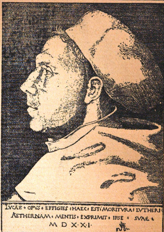
Martin Luther. (Nach Kranach [52].)

„Was Buchwald bietet, hat noch keinen geboten. Wir haben für das deutsche Haus keine Lutherbiographie gehabt, die sich nach Subiegenheit des Inhalts, nach ansprechender, instruktiver Darstellung und nach Billigkeit des Preises mit Buchwald messen könnte. — Nehmen wir nur das Äußere, so müssen wir dem Herausgeber Glück wünschen; schon der große Druck, das Papier, vor allem aber die zahlreichen interessanten Illustrationen machen das Buch zu einem Hausbuch. Wir begegnen den Porträts fast aller hervorragender Männer aus der Zeit der Reformation in möglichst getreuer Wiedergabe nach den vorhandenen Originalen; wir finden Abbildungen von Städten, Burgen und Häusern, die in Luthers Leben Bedeutung gewannen, ja auch gute Reproduktionen der Titelblätter von berühmten Lutherbüchern. Der Inhalt ist des Bilders würdiges würdig. Ein Kenner der Sache, der überall aus dem Vollen greift, fährt hier die Feder. Er hält nichts zurück, was fleißige Forschung der letzten Zeit zutage gefördert hat. Wir hören hier den betenden, redenden und schreibenden Luther in seiner ganzen Urwachsigkeit, Energie und Verbtheit, aber auch in seiner Glaubensinnigkeit und Glaubenskraft reden und sehen ihn vor uns wandeln. So lebensvoll hat ihn das ‚deutsche evangelische Haus‘ noch nicht gesehen; darum wird es, wie gesagt, mit beiden Händen danach greifen und dem Buche einen Ehrenplatz bei sich einräumen.“ (Allgemeine Evangelisch-Lutherische Kirchenzeitung.)