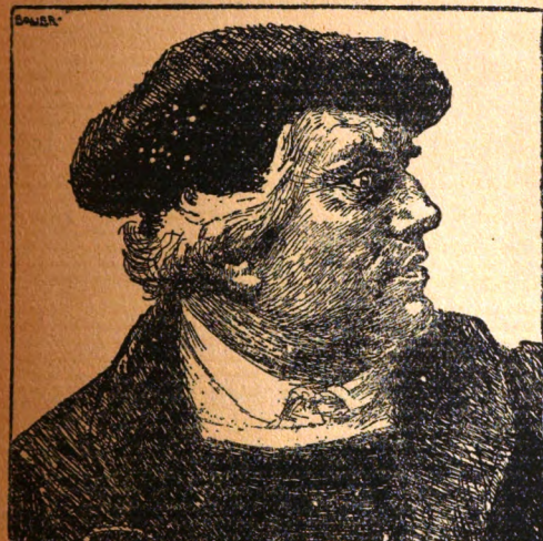
Luther. (Aus den Charakterköpfen zur deutschen Geschichte.)

Sammlungen anderer Tischgenossen zusammengebracht hat. Eine gute, vollständige der Mathesischen Sammlung liegt in einer bisher unbeachteten gebliebenen Handschrift der Leipziger Stadtbibliothek vor. Die Königliche Sächsische Kommission für Geschichte hat die Veröffentlichung der wichtigsten Abschnitte dieser Handschrift unter ihre Publikation aufgenommen. Die Publikation enthält 647 fest datierte, 3. C. zum erstenmal veröffentlichte Reden.