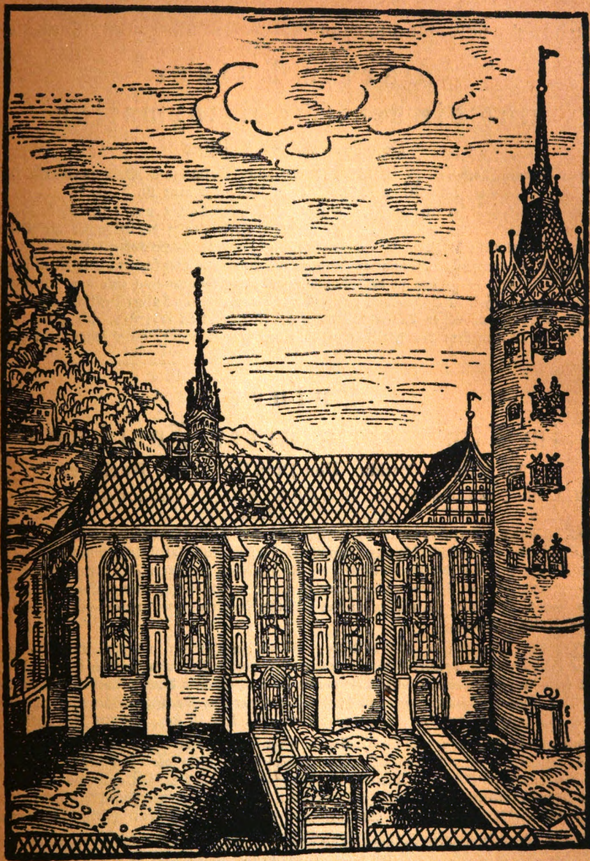
Schloßkirche zu Wittenberg. Nach einem Bilde von Lukas Kranach (1509). Aus Buchwald, Doktor Martin Luther.