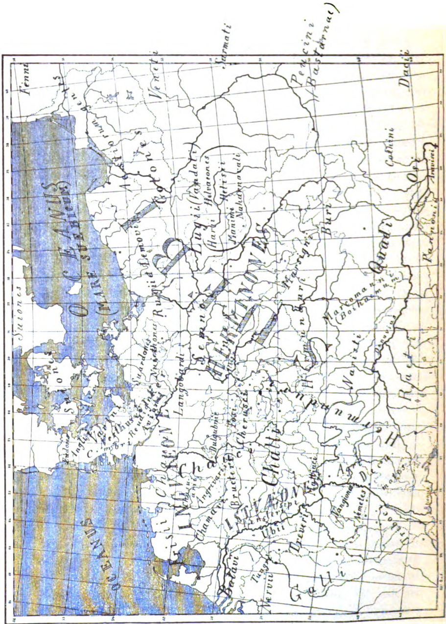
Karte zu Tacitus' Germania