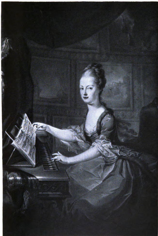
Marie Antoinette am Clavecin Ölgemälde von François Hubert Drouais