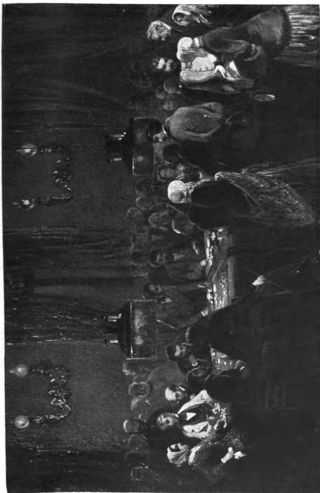
Im Spielsaal von Homburg Nach einem Gemälde