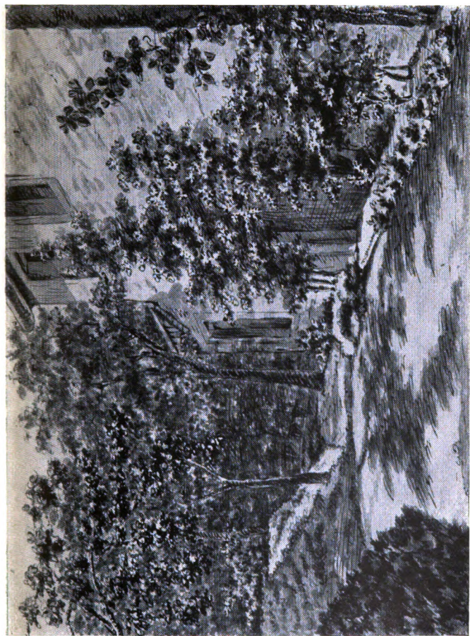
Das Gartenhaus. Handzeichnung Goethes