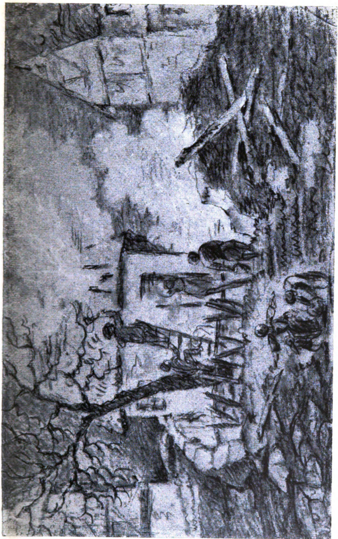
Dorfbrand. Handzeichnung Goethes