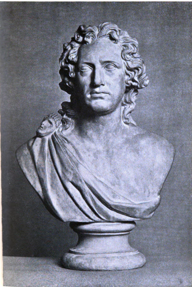
Goethe von G. M. Klauer (Terrakotta; um 1790)