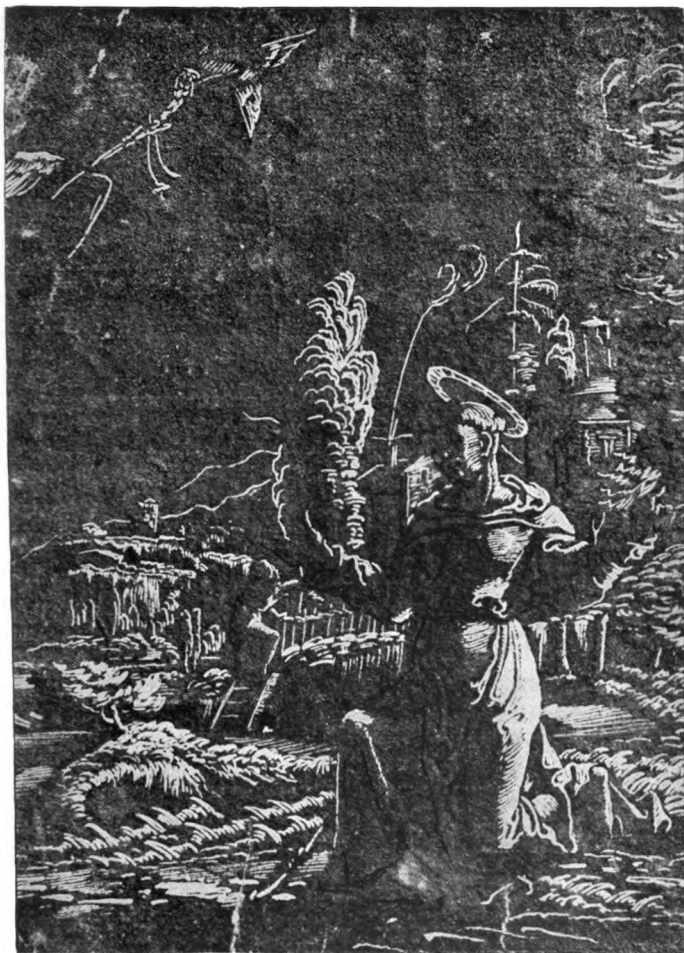
Wolfgang Huber / Der heilige Franziskus Zeichnung