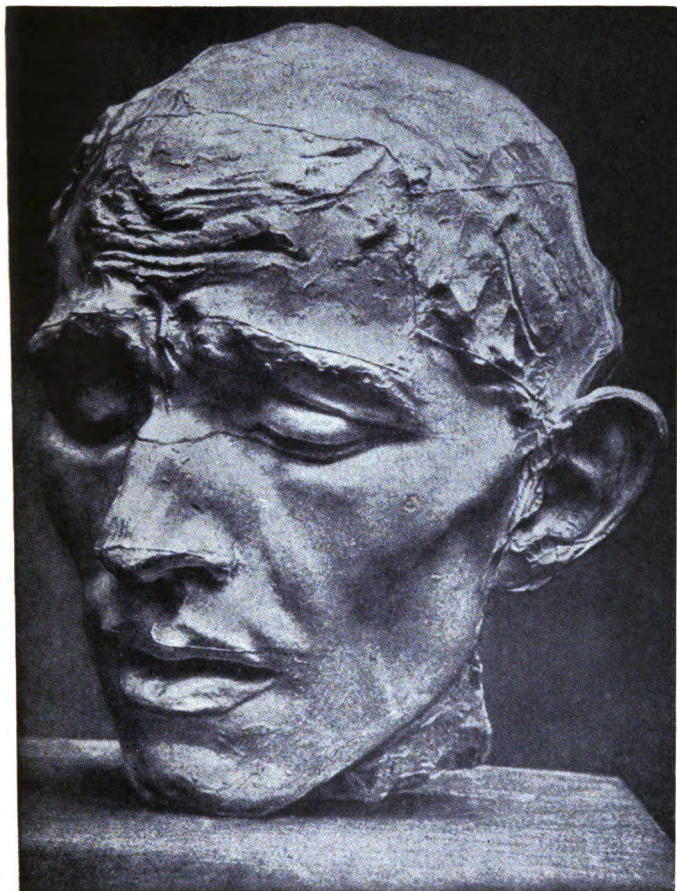
Auguste Rodin Kopf eines der Bürger von Calais