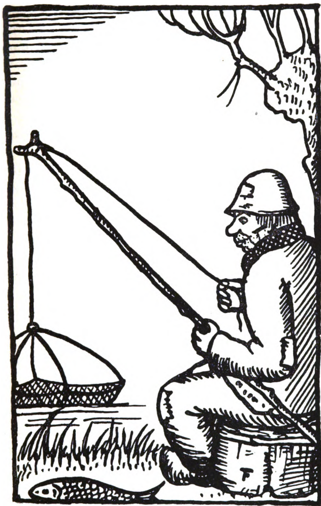
Zeichnung von Felix Timmermans zu Ernest Claes, Hannes Raps