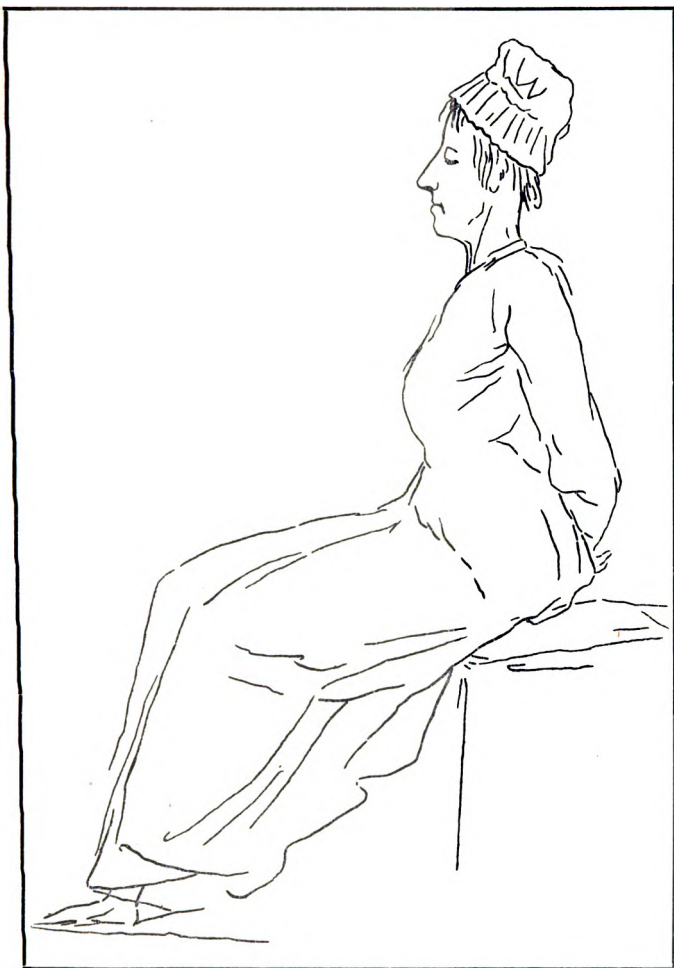
Marie Antoinette auf dem Wege zum Schafott Zeichnung von Louis David