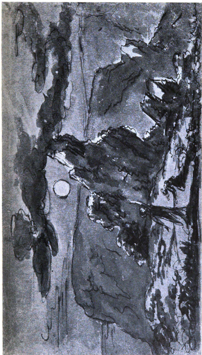
Mondbeleuchtung. Ganzzeichnung Goethes