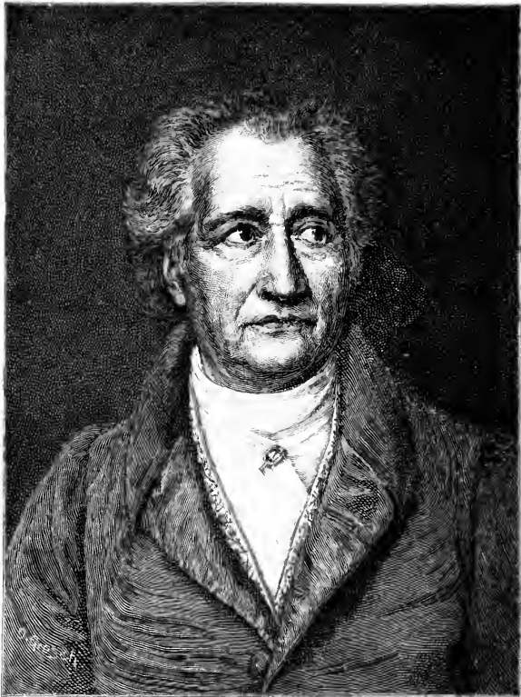
Johann Wolfgang Goethe.