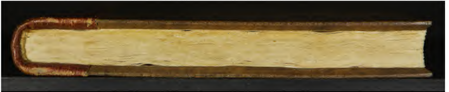
Early European Books, Copyright © 2011 ProQuest LLC. Images reproduced by courtesy of the Biblioteca Nazionale Centrale di Firenze. Magl. C.6.18