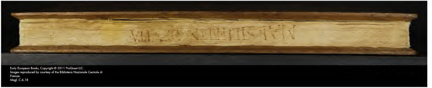
Early European Books, Copyright © 2011 ProQuest LLC. Images reproduced by courtesy of the Biblioteca Nazionale Centrale di Firenze. Magl. C.6.18