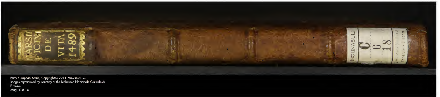
Magl. C.6.18