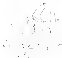
Pteropus , juv.