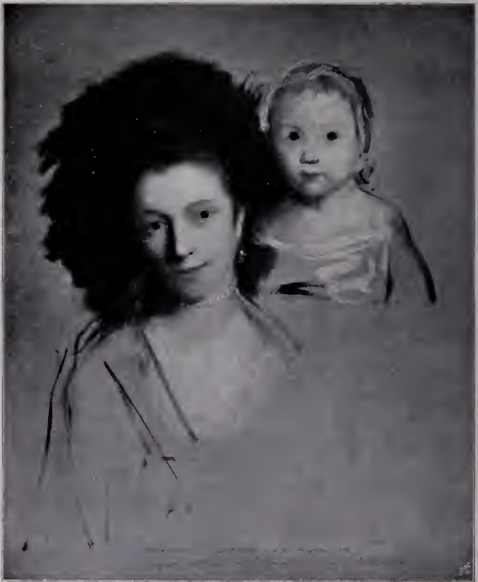
Abb. 15. Georgina Countess Spencer nebst Tochter. 1769. Herzog von Devonshire. (Zu Seite 109 u. 116.)

streitet Gainsborough um den Vorrang, der herrlichste Maler der Kleinen und Heranwachsenden, der Generation der Zukunft zu sein. Alle Zauber seiner Farbenkunst entfaltet Reynolds, wenn er die vornehmen Damen des reichen London und ihre Nachkommenschaft verewigt. Die Ladies und Herzoginnen, die mit ihren Kindern spielen und tollen, erscheinen in seligem Mutterglück, und auch die andern Genossen des Hausstandes, die kleinen Luzzuhunde dürfen nicht fehlen — denn auch die Tierliebhaberei und vor allem die Zärtlichkeit für die Hunde bedeuten ein Stück England. Die Schönen der Aristokratie tragen, unarmen und lieblosen ihre Babies, sie heben sie hoch, drücken sie an sich und betrachten sie mit lächelndem Blick. Nun ist die Gruppe lebhaft bewegt, in kühn geschwungenen, breiten Pinselstrichen souverän hingezeichnet und doch dabei fein und glücklich abgewogen. Nun wieder ist alles ruhig und still gehalten, als friedvolles Idyll. Oder die Kinder erscheinen allein, und alle Zartheit und aller Schmelz der delikatesten Töne müssen helfen, ihre unschuldige Schönheit wiederzugeben. Reynolds kann von diesen Motiven des englischen Lebens auch dann nicht los, wenn er sich selbst