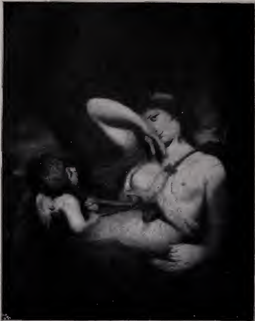
Abb. 89. Die Schlange im Grabe. 1782 bis 1784. London, Nationalgalerie. (Zu Seite 108, 122 u. 124.)

die natürlichen Grundlagen seiner Kunst zu borniert-akademischem Doktrinarismus. Der goldene Baum des Lebens und die grünen Gespenster der Theorien wachsen nebeneinander aus dem Boden desselben Geistes hervor.