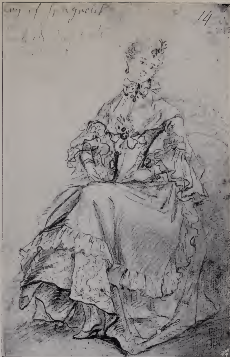
Abb. 110. Aus einem italienischen Taschenbuch. British Museum 130, Nr. 10, S. 14. (Zu Seite 123.)

unterschätzt. Jedenfalls deshalb, weil er die Bedeutung dieser genialen Kraft gar nicht erkannte. Was ihm mühelos gelang, galt dem Akademiker nicht so viel, wie das, was er sich im Schweiß seines Angesichts erquälen mußte. Wir, die wir seinem Lebenswerke objektiver gegenüberstehen als er selbst, staunen immer wieder über die steigende Sicherheit, mit der er jede Aufgabe sofort übersah, in jedem Fall von einer neuen, ohne Zwang ihm zufließenden künstlerischen und malerischen Idee getrieben. Die wirklich verfehlten Arbeiten sind gering an Zahl, obschon sie unter den zweitausend Porträts seiner Hand, die wir kennen, nicht fehlen. Man muß annehmen, daß bei der ersten Sitzung, besser beim ersten Blick auf sein Modell seinem durchdringenden Auge das Wesen des Menschen, der da vor ihm stand, ohne weiteres sich enthüllte, und daß er ohne viel Überlegung die Haltung, die Stellung, die Geste und den Farbenakkord fand, die zur Charakteristik dieser Individualität geeignet waren. Was ihm an herzlichem Empfinden etwa mangelte, ersetzte er vollauf durch seine Anlage zur Disposition und Ökonomie der Arbeit. Ja, gerade dieser Mangel,