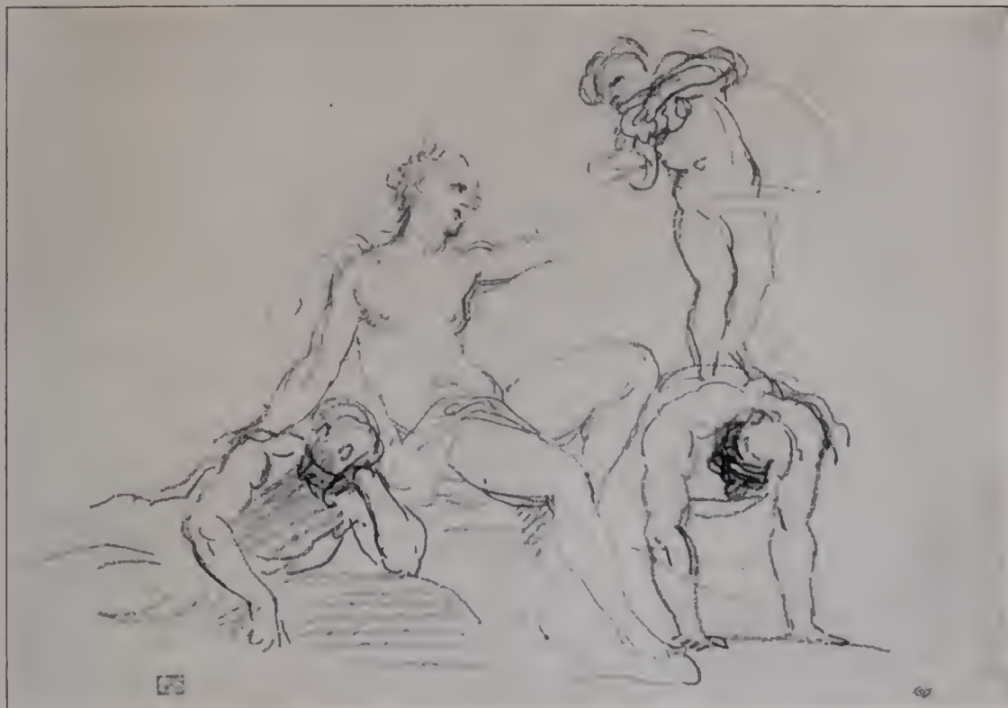
Abb. 103. Studienblatt. British Museum. (Zu Seite 121.)