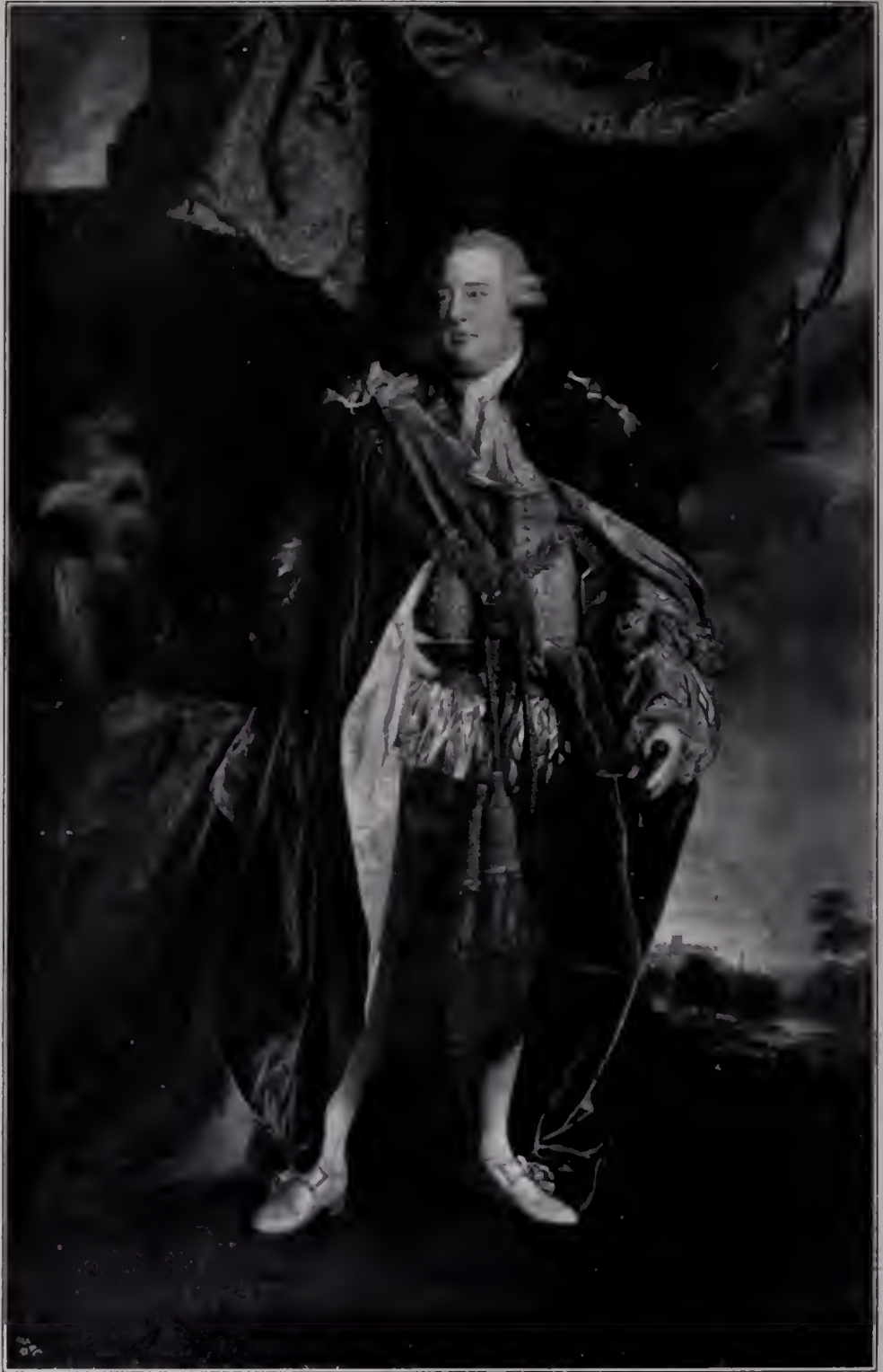
Abb. 19. William Augustus, Duke of Cumberland. 1758. Duke of Devonshire. (Zu Seite 116.)