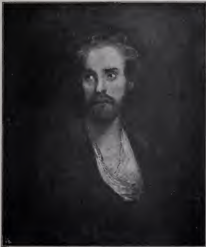
Abb. 30. The banished Lord. London, Nationalgalerie.