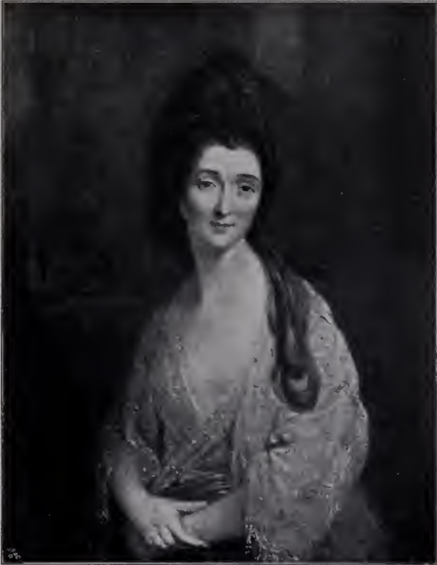
Abb. 40. Bildnis einer unbekanntten Dame. (Zu Seite 117.)

zu seinem Lebensende eine Neigung zur Satire und ein gutes Verständnis für das unfreiwillig Komische nachgesagt wird. In der frühesten Jugend allerdings scheint Reynolds, noch in Plympton, mancherlei karikaturistische Versuche verübt zu haben: es wird sogar erzählt, daß ihm der Spitzname „der Clown“ beigelegt wurde. Nun löst das freie Leben in der italienischen Hauptstadt in ihm einen inneren Jubel, der irgendwie zum Ausdruck gelangen muß. Es ist eigentümlich zu beobachten, wie diese Erscheinung bei Temperamenten aller Schattierungen wiederkehrt. Erst kürzlich ward aus der römischen Zeit