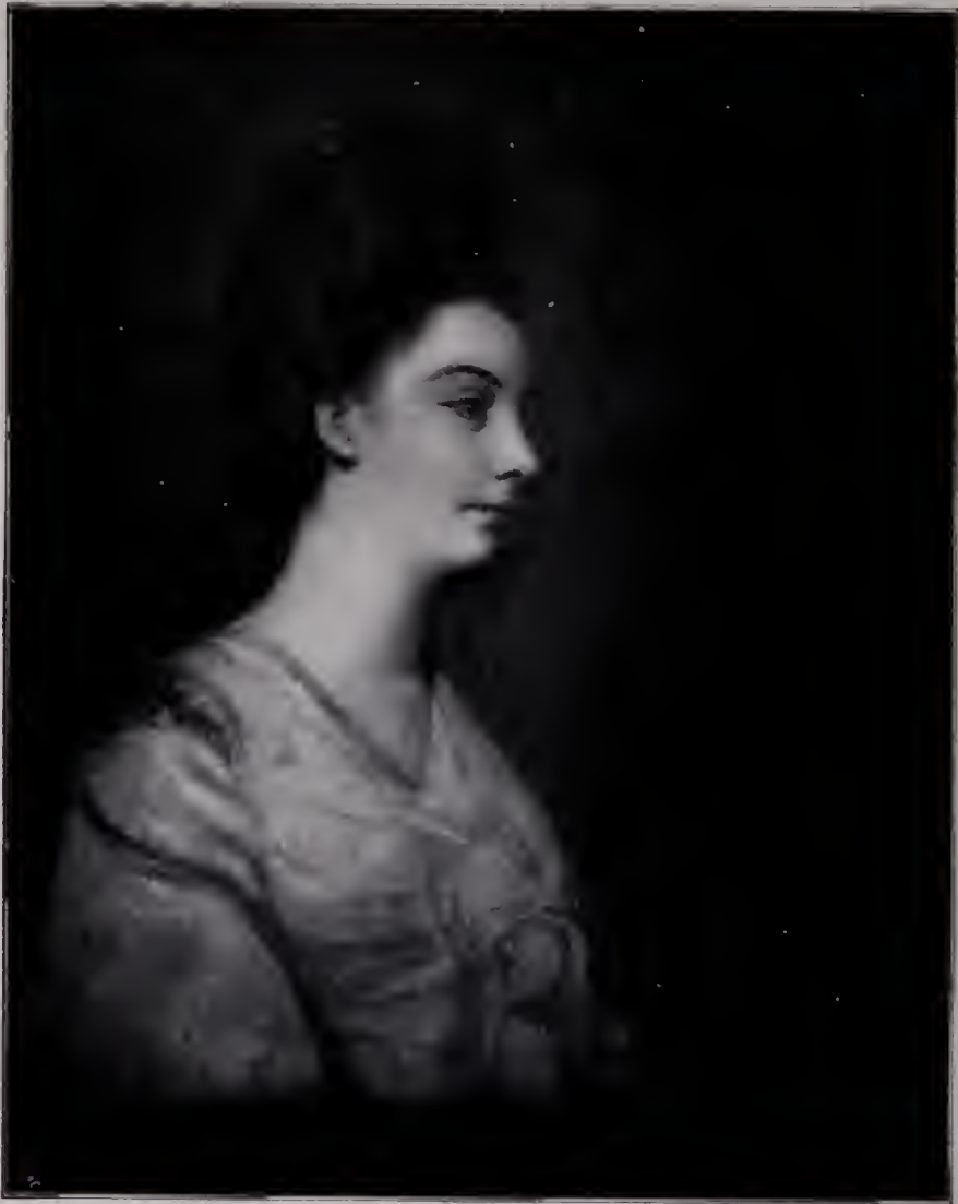
Abb. 37. Elisabeth Anna Linley (Eliza Sheridan). Glasgow, Gemäldegalerie. (Zu Seite 117.)

Kunst der blassen, allgemeinen Abstraktionen, die sich ihrer Herkunft als einer gesteigerten Fähigkeit der Sinne schämt und mit der Gelehrsamkeit, der Philosophie, der Geschichtswissenschaft, der Mythologie, der Ethik kokettiert.