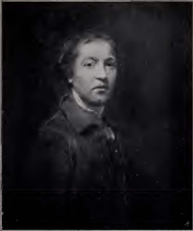
Abb. 3. Selbstporträt von 1750. London, Nationalgalerie. (Zu Seite 62.)

war zum Glück geboren. Die ruhige Sicherheit seines Wesens, die Klarheit seines Blickes, die Reife und Bestimmtheit seines Urteils, sein unerschütterliches Selbstbewußtsein und Selbstvertrauen, das bei aller ernstesten Kritik des eigenen Schaffens nie in unfruchtbare Zweifel fiel, die beneidenswerte Fähigkeit, alles Kleine, Feinliche, Störende und Unangenehme mit vornehmer Gebärde von sich fernzuhalten, die Festigkeit, mit der er sein Leben selbst zum Kunstwerk formt — das alles sind die Eigenschaften solcher Menschen, die das Schicksal zu besonderen Ehren ansersehen hat. Diese Art gehört mit zu ihrer Größe, und nur den Toren fällt niemals ein, wie sich Verdienst und Glück vertetten. Durch sie ward Reynolds mehr als ein hervorragender Maler: das