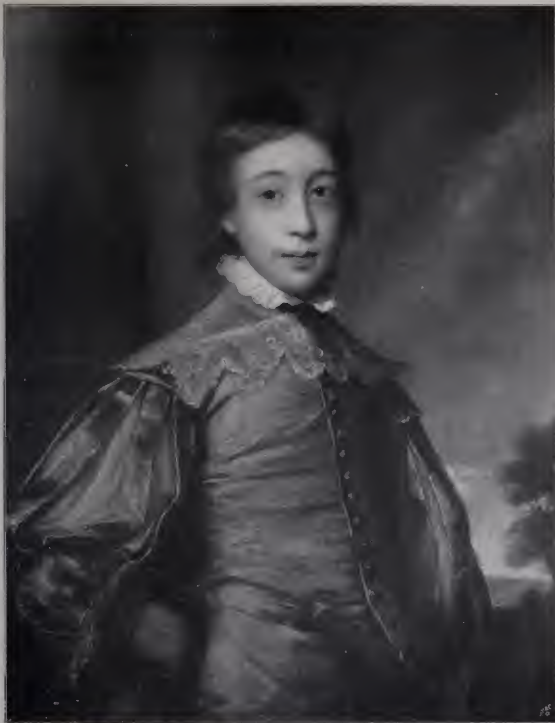
Abb. 11. William, Duke of Devonshire. 1767. Carl Speneer. (Zu Seite 116.)

Hauses, in dem der Briten sein Glück sieht, nun sie dreht sich die Hälfte des öffentlichen und privaten Lebens. Sie fehlen auch niemals auf den Bildern der führenden Meister. Sie haben im neunzehnten Jahrhundert auf den Genrebildern von David Wilkie und seinen Nachfolgern ihre Herrschaft sogar in solchem Umfange etabliert, daß es schließlich unerträglich ward; sie haben den unzähligen Süßlichkeiten der akademischen Ausstellung nur zu oft dazu gedient, das Publikum über malerische Unfähigkeit hinwegzutäuschen. Aber sie haben auch die größten Meister des Volkes lebhaft beschäftigt, und mit Reynolds