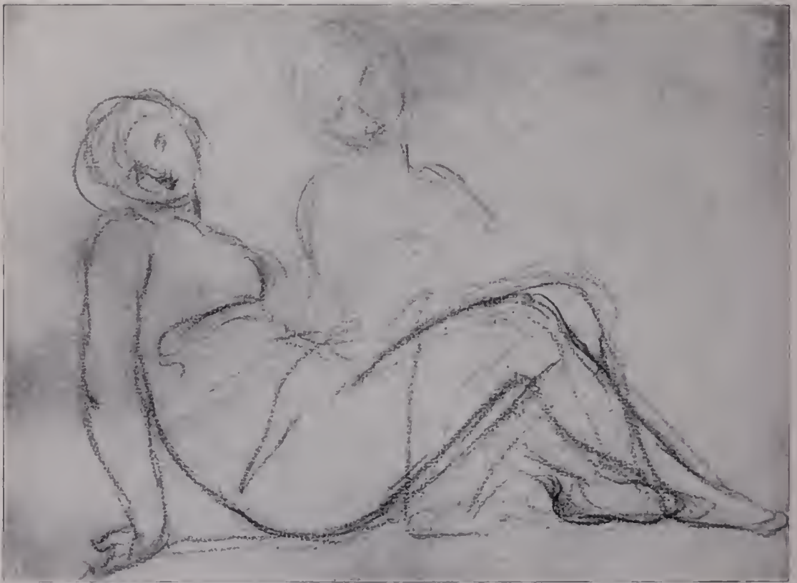
Abb. 102. Skizze in Ädel. Zum Gemälde „Nympe und störender Knabe“ Abb. 91 British Museum. (Zu Seite 123; vgl. Abb. 91.)

Am besten gelang ihm die Verschmelzung der Porträtendenz mit seinen akademischen Absichten in dem wundervollen großen Bilde der drei Ladies Montgomery, das in der National Gallery unter dem Titel hängt: „Die drei Grazien, eine Herme des Hymen bekränzend“ (Abb. 86). Es waren die drei schönen Töchter des Sir William Montgomery auf Stanhope, die er zu malen hatte (im Jahre 1773). Alle drei sollten im nächsten Monat von einem Gatten heimgeführt werden, und so ergab sich von selbst der Gedanke, sie als Priesterinnen des Hymen zu charakterisieren. Überdies hatte der Bräutigam der Ältesten, Mr. Gardiner, ausdrücklich den Wunsch kundgegeben, seine künftige Gattin und ihre Schwestern mit einer symbolischen oder historischen Dekoration zu umgeben. So