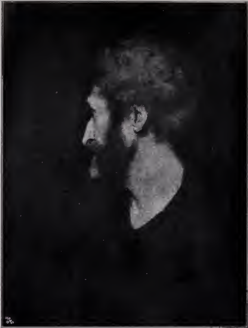
Abb. 21. Mannertopf im Profil. Studie. Um 1772. London, Nationalgalerie.

Zu Seite 116.