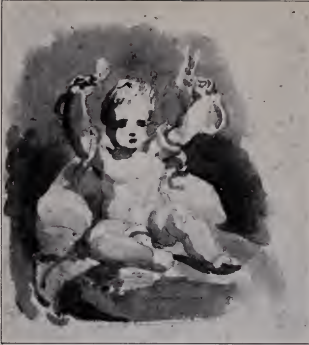
Abb. 106. Skizze zum jungen Herkules mit den Schlangen. Bleistift und Tusche. British Museum. (Zu Seite 95, 122 u. 124.)

denken, die ihr Baby auf dem Schoße tanzen läßt (Abb. 70), um zu erkennen, wie bedeutend seine Kunst bei solcher Begrenzung der Aufgabe wächst. Die Lebhaftigkeit und Natürlichkeit der Bewegung: wie die schöne junge Frau den vollen Arm leicht in die Höhe hebt und das Kleine mit den beiden dicken Strampelhändchen als gelehrige Schülerin die Mutter nachahmt, ist wundervoll zum Bildzweck verwertet. Das leuchtet und strahlt in goldig gedämpfter Helligkeit aus den weich vertriebenen Farben des dunkeln Hintergrundes.