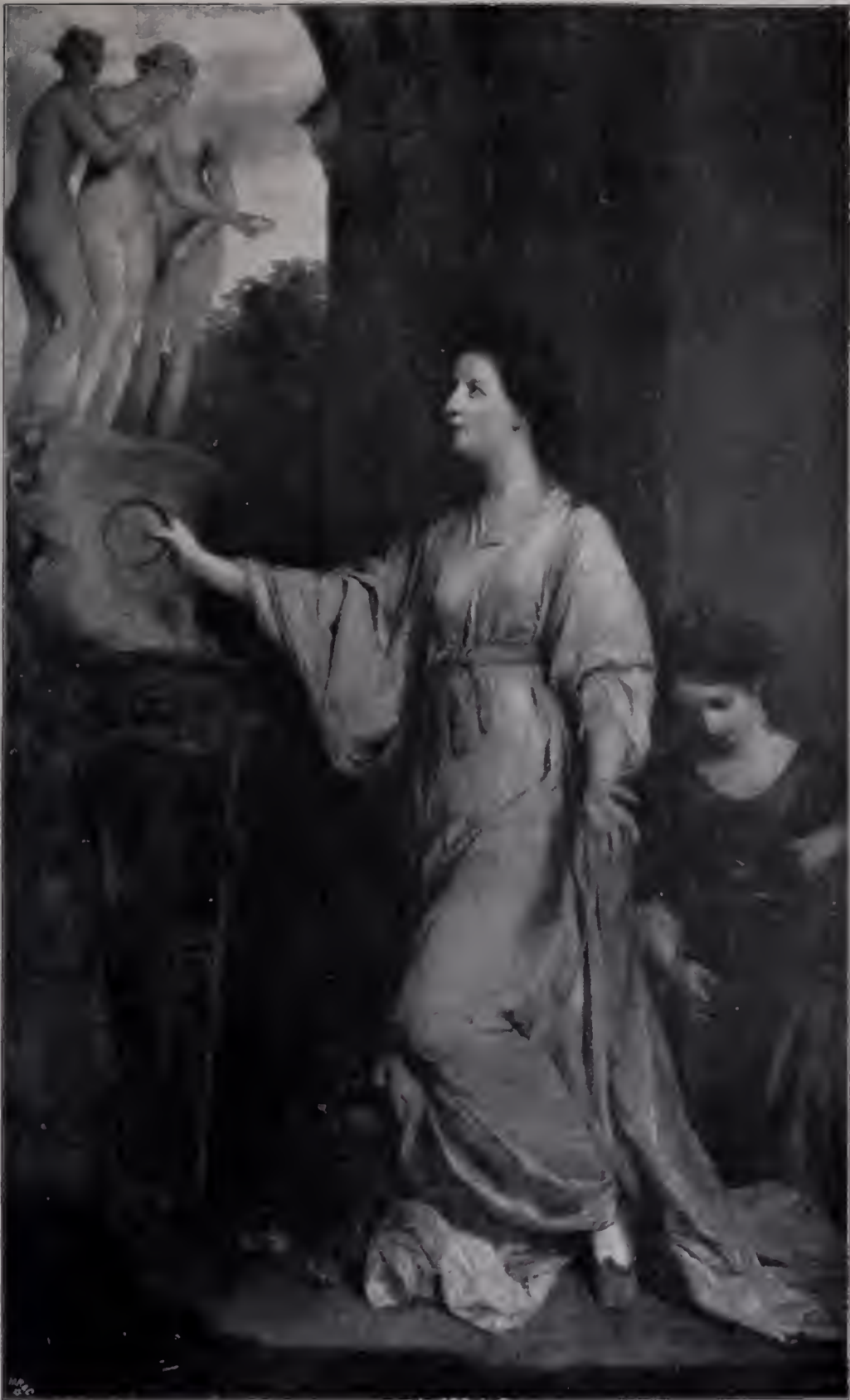
Abb. 85. Lady Sarah Bunbury, den Grazien opfernd. 1765. Sir Henry Bunbury. (Zu Seite 110.)