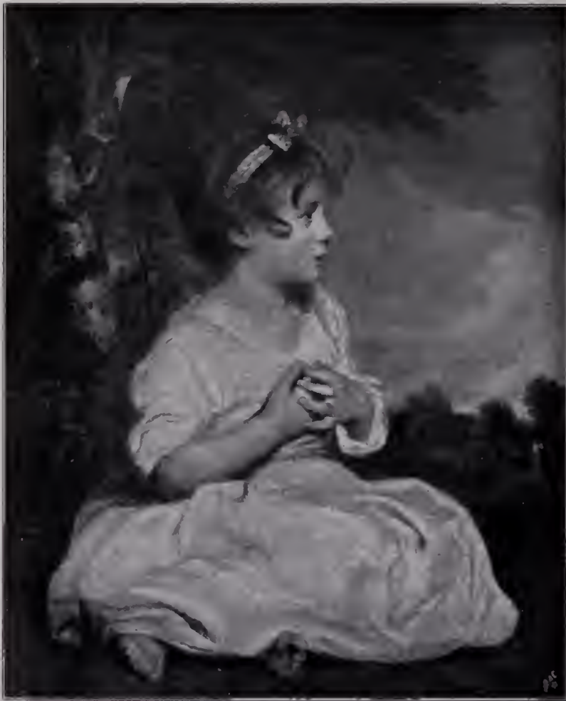
Abb. 79. Das Alter der Unschuld. London, Nationalgalerie. (Zu Seite 109, 120)