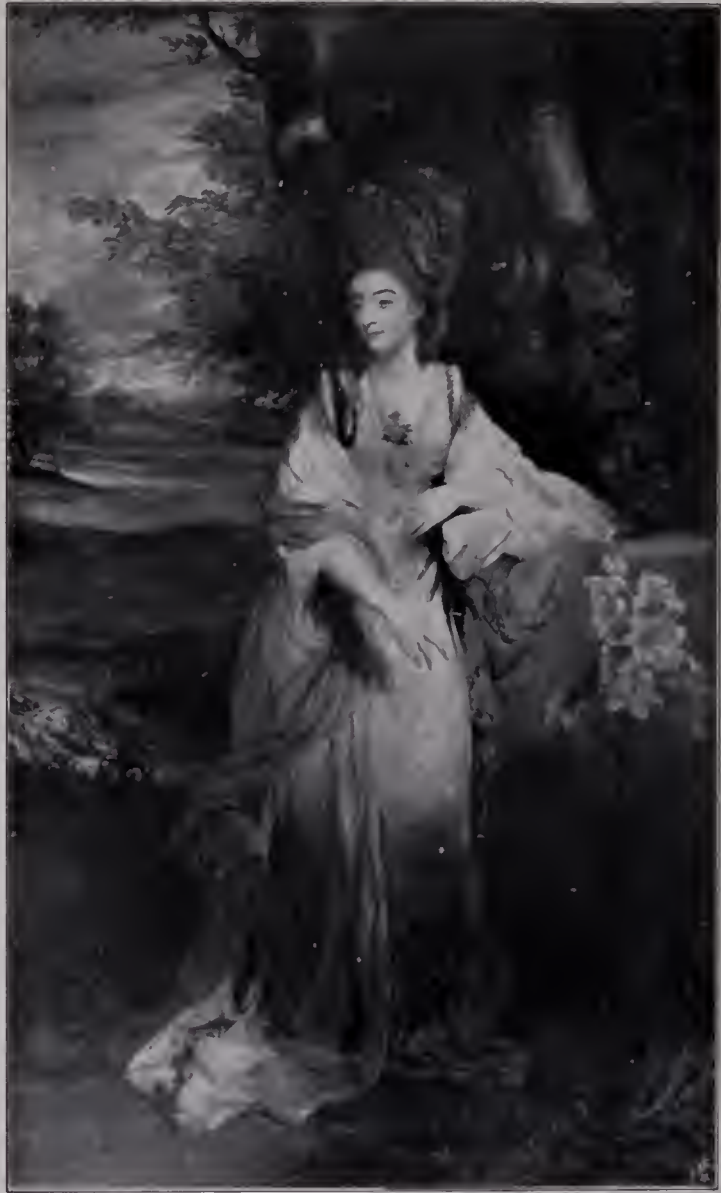
Abb. 61. Lady Campbell. 1777. Baron Alfred von Rothschild. (Zu Seite 116, 117 u. 119.)

jedes Lächeln über diesen Stolz auf Eigenart und Leistungen verschwindet und sich in eitel Bewunderung auflöst. Nicht minder großartig erscheint er in den andern Selbstporträts, da er angetan mit der roten Robe eines Doktors des römischen Rechts — Doctor of Civil Law — auftritt (Abb. 4/5). Im Jahre der Ernennung zu diesem akademischen Grade, 1773, hat er sich gleich dreimal (bei Lord Leonfield, bei Carl Spencer und