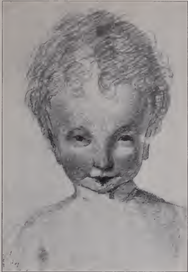
Abb. 98. Studie zum Bue. Zeichnung mit rötlichen Pastellströhen. South Kensington-Museum. (Zu Seite 95 u. 124.)