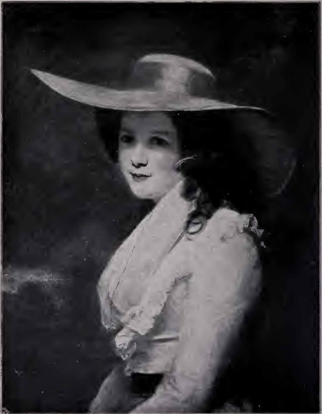
Abb. 57. Lavinia Countess Spencer. 1782. Carl Spencer. Nach einer Originalphotographie von Franz Hanfstaengl in München. (Zu Seite 117 u. 118.)

eines praktischen Volkes. Dabei hat Reynolds ähnlich wie Rembrandt eine besondere Freude daran, den eigenen Kopf im Bilde festzuhalten; wir zählen dreißig Selbstbildnisse aus der Zeit von etwa 1746 bis 1789, so daß wir also auch hier authentisch