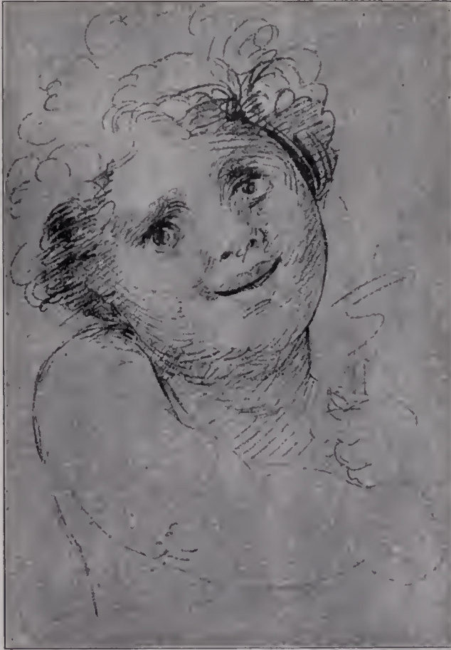
Abb. 99. Skizze zu einem Kopf des Heinen heiligen Johannes. South Kensington-Museum. (Zu Seite 124.)

Aber dem Manne, der alle große Kunst der Vergangenheit kannte und beherrschte, genügte das schlichte Handwerk des Porträtisten nicht. „Porträtmalerei,“ so schrieb er