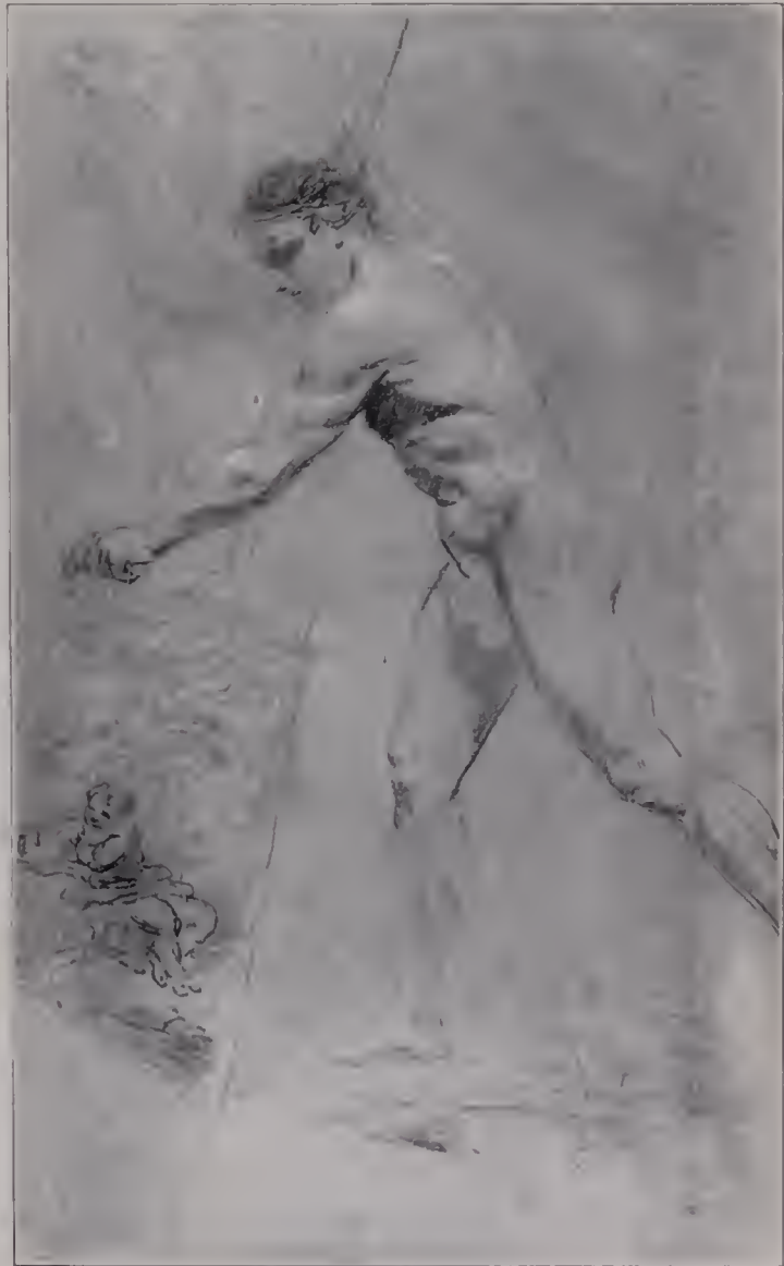
Abb. 105. Skizze. British Museum. (Zu Seite 124.)

Auch da versagt Reynolds oft im Entwurf der Komposition, wo er seine glücklichen Mütter darstellt, die von ihren Kindern umtollt, umsprungen, umklettert werden. Er ist hier oft zu Überschneidungen gelangt, die eine einheitliche Wirkung schlecht hin zerstören. Dazu hat er sich vielfach den Kontrast