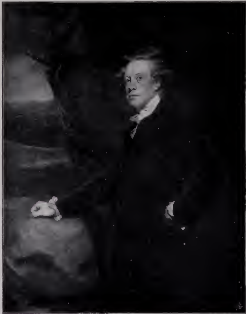
Abb. 23. Lord Richard Cavendish. 1780. Duke of Devonshire. (Zu Seite 116.)

Practice of Perspective“, der englischen Übersetzung von Jean Dubrenils französischem Buche aus dem siebzehnten Jahrhundert, die ihm ein Zufall in die Hände spielte, mit perspektivischen Studien. Er beginnt Holzschnitte und Kupferstiche aus der Bibliothek des Vaters zu kopieren und seine Freunde, seine Schwestern mit ungeübter Hand abzukopieren. Bald ist er dann mit Richardsons schon genannter „Theorie der Malerei“ bekannt geworden, deren Eindruck auf den Knaben ein gewaltiger, vielleicht ein entscheidender ward. Bis ans Ende seines Lebens hat Reynolds diesem Buche treue Liebe bewahrt; wir werden noch sehen, wie stark die enthusiastisch vorgetragenen Lehren und Theorien des älteren Künstlers in ihm nachgewirkt haben.