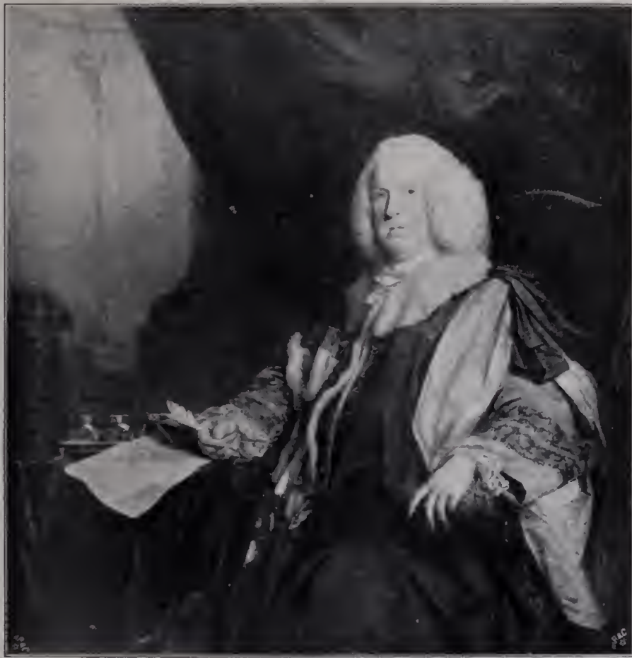
Abb. 34. William Pulteney Earl of Bath. 1761. National Portrait Gallery. (Zu Seite 109 u. 116.)

Dabei darf man nicht vergessen, daß ihm die Bewunderung für die Bolognesen frühzeitig eingeschärft worden war. Es war eins der Haupterziehungsmittel Hudsons,