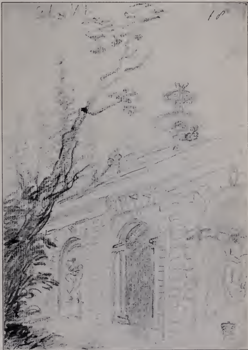
Abb. 112. Palazzo Pitti (Boboli-Garten). Aus einem italienischen Taschenbuch. British Museum 131, Nr. 10, S. 18. (Zu Seite 123.)

Wer die Handzeichnungen und Skizzen Reynolds' unbefangen überblickt, die in diesem Buche — zahlreicher wohl als in allen früheren Publikationen — nach Originalen im British Museum und im South Kensington-Museum erscheinen, wird dies Urteil mit einiger Verwunderung hören. Schon die flüchtigen Notizen der italienischen Taschenbücher (Abb. 109—114) lassen seine Gewandtheit im raschen Erfühlen von Eindrücken aus Kunst und Leben in hellem Licht erscheinen. Die blitzschnell hingeworfene Erinnerung an den Boboli-Garten zu Florenz, das famose Blättchen mit dem Zeichner bei der Arbeit und die anderen mit den pikanten italienischen Kokoschönen, die uns ein paar namenlose Gestalten aus dem lustigen Lebenskreise des jungen Engländers vorstellen, stammen von einem Manne, der den Stift wohl zu handhaben verstand. Ich muß gestehen, daß