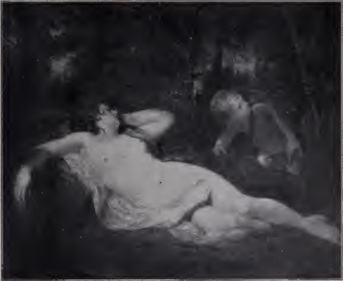
Abb. 90. Simon und Iphigenie. 1789. Buckingham Palace. (Zu Seite 95 u. 124.)

Weiter: „Wenn ein Mann wie Gainsborough ohne die Hilfe akademischen Studiums, ohne nach Italien zu reisen, ohne irgendwelche jener so oft empfohlenen vorbereitenden Studien zu großem Ruhm gelangt, dann wäre er ein Beispiel dafür, wie wenig notwendig solche Studien sind, da solche hohe Vorzüge ohne sie erworben werden können.“