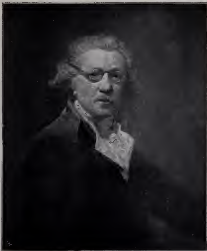
Abb. 7. Selbstporträt von 1789. Berlin, Kaiser Friedrich-Museum. (Zu Seite 62 u. 65.)

Freilich, es ist noch ein anderes Element, das Reynolds seine Herrschervolle zuweist. In älteren kunstgeschichtlichen Darstellungen findet man wiederholt den Hinweis, er sei der „Begründer der akademischen Geschichtsmalerei“ in England gewesen. Das ist insofern