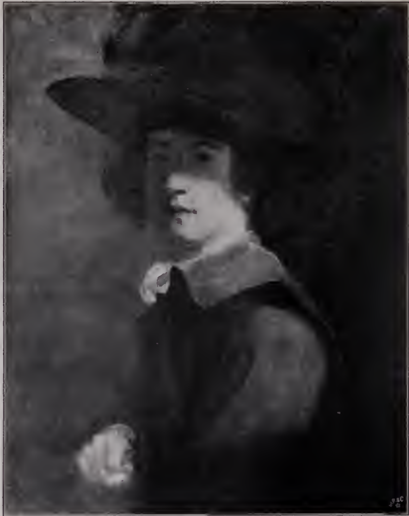
Abb. 2. Jungliches Selbstporträt. Carl of Crewe. (Su Seite 33, 62 u. 63.)

sorgloster Ungebundenheit und straffster Selbstzucht, kindlicher Freude an harmlos-englischen Scherzen und reifster Weltweisheit, freien Künstlerturns und repräsentativer Hoheit, frisch quellender produktiver Arbeit und tief schürfenden Sinnens. Ein Mann, der sich mit unerhörter Kraft und Energie sein eigenes Reich gegründet, und der doch mit beiden Füßen mitten im brausenden Getriebe der Hauptstadt steht. Ein Schaffender, dem jede Aufgabe einen Raub der Arbeit bedeutet, und ein Geschäftsmann zugleich, der trotz einem Großkaufmann zu disponieren und zu rechnen versteht. Aus einem Nichts formt er sich fast mühelos zwischen dem Gedränge der Konkurrenten eine gebietende Stellung.