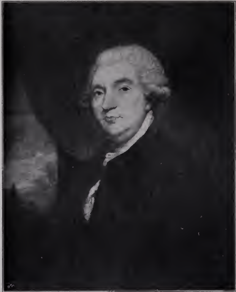
Abb. 17. James Boswell. London, Nationalgalerie.

Reynolds hat mit diesen Schöpfungen das englische Porträt aus der Konvention und der gefälligen Routine erlöst, in die es seit van Dyck versunken war. Das reichste