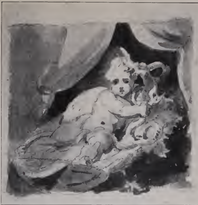
Abb. 107. Elizze zum jungen Herkules mit den Schlangen. Bleistift und Tusche. British Museum. (Zu Seite 95 u. 122.)