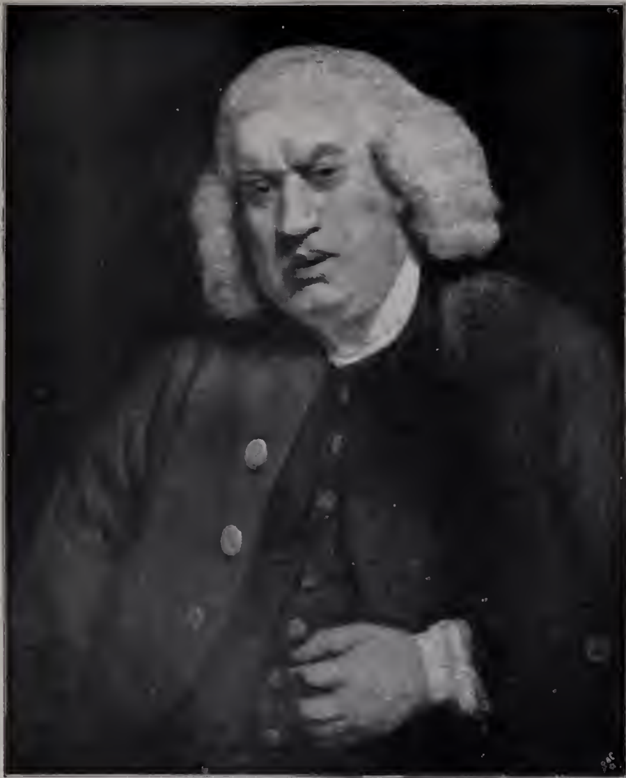
Abb. 11. Dr. Samuel Johnson. 1772. London, Nationalgalerie. (Zu Seite 16, 60 u. 68.)

Die alten Meister — ihnen hat sich Sir Joshua mit seinem Herzblut verschrieben, überzeugt, daß es ein heiliges und notwendiges Opfer sei, was er also verrichte. Auf dem Selbstbildnis der Royal Academy, in dem er sich im roten Talar, mit dem Barett auf dem Kopf, dargestellt hat (Abb. 1), steht auf dem Tisch zur Seite eine Büste Michelangelos. Und Michelangelo war der Name, ja das Wort, mit dem er symbolisch den letzten seiner berühmten Diskurse schloß, mit dem er Abschied nahm vom Leben und von der Kunst.