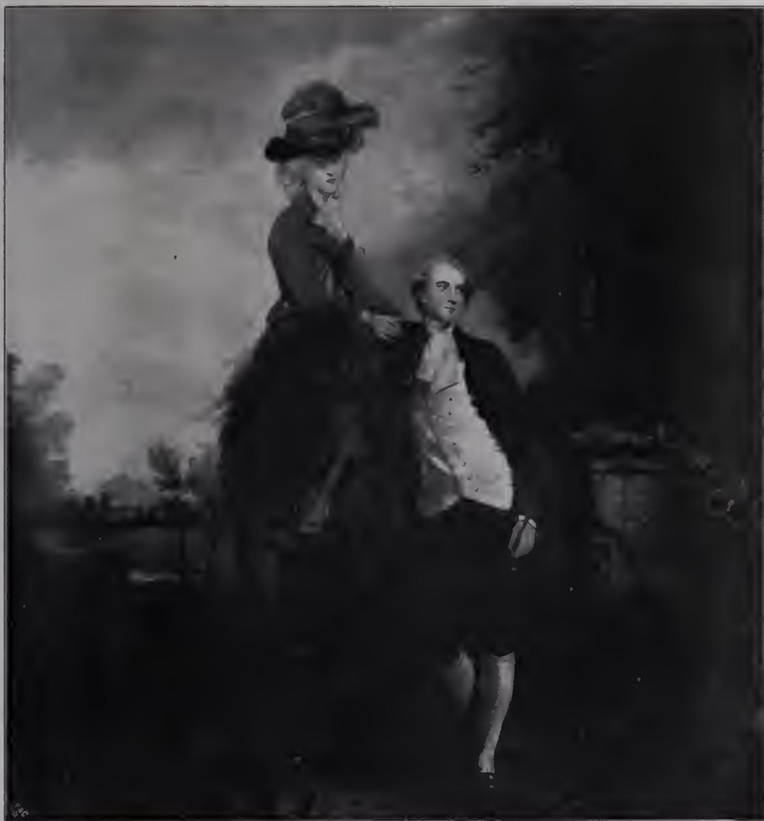
Abb. 66. Herzog und Herzogin von Hamilton. 1779. Lord Boscawen. (Zu Seite 115 u. 119.)

auf ihren Höhepunkt. Die Porträtistentätigkeit wird ein wenig eingeschränkt. Für das Jahr 1769 notiert das Tagebuch „nur“ 77 Personen, für 1770: 44, für 1771: 67. Das ist immer noch Arbeit genug, wenn man einen normalen Maßstab anlegt. Bei Reynolds' unglaublicher Produktivität jedoch bedeuten diese Zahlen eine beträchtliche Ausdehnung der freien Zeit, für die er als eifriger Wirt, Gast, Klubmann und Theaterbesucher die beste Verwendung hat. Namentlich dem Theater widmet er sich jetzt mit