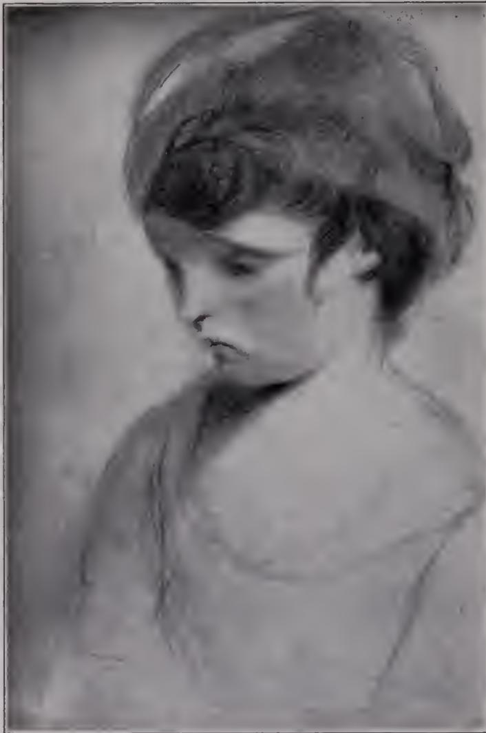
Abb. 97. Mädchenkopf. Skizze in Bleistift und Pastell. British Museum. (Zu Seite 123.)

Nie hat ein Künstler das Prinzip des Eklektizismus so naiv aufgestellt wie Reynolds. Wie er es unternahm, sich seine technischen Geheimnisse aus allen Ecken und Winkeln der Vergangenheit zusammenzusuchen, so machte er in Auffassung, Komposition, Farbenverteilung unaufhörlich Anleihen, ein „großer Nehmer“, wie Herder von Goethe sagte. Freilich, es ist fast niemals von einer unmittelbaren Entlehnung einzelner Züge die Rede. Selbst bei dem Bilde der Siddons ist die oben erwähnte Benutzung von Erinnerungen an die Sixtina keine direkte Übernahme eines bestimmten Motivs, sondern