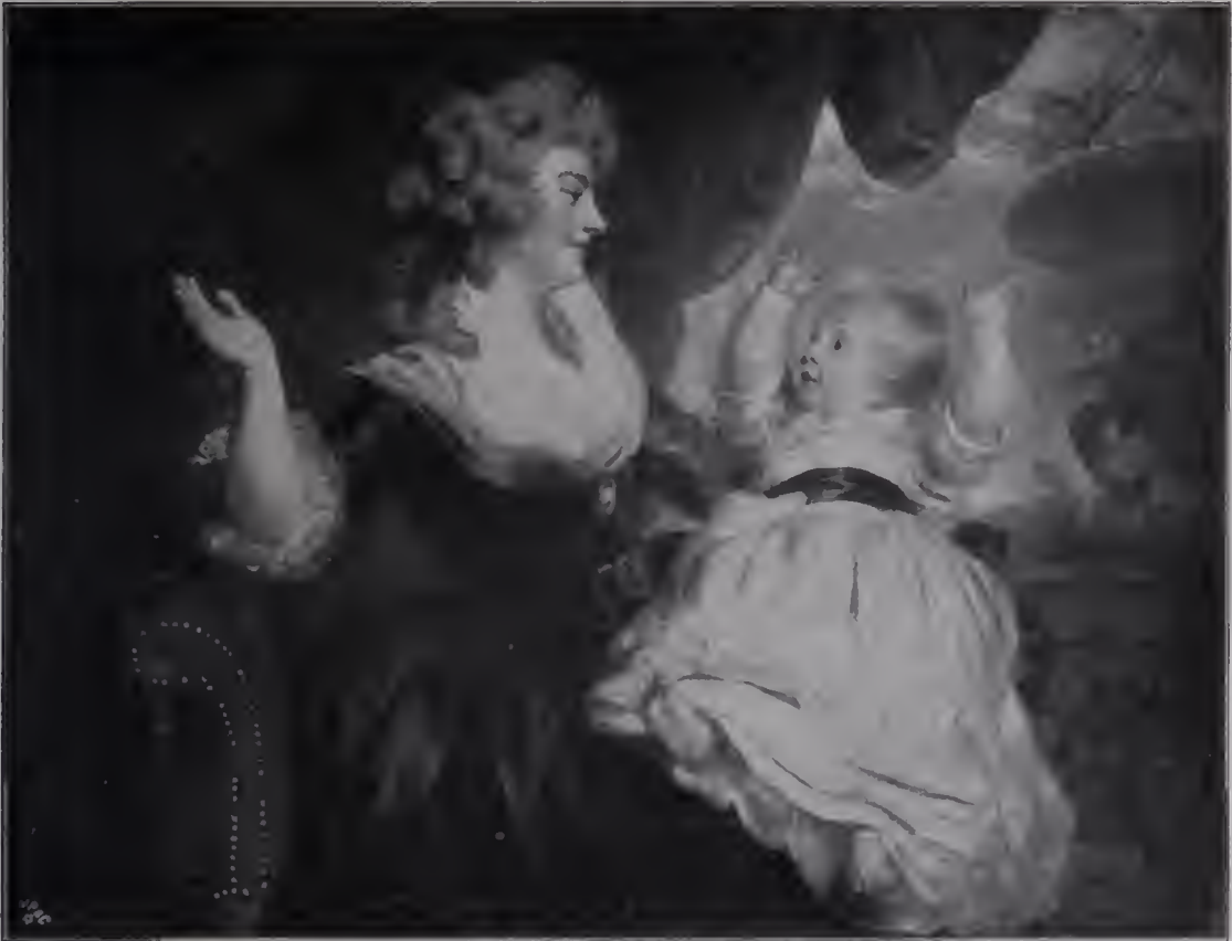
Abb. 70. Herzogin von Devonshire und ihr Töchterchen. 1786. Herzog von Devonshire. (Zu Seite 116.)

Nach als Lehrer hat Sir Joshua diese Art nicht aufgegeben. Wohl hat er zahlreiche Schüler in seinem Hause aufgenommen. Sie wohnten bei ihm. Sie arbeiteten unter seinem Dache. Sie durften ihn auch gelegentlich bei einer Gewandung, einem