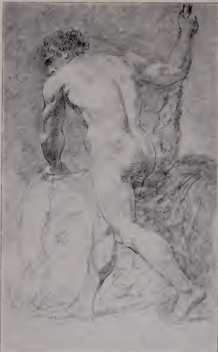
Abb. 104. Herkules. Altzeichnung. Mit aufgelegten weißen Lichtern. British Museum. (Zu Seite 124.)

für die große Komposition, nach der er sich so heiß sehnte, selbst in dieser Nachbarschaft seines Spezialgebietes. Immerhin hat er sich bei den Dilettanti mit Anstand aus der Affäre gezogen, und der Erfolg wäre noch größer gewesen, hätte er sich bei dieser Anzahl (zweimal je sieben Personen) nicht auf ein so kleines Format beschränkt, das ihm die Bewegungsfreiheit hemmte. Übertroffen aber werden die Bilder der Sozietät durch die Familiengruppe der Marlboroughs von 1777 (beim Herzog von Marlborough), die zwar auch in der pyramidalen Anordnung etwas Schematisches gewonnen hat, doch das Konventionelle dieser altehrwürdigen Schablone durch die Lebendigkeit der einzelnen Gestalten vergessen läßt. Den Vordergrund füllen zwei jüngere Kinder aus, die sehr natürlich wirken. Dahinter links die beiden älteren Töchter; rechts, sitzend, der Herzog mit seinem Sohne. Das Ganze krönt schließlich die Herzogin, die in der Mitte aufrecht steht.