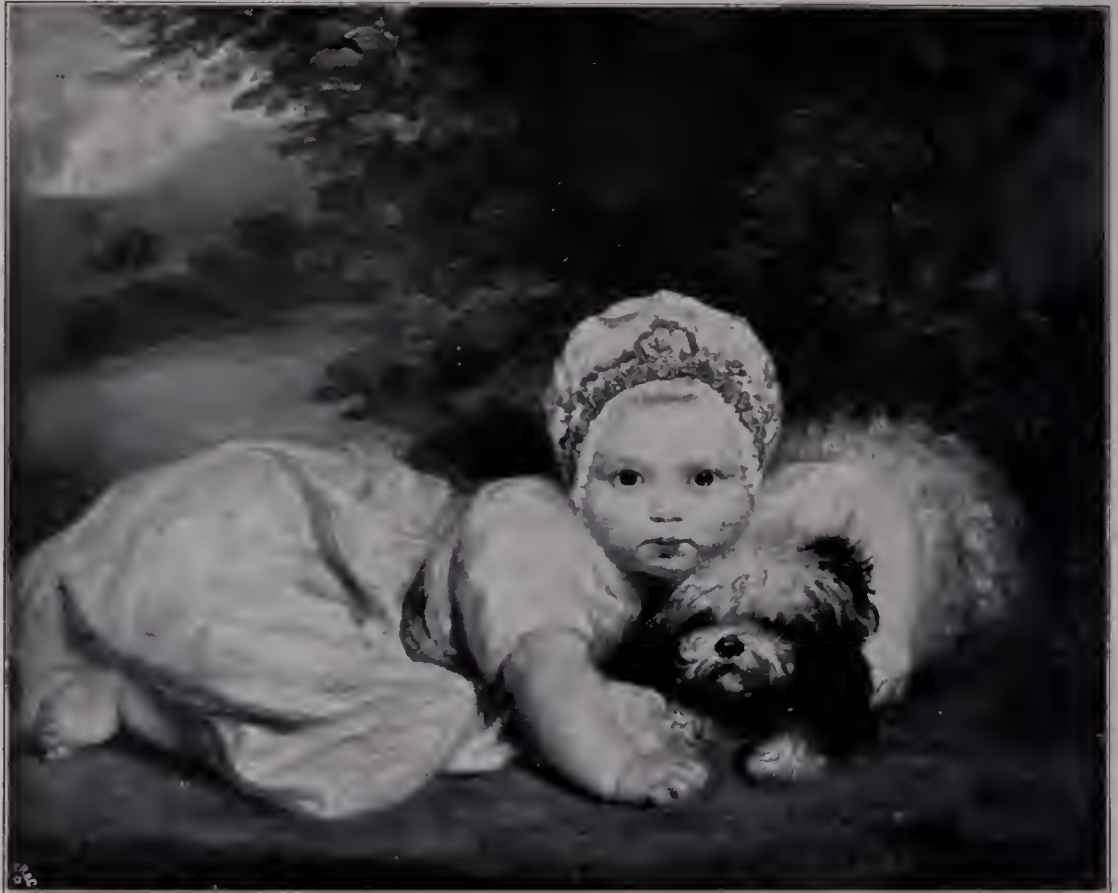
Abb. 81. Prinzessin Sophie Mathilde von Gloucester. 1774. Windsor. (Zu Seite 119.)

Das Jahr 1773, da der Fünfundzwanzigjährige sich also geehrt sieht, ist auch sonst für ihn ein Jahr von Bedeutung. Eine ganze Schar hervorragender Werke entsteht in seinem Verlauf und wandert auf die Ausstellung. Reynolds' größtes und — mißlungenes „Historienbild“, die Gruppe Ugolini's und seiner Söhne im Hungerturm zu Pisa, wird