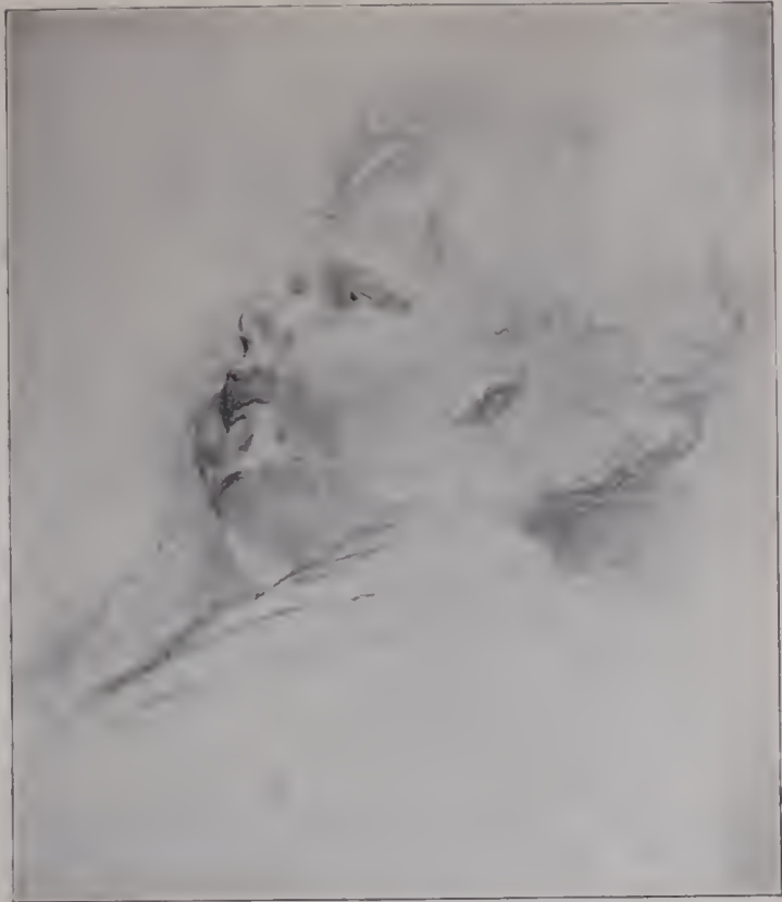
Abb. 100. Kinderkopffizze. Bleistift mit wenigen roten Pastellstrichen. British Museum. (Zu Seite 123.)

Freilich, sieht man genauer hin, so sind doch auch diese allegorisch-symbolisch-histo-