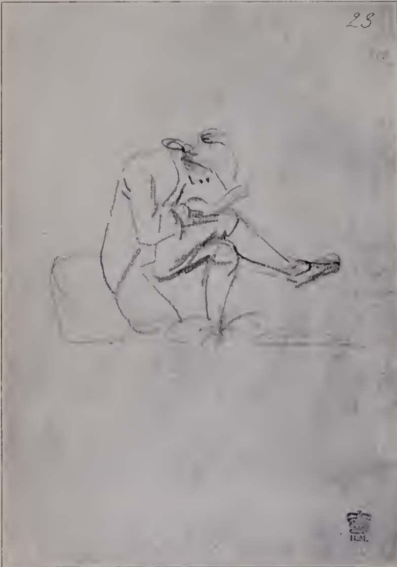
Abb. 109. Skizzenblatt aus einem italienischen Taschenbuch. British Museum 130, Nr. 10, S. 23. (Zu Seite 123.)

Aber das sind immerhin Ausnahmen. Das Positive überwiegt auch hier. Mit Entzücken sehen wir das reizende kleine Mädchen in der National Gallery, dem der Künstler den Namen „Das Alter der Unschuld“ gegeben hat (Abb. 79), und das im weißen Kleidchen, mit bloßen Füßchen vor einer Baumgruppe kniet, den Kopf mit dem Stumpfnäschen im Profil nach rechts gewandt, mit einem Blick, der wahrhaft süßeste Kinderunschuld verrät, und den noch die beiden zur Brust emporgehobenen Händchen bestätigen, die zu sagen scheinen: „Wie seltsam und merkwürdig ist diese große Welt, in die ich hineingesetzt bin.“ Kostlich daneben der kleine Master Hare (Abb. 75), der, noch im Babykleidchen und das Köpfchen noch von langen Locken umwallt, das rechte Händchen und den Zeigefinger ausstreckt, wie Kinder es zu tun pflegen, wenn sie etwas erblicken, das sie besonders überrascht. Der Master Bunburn, der so frisch und kühn und romantisch dreinblickt wie