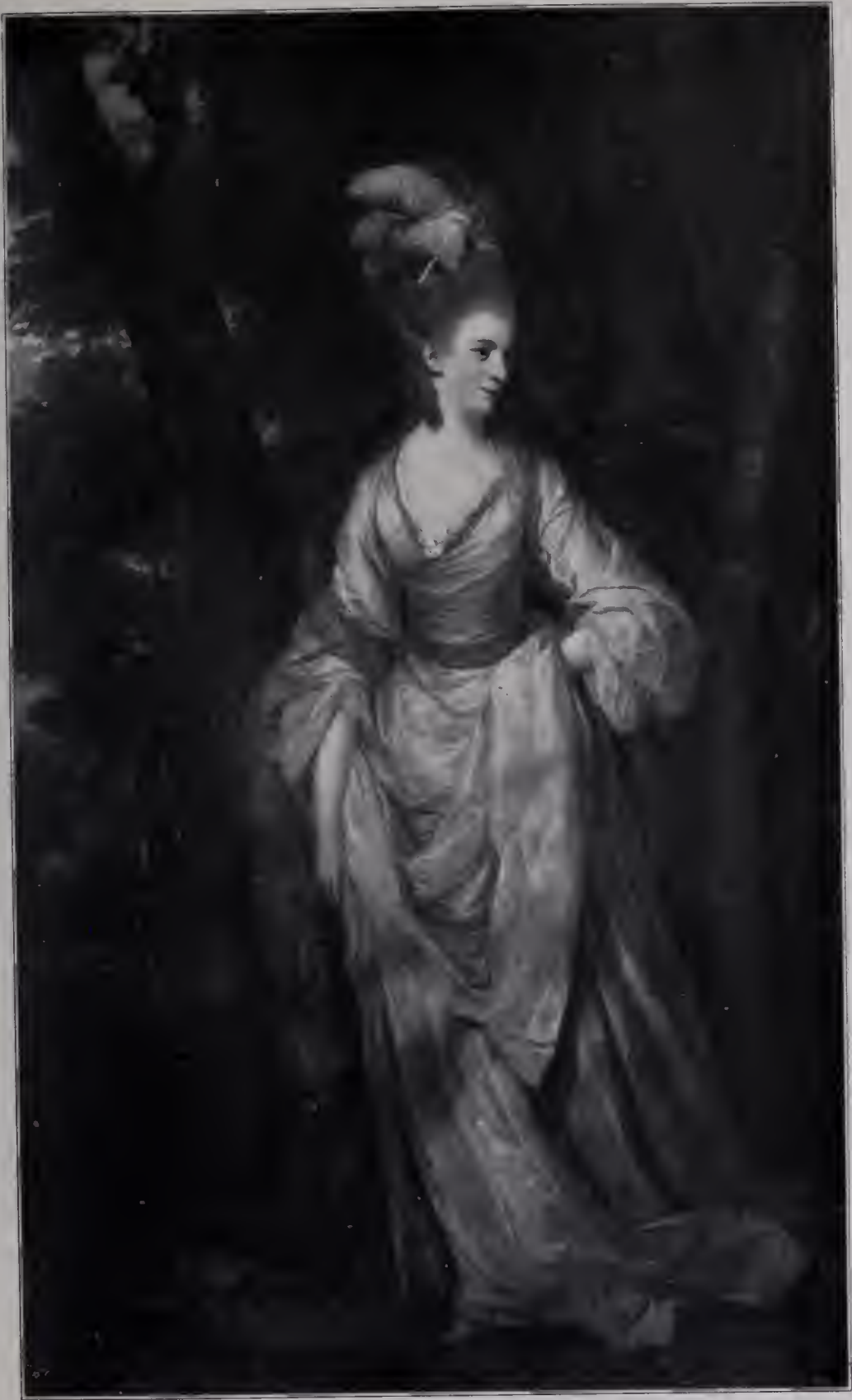
Abb. 64. Miß Cornwall. Wallace Collection. (Zu Seite 118 u. 119.)