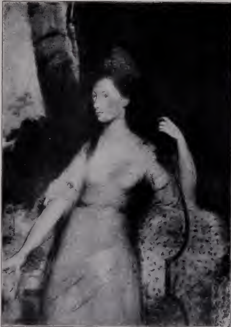
Abb. 93. Skizze zum Porträt der Lady Holding. Pastell und Aquarell. South Kensington-Museum. (Zu Seite 124.)

so hervorragende Schönheit seiner Bilder ist, während viel Glätte und Vermalung der Farben dazu angetan ist, Schwere hervorzu bringen. Jeder Künstler muß bemerkt haben, wie oft jene Leichtigkeit der Hand, die in seiner Untermalung oder ersten Anlage zu sehen war, beim Ausführen verschwand, wenn er die Teile mit größerer Genauigkeit ausfertigte; und noch einen anderen Verlust, der von mehr Bedeutung ist, erfährt er oft: während er sich mit den Einzelheiten beschäftigt, wird die Wirkung des Ganzen entweder vergessen oder vernachlässigt. . . Gainsboroughs Porträts waren in bezug auf Ausfertigung oft nicht viel mehr als was gewöhnlich zur Untermalung gehört; aber da er immer den allgemeinen Eindruck oder das Ganze zusammen beachtete, habe ich mir oft vorgestellt, daß diese Unfertigkeit sogar zu der überraschenden Ähnlichkeit beitrüge, welche seine Porträts so bemerkenswert macht. Obwohl diese Ansicht phantastisch erscheinen mag, glaube ich doch einen wahrscheinlichen Grund dafür angeben zu können, warum diese Malweise eine solche Wirkung haben könnte. Es wird vorausgesetzt, daß der allgemeine Eindruck, der in dieser unbestimmten Behandlungsweise liegt, genügt, um den Beschauer an das Original zu erinnern; die Einbildungskraft ergänzt das übrige und für sich vielleicht befriedigender, wenn nicht gar genauer, als der Künstler es mit aller Sorgfalt nach Möglichkeit hätte tun können.“