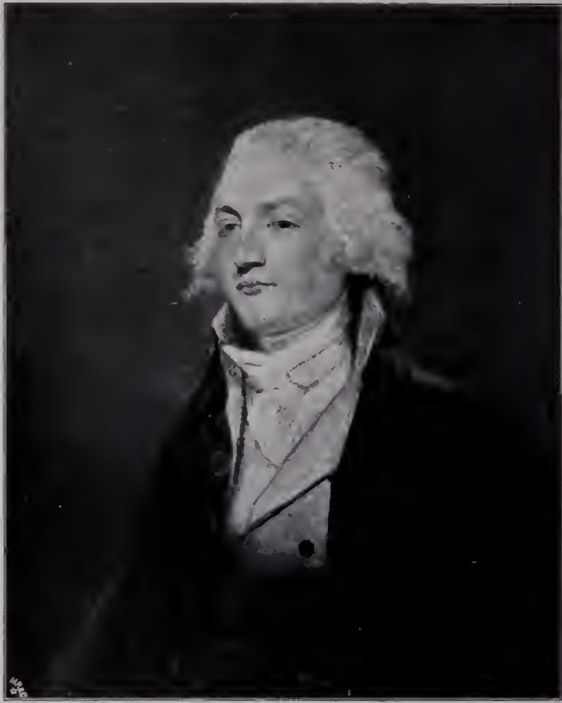
Abb. 27. Richard Earl of Lucan. 1786. Carl Spencer. (Zu Seite 116.)

Was Hudson seinem Lehrling aus Plympton gab, war genug, um diesem die handwerkliche Grundlage seines Berufes zu vermitteln. Mehr konnte ihm der Londoner Mode-