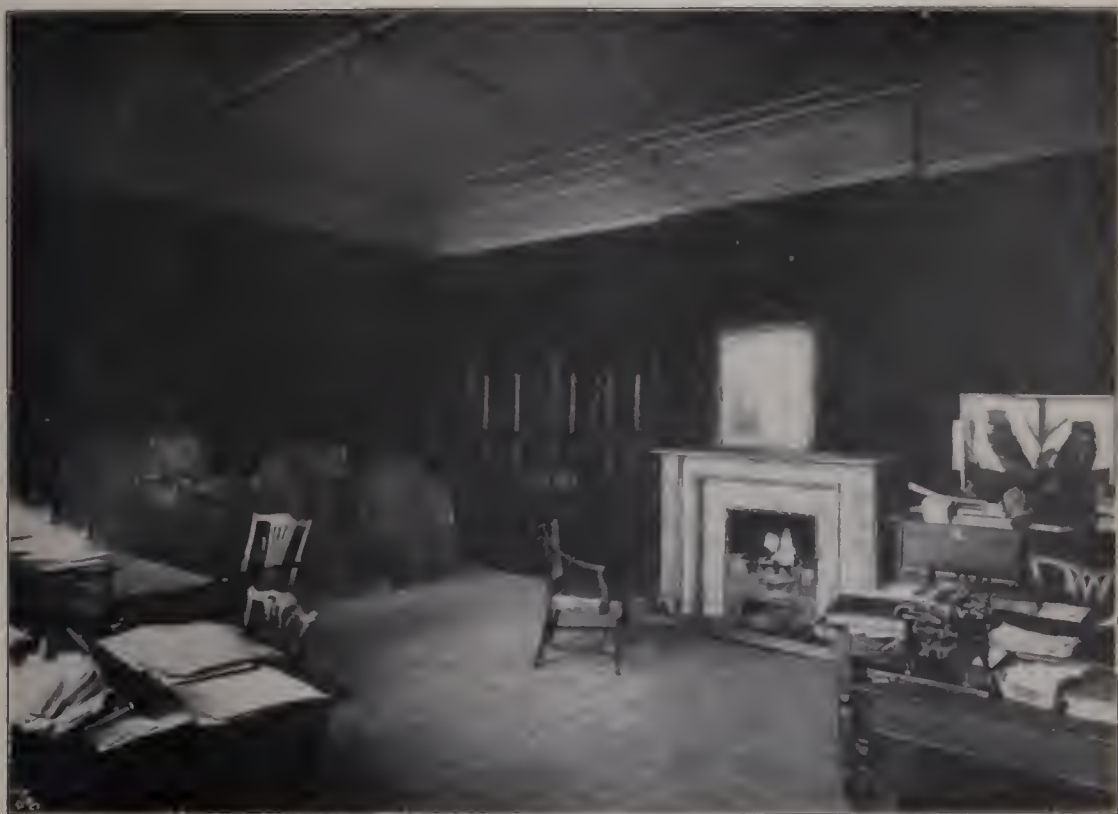
Abb. 115. Raum im Hause Leicester Square Nr. 47, ehemals Reynolds' Atelier. (Zu Seite 51.)

Alles muß von der Naturbeobachtung und Wirklichkeit fortführen. Das geht bis zu der Frage der Gewandung. Reynolds zweifelt nicht, „daß, wer dem Künstler nicht