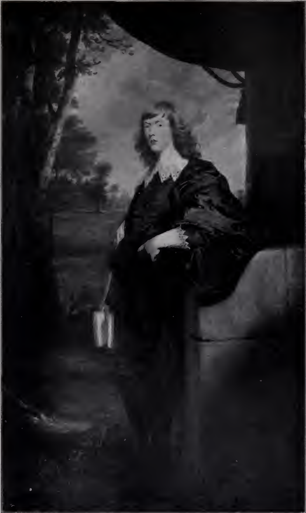
Abb. 28. George John Viscount Althorp. 1786. Carl Spencer. (Zu Seite 116.)