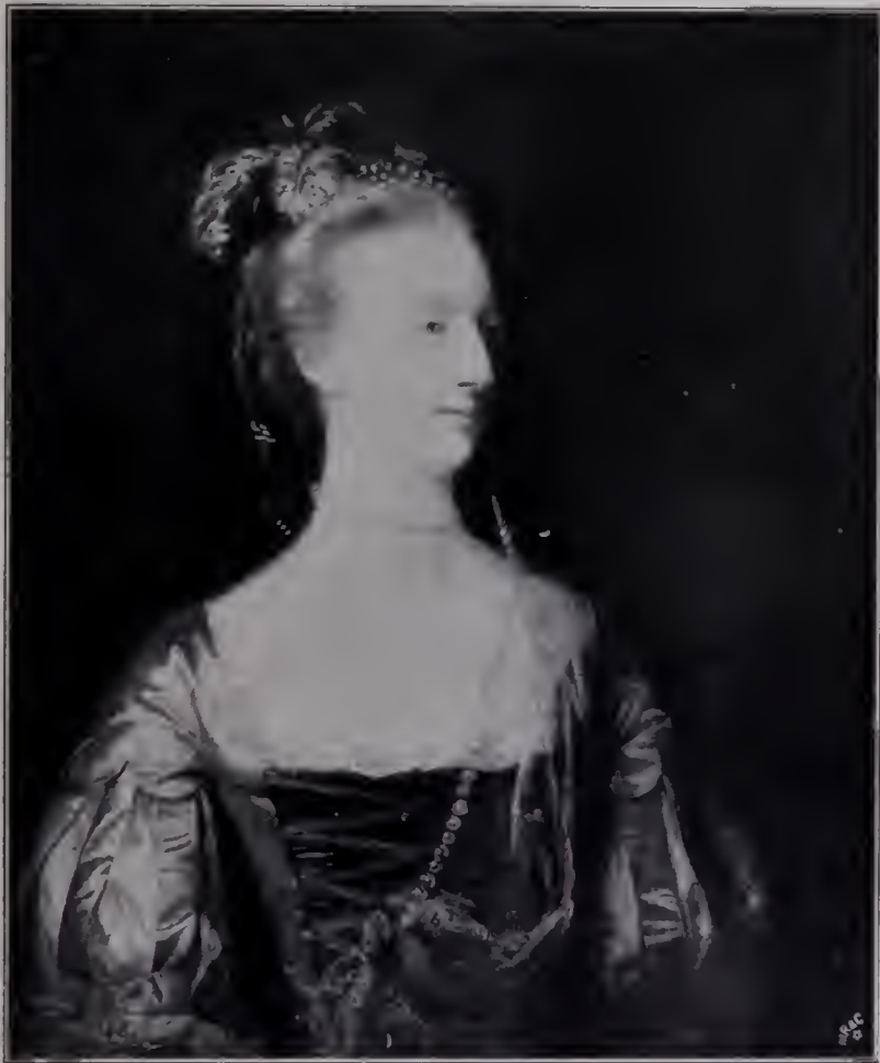
Abb. 42. Bildnis einer Dame. Berlin, Kaiser Friedrich-Museum; Sammlung Wesendonck. (Zu Seite 117.)

Dann aber meldet sich bereits in Italien die eigentümliche Mischung beider Elemente, die nun Reynolds' ganzem Lebenswerk in der Folgezeit ihren Stempel ausdrücken sollte: die Vereinigung holländischer, Rembrandtscher Lichtwirkungen und südlicher Farbengebung; tief schürfender, aus einem geistigen Anschauen erwachsender Charakteristik und sinnlich weltfroher Farbenkunst. Das ist es, was Reynolds als etwas Neues in die europäische Bildnismalerei hineinbringt, wodurch seine und seiner Nachfolger Porträts uns heute nach über hundert Jahren noch schlechtthin als die Ideale künstlerischer Menschendarstellung