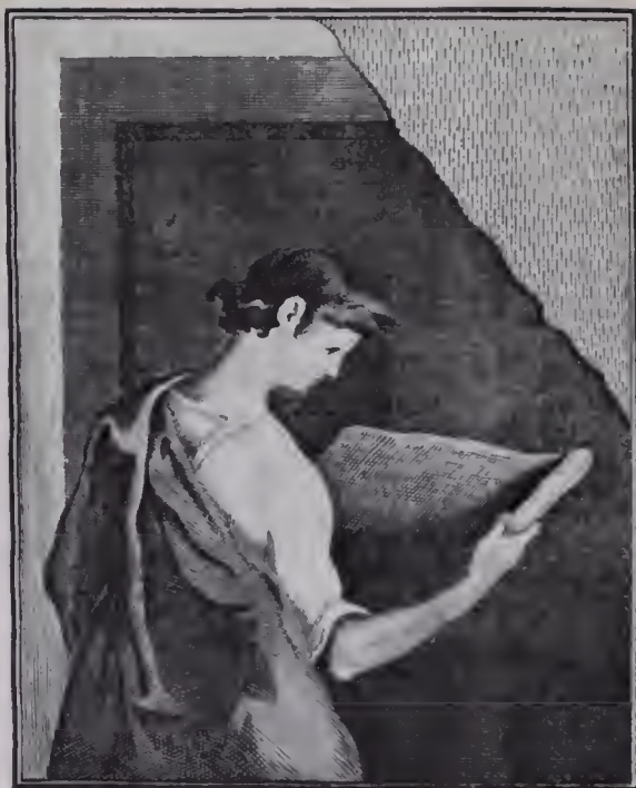
THE J. PAUL GETTY MUSEUM LIBRARY