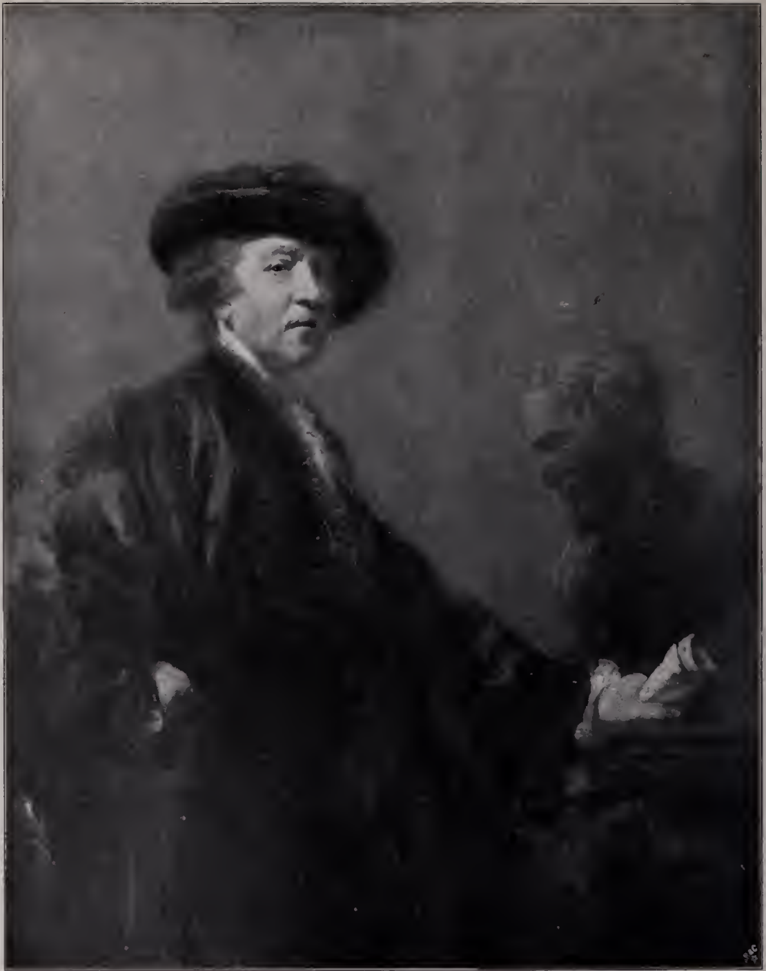
Abb. 1. Selbstbildnis Reynolds' als Präsident der Akademie. 1780. London, Royal Academy. (Zu Seite 13, 62 u. 65.)