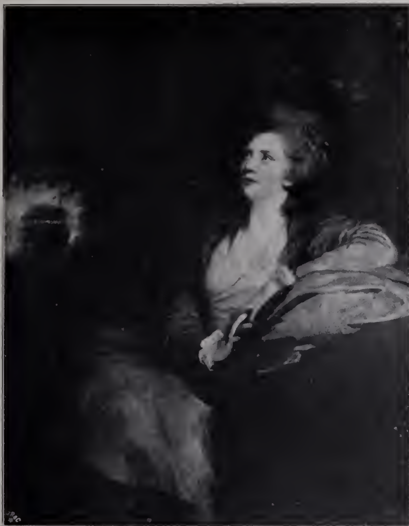
Abb. 47. Countess of Harcourt. Arthur Sanderson. (Zu Seite 117.)

Als dieser Umzug vonstatten geht, ist Reynolds bereits ein großer Herr. Auf die Einrichtung des neuen Heims werden kolossale Summen verschwendet. Für den Besitzer wird eine Antike gebaut, deren Gefäße der Maler Catton mit Allegorien der Jahreszeiten bedeckt. Eine Dienerschaft, gekleidet in goldstrotzende Livreen mit silbernen Treppen, wird eingestellt. Ein luxuriöses Ballfest beruft zur Einweihungsfeier den schon mächtig angeschwollenen Heerbann der Freunde zusammen.