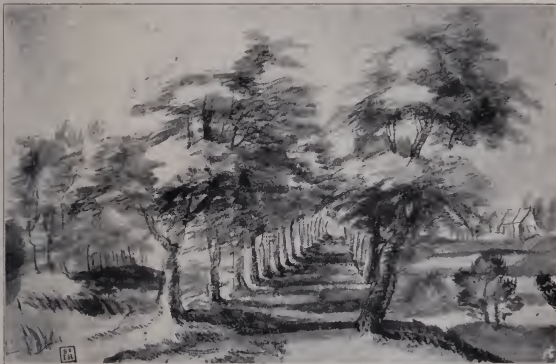
Abb. 108. Landschaft. Tuschezeichnung. British Museum. (Zu Seite 125.)

lebendigen Brüdern, die unsere Sprache nicht sprechen können, aber verstehen. Die kleineren und größeren Hunde, die an Sir Joshuas Frauen empor springen, ihre Herrin erwartungsvoll ansehen, als wenn sie einen Befehl oder ein Kosewort erhofften, sich an sie anschmiegend oder ihnen auf den Schoß hüpfend (Abb. 62), haben nicht die unmittelbare Natürlichkeit, die Gainsborough auch diesen Tieren zu geben wußte. Sie sind mehr bewußt als Farneflecke oder auch als Kompositionsteile verwendet, etwa um die Basis des pyramidalen Zeichnungsaufbaues zu komplettieren, oder um eine Linie zu durchbrechen, eine Gerade wellig aufzulösen. Und ähnlich wie mit diesen Hunden, mit den Tauben (Abb. 59—60) und dem andern Getier, das auf Reynolds' und Gainsboroughs Bildern auftritt, steht es schließlich mit den Kindern (Abb. 81—83). Auch hier ist Gainsborough, selbst ein Naturkind, von vornherein dem großen Konkurrenten ein bedeutendes Stück voraus. Bei ihm sind die Kleinen lebendige Blumen, süße Elfen, frohe Naturgeisterchen, welche die Blüten des Gartens, die Bäume des Parks und die Hunde des Hauses als Geschwister ansprechen. Reynolds,