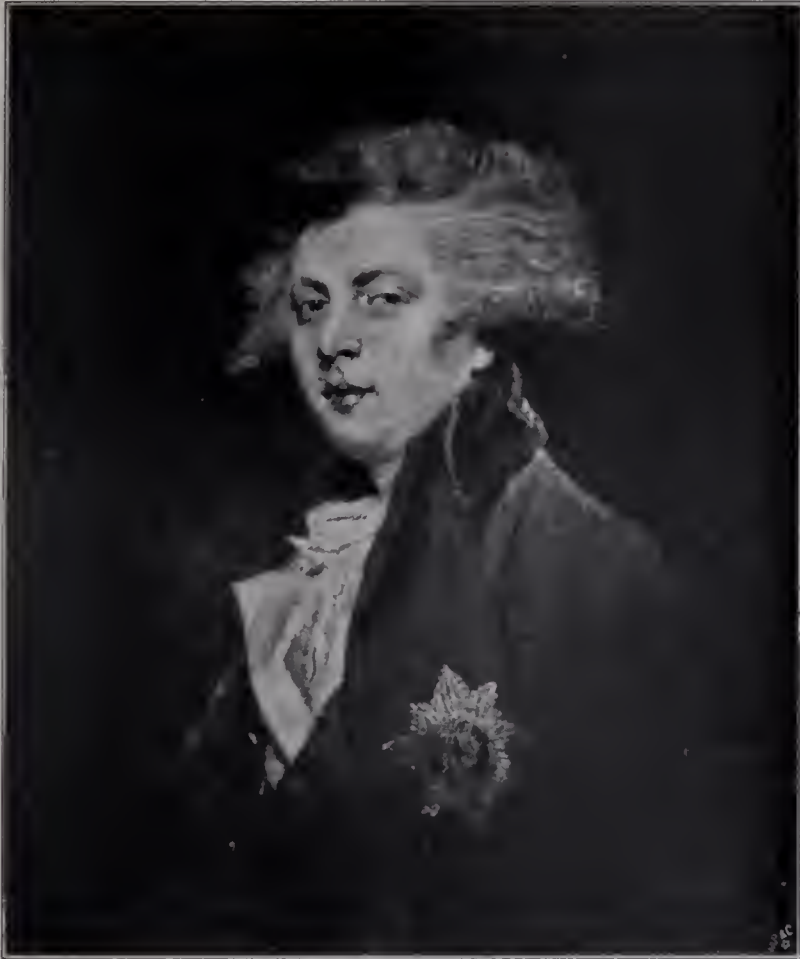
Abb. 18. George IV. als Prinz von Wales. London, Nationalgalerie. (Zu Seite 91 u. 116.)

Kond ab, der wesentlich mit zur malerischen Wirkung beiträgt, oft, wie bei Velazquez, von einer neutralen grauen Fläche, die lediglich als Farbenkontrast oder als Dominante in dem bestimmenden Akkord aufzufassen ist. Oder vom Himmel, der grau und bewölkt oder in zarter Bläue erscheint, klug abgestimmt, je nach den koloristischen Erfordernissen. Oder gelegentlich von dem raffiniert verwerteten Interieur eines Zimmers. Oder, weit öfter, in einem dekorativ behandelten Landschaftsanschnitt. In diesem landschaftlichen Beiwerk ist Reynolds allerdings nicht eigentlich ein Führer und Bahnbrecher gewesen; es hält sich meist im Landläufigen, und es ist auch in der Farbe fast immer herabgestimmt, um die ganze Aufmerksamkeit auf die dargestellte Persönlichkeit zu konzentrieren. Es ist ein