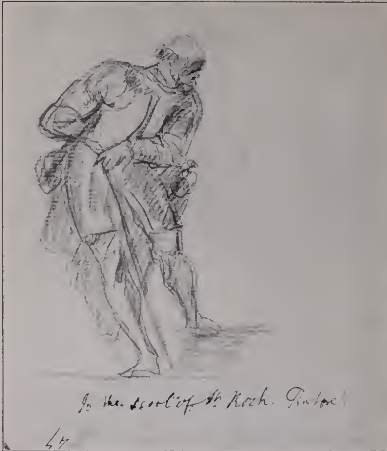
Abb. 113. Zeichnung nach Tintoretto. Aus einem italienischen Taschenbuche. Venedig, Simone di S. Marco. British Museum 131, Nr. 9, S. 47. (Zu Seite 123.)

es in diesen Säckelchen Partien gibt, die von fern an Menzels Jugendstudien zum Angler erinnern, und wenn man dazu die Kinderkopfskizze (Abb. 99) vergleicht, so scheint die Verwandtschaft noch näher zu sein: Daneben sind die Aktstudien (Abb. 104 u. 105) gewiß keine Beweise für die oft behauptete Unkenntnis des menschlichen Körperbaues — wenn auch die Skizze Abb. 101 nicht gerade ein Meisterstück ist. Die Studien zum Petersburger Herkules (Abb. 106 u. 107) zeigen, wie Sir Joshua mit den Schwarz-Weiß-Mitteln von Bleistift und Tusche Lichtwirkungen anzudeuten verstand. Das Köpfchen des Puck mit den weiß eingesetzten Röteltönen (Abb. 98) und die übrigen Farbenskizzen (Abb. 93), namentlich das flott charakterisierte kleine Bild Oliver Goldsmiths (Abb. 96),