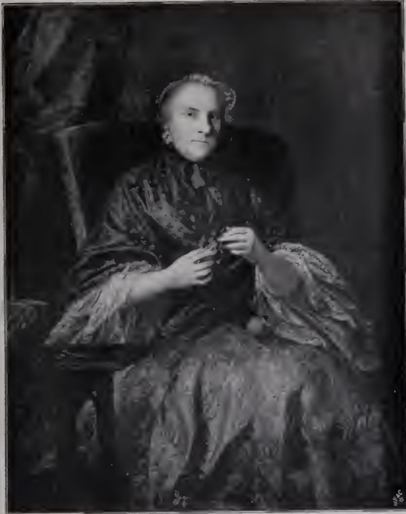
Abb. 15. Countess of Albemarle. London, Nationalgalerie. (In Seite 117.)

bis in die letzten Geheimnisse des Schaffens der alten Meister einzudringen, ist dem unverbesserlichen Akademiker freilich später bange geworden; wir werden sehen, wie er in seinen Diskursen gegen seine schrankenlose Bewunderung aus der Zeit des venezianischen Aufenthalts Vorbehalte macht und wieder den Rückweg aufzufinden sucht, der ihn von der voraussetzungslosen Ergründung des Malerischen in den gebenedeiten Bezirk des großen Stils führen könnte. Fürs erste aber bleibt der Eindruck der Venezianer ungeschmälert, und für alle Zukunft verdankt ihm Reynolds die wertvollste Befruchtung, die seinem Talent von außen her zuteil wurde.