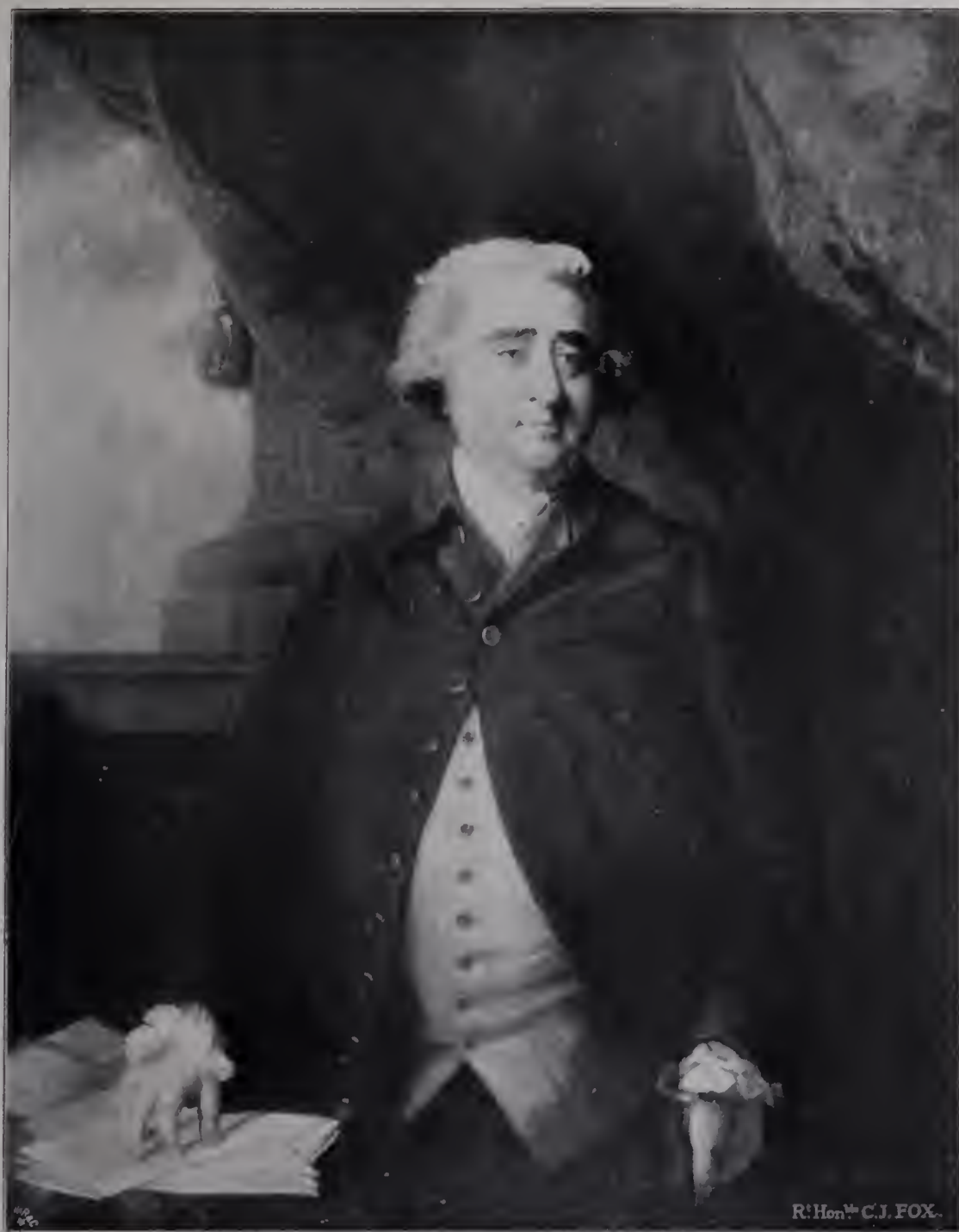
Abb. 26. Charles James Fox. 1781. Carl von Westphalen. (Zu Seite 68 u. 116.)

sogar gegenüber der gefährlichen Konkurrenz des Franzosen Jean Baptiste van Loo gehalten, der sich um 1740 in London aufhielt und mit seiner eleganten, frischen Porträtkunst auf das englische Publikum großen Eindruck machte. Fiorillo erzählt, daß die