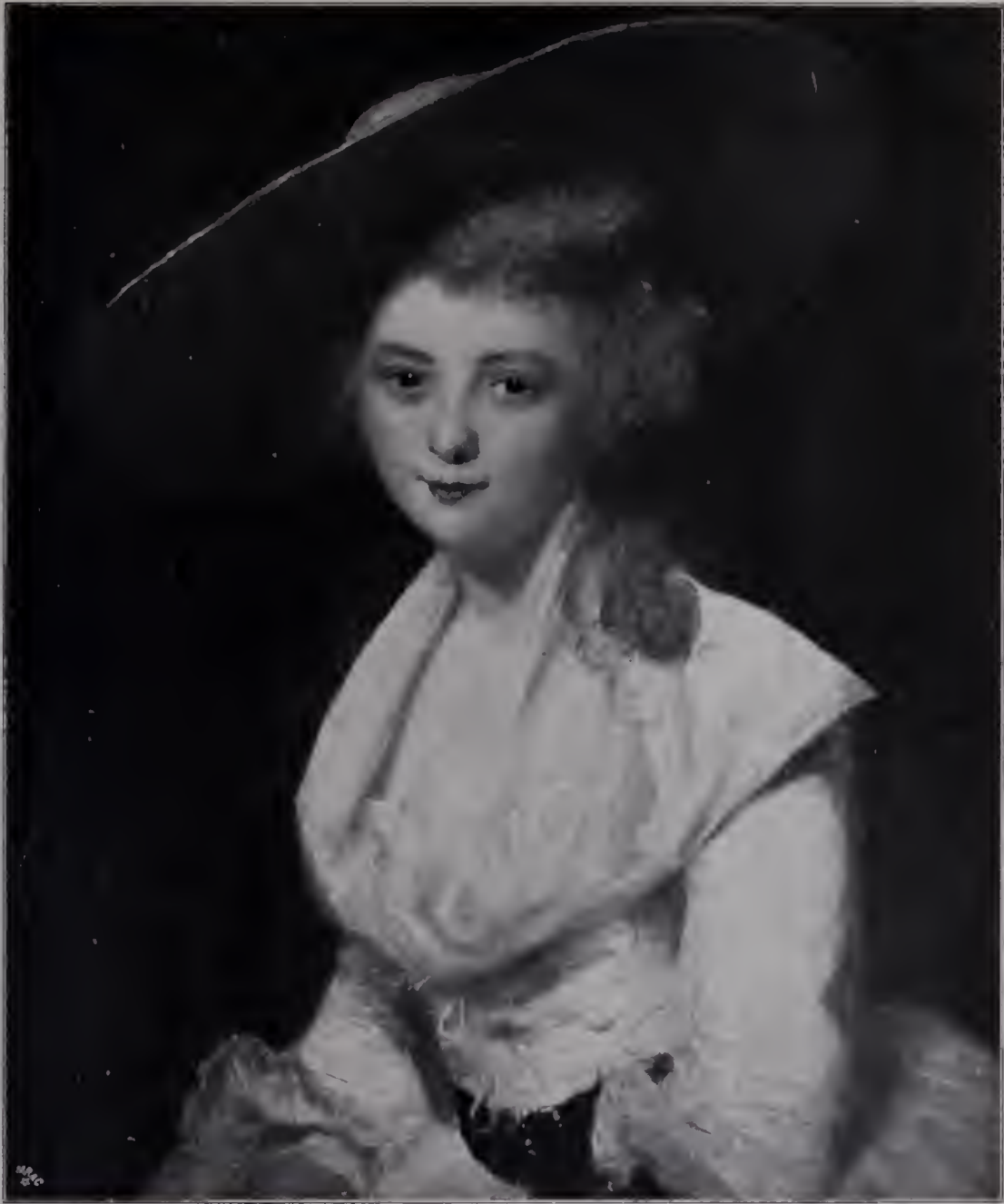
Abb. 58. Lady Anne Bingham. 1786. Carl Spencer.

seine Gesichtszüge auf die Abstammung von einem ländlichen Geschlechte hin. Der junge Reynolds, auf jenem schon genannten Bilde der National Portrait Gallery, auf der zweiten Rembrandtanlehnung beim Earl of Greve (Abb. 2), wie auf dem wenig jüngeren der Nationalgalerie oder auf dem frühesten Selbstporträt, das wir kennen (im Besitz