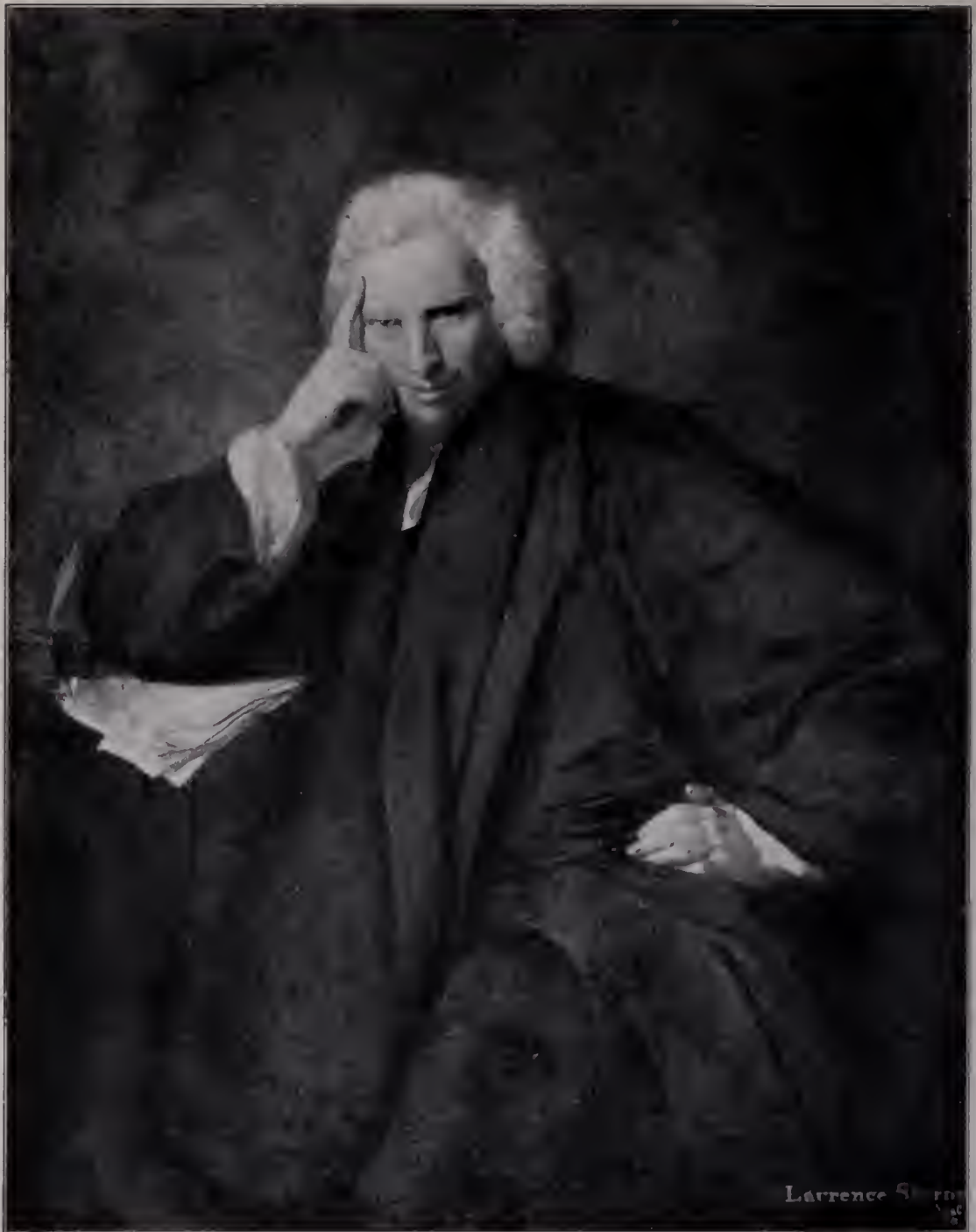
Abb. 12. Laurence Sterne. 1760. Marquess of Lansdowne. (Zu Seite 16 u. 68.)

Ökonomie der Licht- und Schattenverteilung, in der Mischung, in der Bindung und im Auftrag der Farben spiegelt sich der bestimmende Einfluß der italienischen Lehrzeit, die Reynolds genossen. Das warme, goldige Licht, das tiefe Rot und Blau und Braun der Venezianer kehrt wieder, die glühenden Farbtöne des Tizian erklingen aufs neue, von einem Mann, der tief in die Geheimnisse ihrer technischen Entstehung eingedrungen, mit Zaubermacht zu einem zweiten Leben erweckte. Charles Leslie, der englische Genremaler, der in den dreißiger und vierziger Jahren des neunzehnten Jahrhunderts seine großen Erfolge hatte, der Schöpfer des köstlichen Tristram Shandy-Bildes vom Dunkel