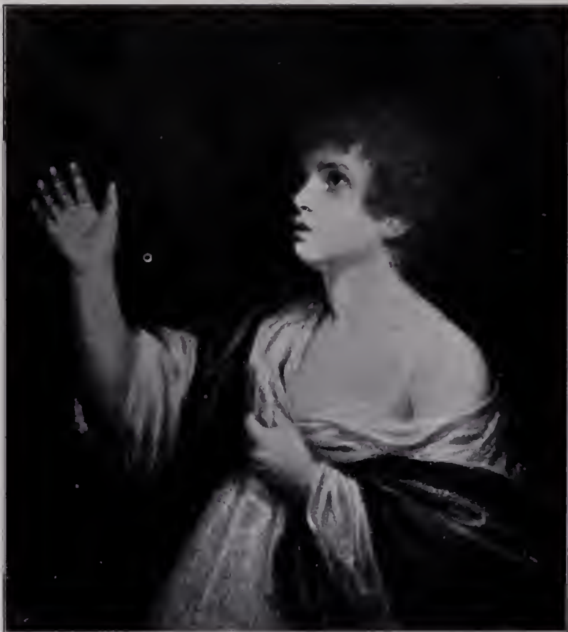
Abb. 77. Prophet Samuel als Kind. 1788. Dulwich Gallery.