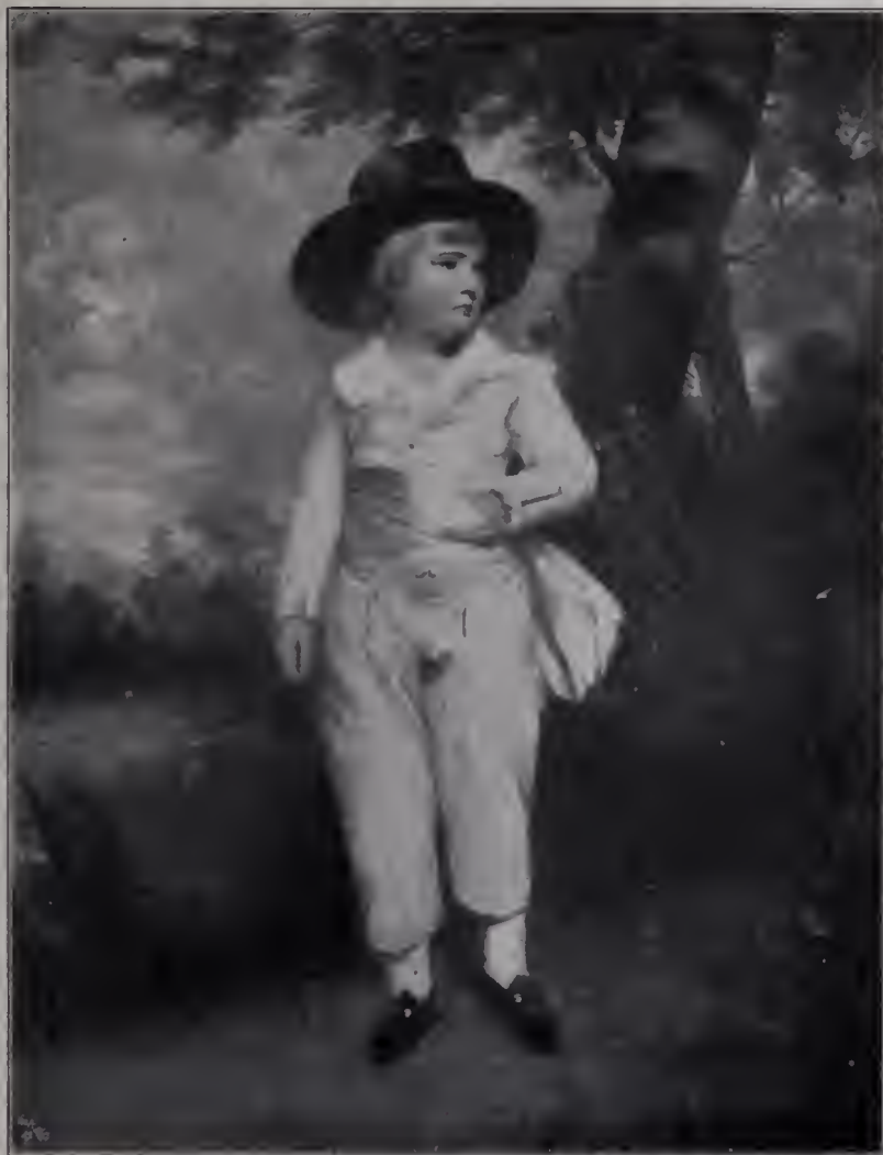
Abb. 74. John Charles Viscount Althorp im Alter von vier Jahren. 1786. Carl Spencer.

Er war dazu geschaffen, die neu begründete Royal Academy als Präsident zu leiten. Im Winter 1768 zu 1769 war das große Institut nach langen Vorbereitungen,