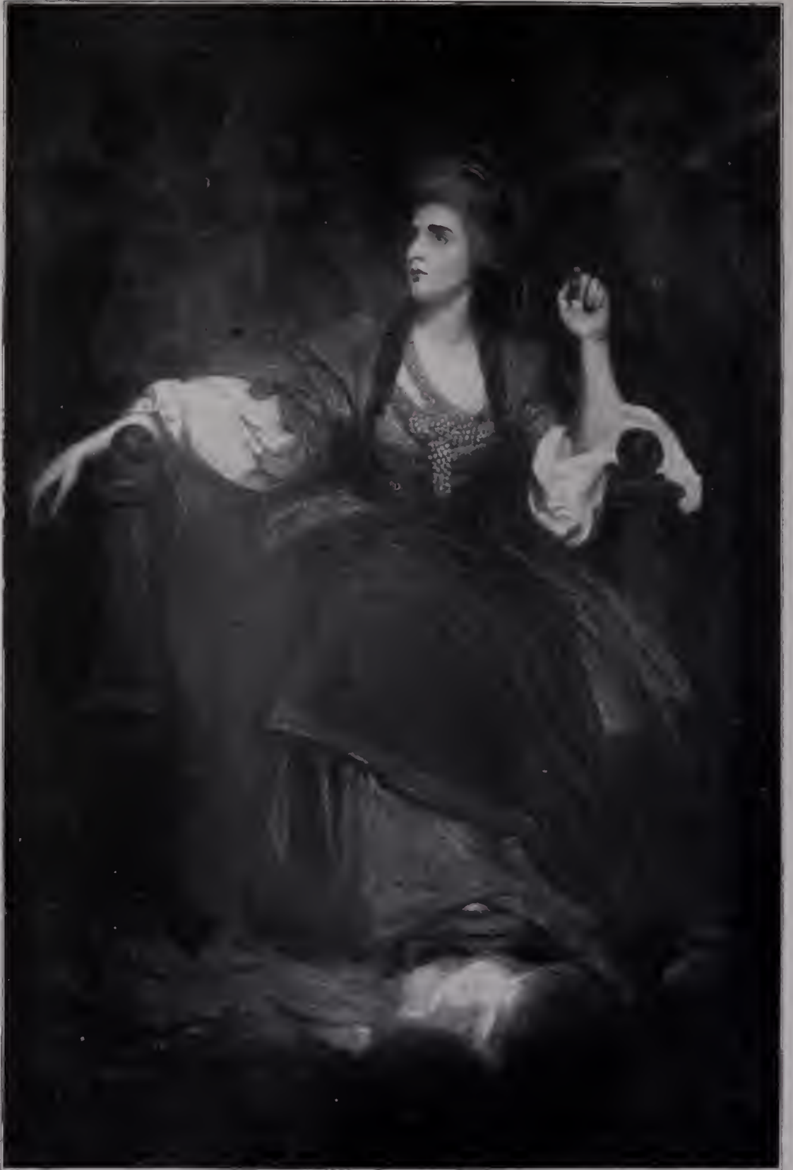
Abb. 48. Mrs. Siddons als tragische Muse, 1783. Dulwich-Gallery. (Zu Seite 117.)