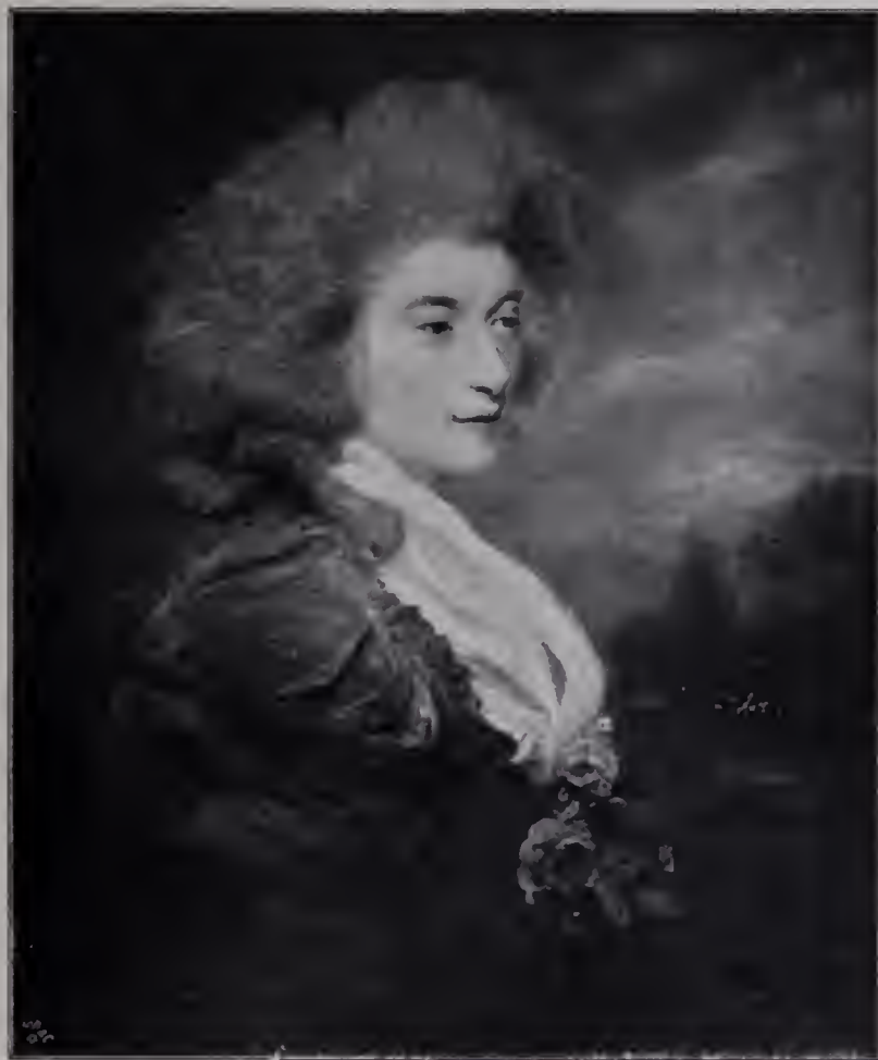
Abb. 53. Henriette Francis Countess of Roseborough. Carl Spencer. (Zu Seite 117.)

Einer freilich hätte Reynolds den Rang streitig machen können: Hogarth, dessen Genie auch im Porträt, und gerade hier, auf neue Pfade wies. Ein Bild wie die Crevettenverkäuferin in der National Gallery geht in der breiten und impressionistischen Wucht der Auffassung und des Vortrags weit über alles das hinaus, was Reynolds geschaffen hat. Aber Hogarth, der kritische Moralist und Realist, hat es nie verstanden, als Porträtmaler besonders beliebt zu werden, es fehlte dem derben Bourgeois, der nicht ohne Grund vor sein Selbstporträt eine knorrige Bulldogge setzte, die große Geiste und die schmeichelhafte Eleganz, die immer nötig waren, um als Porträtist eine zahlreiche Klientel anzuziehen. Der Mangel an Gelegenheit zur Arbeit hat dann auf die Entwicklung des Bildnismalers Hogarth zurückgewirkt, und die Versprechungen, die er