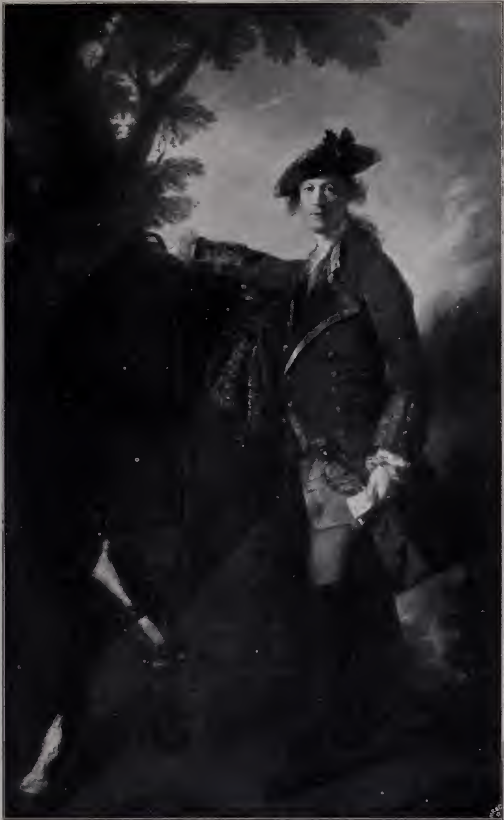
Abb. 13. Kapitän Orme. Vor 1761. London, Nationalgalerie. (Zu Seite 116.)