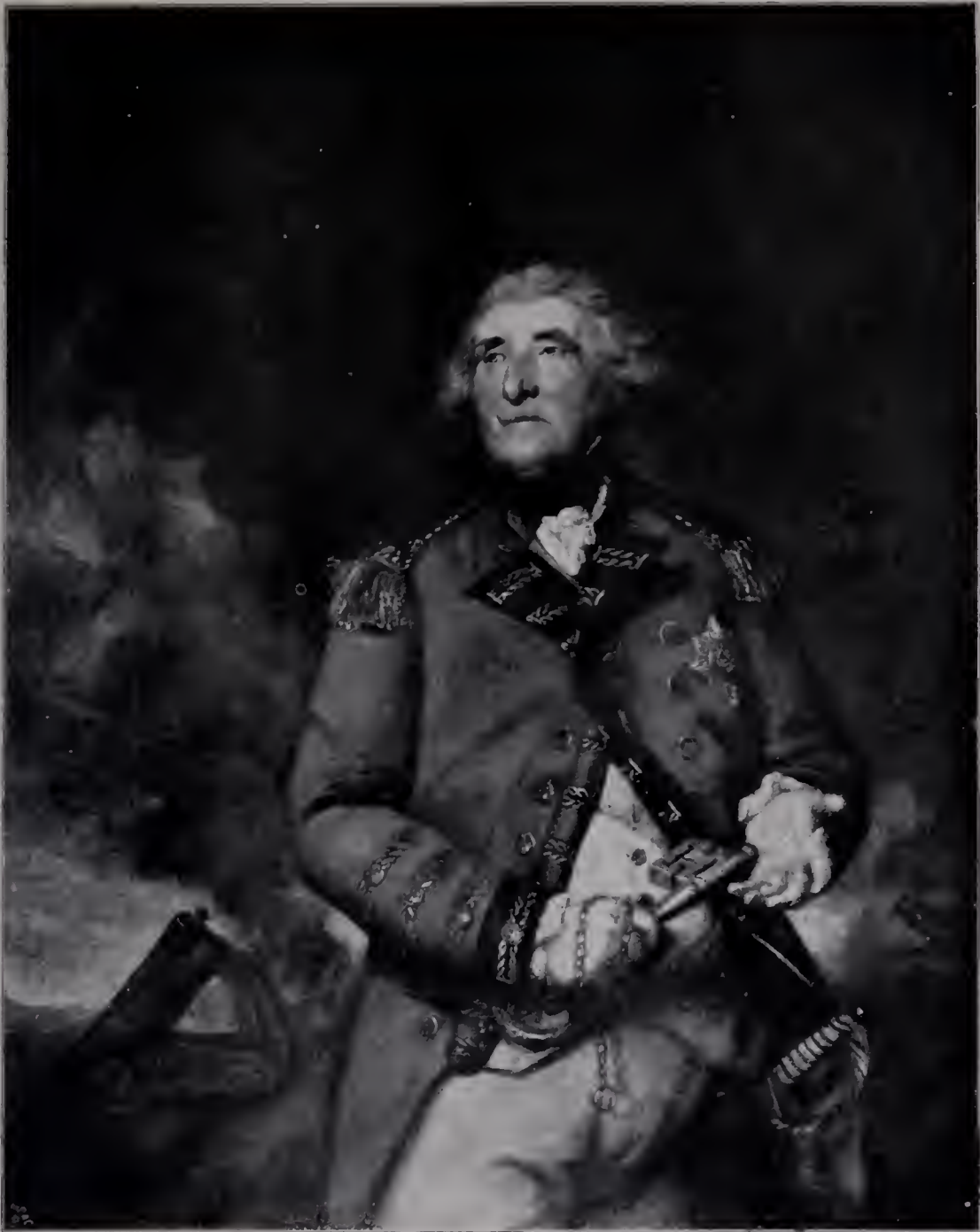
Abb. 16. Lord Heathfield. 1787. London, Nationalgalerie. (Zu Seite 116 u. 117.)

zu allegorischen, historischen, religiösen Kompositionen zwingen will. Der betende kleine Samuel ist nichts als ein entzückendes Kind im Hemdchen, das sein Nachtgebet spricht, und dessen Stumpfnäschen wahrhaftig nicht auf einen künftigen Propheten deutet. Diese mythologischen Damen, die Nymphen, Priesterinnen und Göttinnen, sind nichts als bildschöne Frauen der Londoner Gesellschaft. Die drei Grazien, die eine Büste Hymens schmücken, sind eben drei wundervolle Engländerinnen, die mit erlesenstem Geschmack in einer Parklandschaft gruppiert sind. Die berühmte „Schlange im Grase“ mit der tizianischen Schönen, die so verheißungsvoll sinnlich-verschämt den Beschauer lockt, ist doch nur eine ungedichtete Gruppe von Mutter und Kind, wenngleich mit einer pikanten