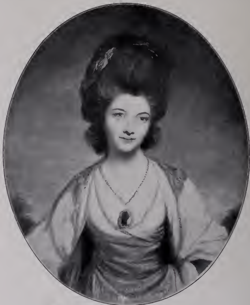
Abb. 43. Lady Betty Compton. Herzog von Devonshire. (Zu Seite 117.)

erscheinen. Von Rembrandt hat er als unverlierbares Gut die wunderbare Kraft übernommen, das innerste Wesen einer dargestellten Persönlichkeit blitzartig zu erhellen, es in einem Augenblicke zu packen, da alle seine Grundzüge wie durch einen glücklichen Zufall vereint zutage treten, da alle Energien, die in dem Individuum sich bergen, zur äußersten Spannung gebracht sind, da das Nuttitz erscheint, als wenn durch ein Gespräch, durch ein Wort, durch eine Erregung, durch einen plötzlich das Hirn durchsuchenden Gedanken alle Geheimnisse der Seele aus ihrem Verstecke gelockt wären. Reynolds wußte wohl, daß zur Sichtbarmachung solcher Tendenzen die an die Schwarz-Weiß-Sprache der Zeichnung erinnernden Kontraste des Licht- und Schattenkampfes besonders gut zu gebrauchen sind. Die künstlerische Wiedergabe dieses alten Krieges zwischen