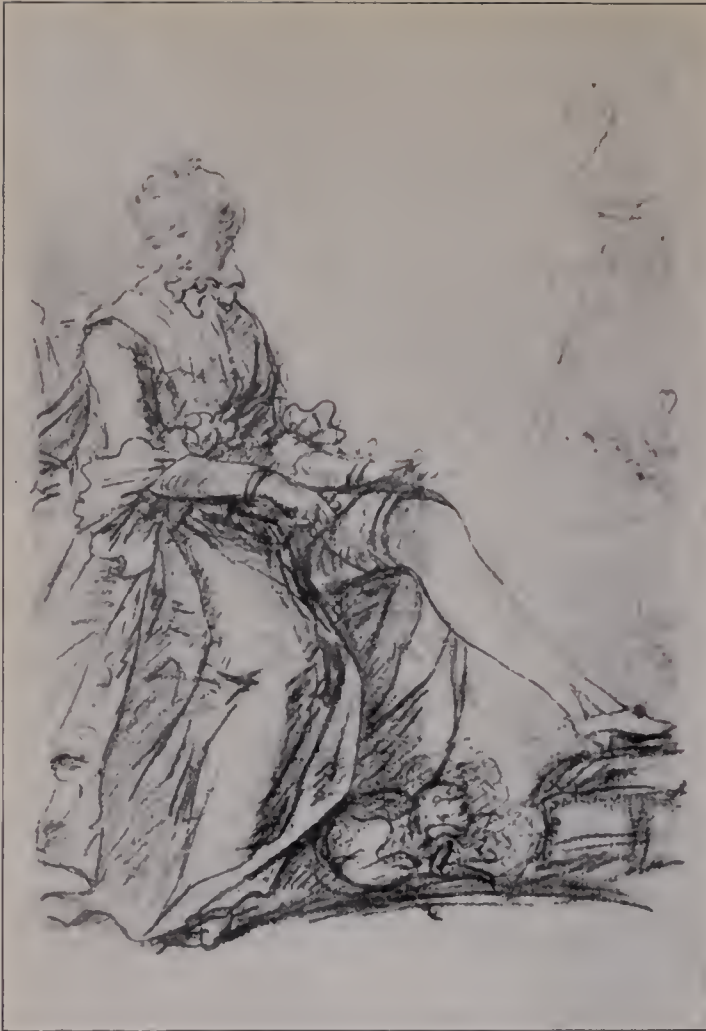
Abb. 111. Seite aus einem der italienischen Taschenbücher. British Museum. (Zu Seite 123.)

scheint es, macht ihn un- abhängig von einer allzu innigen persönlichen Anteil- nahme an dem jeweiligen Modell und hebt ihn über die großen Ungleichheiten hin- weg, die wir im Werke der meisten großen Porträtisten, Gainsborough nicht ausgenom- men, finden. Nur da, wo er erfinden wollte, wo er sich mit bewußter Ab- sicht auf das Gebiet zwang, das ihm die Natur nicht angewiesen hatte, wo er ans unständige Erzählen und Komponieren ging, versagte jene angeborene Kraft. Schon das genrehafte Bild des kleinen Mädchens mit der Mausfalle (bei der Lady Hol- land) weist auf diese Grenze seiner Begabung. Um vieles deutlicher noch das sentimentale Gemälde der Dulwich Gallery mit der Mutter am Bette ihres kranken Kindes und dem Engel im Hinter- grunde, der den Tod fort- scheucht (Abb. 92). Man gar erst die eigentlichen „Ge- sichtsbilder“! Es ruht ihm nichts, daß er auch hier den Anschluß an die Natur fest- zuhalten sucht, für den kleinen