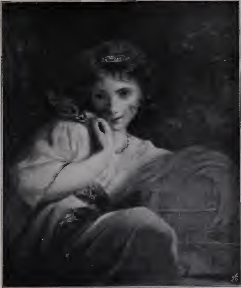
Abb. 60. Robinetta. London, Nationalgalerie.

Begleiter wird, wirkt gleichfalls auf den Eindruck des Gesichts, weil der Blick der Augen, gewöhnt, sich auf den Mund des Sprechenden zu richten und überhaupt ringsum scharf zu beobachten, an Eindringlichkeit zunimmt. Schließlich verliert auch das Auge seine jugendliche Kraft, und eine Hornbrille muß sie ihm ersetzen (Abb. 7). Das alles bewirkt gewiß eine Veränderung in der Erscheinung Reynolds'; aber im ganzen entsprechen doch die Züge des Greises durchaus denen des knabenhaften Jünglings. Von dem erschütternden Kontrast, den das zerklüftete Gesicht des alten Rembrandt zu der strahlenden Frische von Saskias Bräutigam und Eheherrn darstellt, kann hier keine Rede sein. Nur die Sicherheit und Festigkeit Reynolds' wächst immer imponierender heran und steigert sich