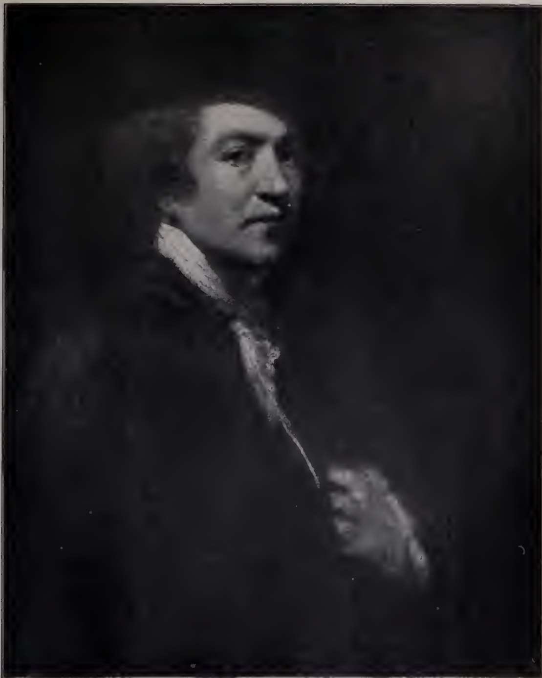
Abb. 5. Selbstporträt von 1773. London, Nationalgalerie. (Zu Seite 62 u. 66.)

und allgemeiner wird die Bewegung. Es nahen die Bahnbrecher und Vorbereiter der großen klassischen Zeit der englischen Malerei. Schon ragen aus der wachsenden Schar tüchtiger Londoner Künstler einzelne Männer hervor, die sich einen ehrenvollen Platz in der Kunstgeschichte erobern. So Jonathan Richardson, dessen Arbeiten man neuerdings mit erhöhtem Interesse zu studieren beginnt, der Verfasser des berühmten „Essay on the Theory of painting“ und anderer kunstkritischer Schriften, die auf den jungen Reynolds entscheidenden Einfluß ausübten. So Thomas Hudson, der sein erster Lehrer ward. Oder Allan Ramsay, der Begründer der schottischen Kunst, jene glänzende Erscheinung, deren Liebenswürdigkeit und Geistreichtum Sir Joshua später nur ungern an seiner Tafel ver-