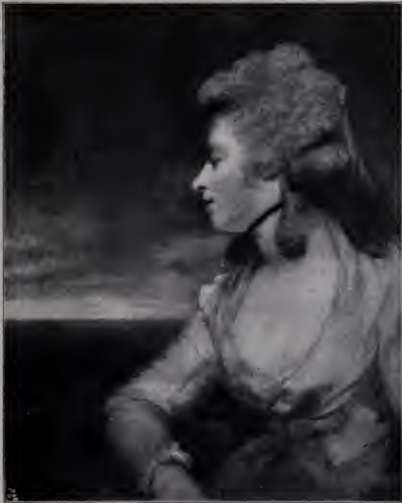
Abb. 49. Miß „Perdita“ Robinson. 1784. London, Wallace Collection. (Zu Seite 117, vgl. Abb. 94.)

ihr zu uns unmittelbar wie ein elektrischer Strom überspringt, und wie trotzdem das Ganze mit weiser Berechnung zu dekorativer und monumentaler Strenge gebündelt ist. Admiral Keppel hatte als Seeoffizier, noch vor der Bekanntschaft mit Reynolds, ein Erlebnis gehabt, das seinen Namen allgemein bekannt machte. Er war Kommandant eines Schiffes gewesen, das an der französischen Küste auf eine Klippe lief und scheiterte. Mit großer Umsicht hatte er dabei die Rettungsarbeiten geleitet, so daß das Kriegsgesicht ihn aller Schuld ledig sprach. Das war ein Vorgang, an den jeder dachte, sobald der Name des Admirals ausgesprochen wurde. Mit guter Witterung knüpfte Reynolds daran an. Er zeigt den Admiral auf der Küste vor stürmbewegtem Meer,