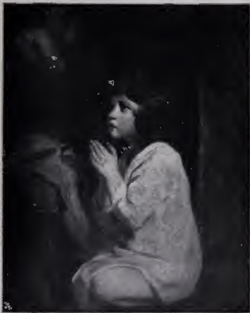
Abb. 76. Der kleine Samuel im Gebet. London, Nationalgalerie. (Zu Seite 108 u. 123.)

In jenem Jahre 1769 erscheint der Präsident mit einer