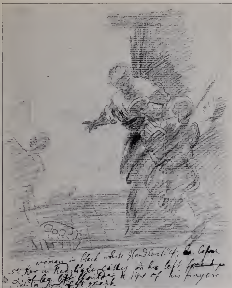
Abb. 114. Zeichnung nach Tintoretto. Aus einem italienischen Taschenbuche. Venedig, Simole di S. Marco. British Museum 131, Nr. 9, S. 57. (Zu Seite 123.)

Wiederholt schon war von Reynolds' Theorien und ästhetischen Abhandlungen die Rede (s. oben S. 82, 106 ff.). Sie nehmen im Vermächtnis unseres Meisters einen so bedeutenden Rang ein, daß ein rascher Überblick über seine literarische Tätigkeit nicht entbehrt werden kann.