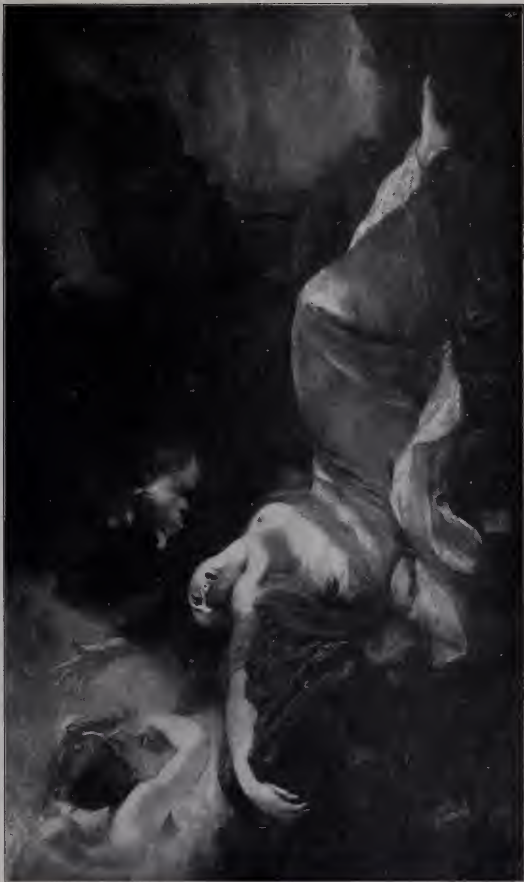
Abb. 88. J. M. W. Turner. 1888. Rain, Steam, and Great Central Railway. (Zu Seite 92.)