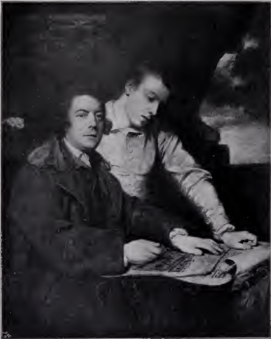
Abb. 31. James Paine mit seinem Sohne. 1764. Oxford, Universitäts-galerie. (Zu Seite 115 u. 116.)

Man darf annehmen, daß diese Fahrt nach der ewigen Stadt der Hauptgrund für Reynolds war, sich Keppel anzuschließen. Denn Rom schwebte ihm wie allen Künstlern der Zeit als das Ziel seiner Sehnsucht vor Augen. Wir wissen aus hundert Quellen, was es für die führenden Geister des achtzehnten Jahrhunderts bis weit ins folgende Säkulum hinein bedeutete, im Angesicht der angebeteten Denkmäler der alten Zeit ihre Lehrjahre abzuschließen. „Am 8. März 1797,“ so schrieb Thorwaldsen von dem Termin seiner Ankunft in Rom, „wurde ich geboren. Vor diesem Tage existierte ich nicht.“ Auch Reynolds mag die Empfindung gehabt haben, daß sich ihm jetzt erst die Pforten der wahren Kunst erschlossen. Wenn Goethe in seiner Italienfahrt eine Wiedergeburt erblickte, die ihm zuteil geworden, wenn noch Anselm Feuerbach bei seinem Eintritt in Rom ein Wunder,