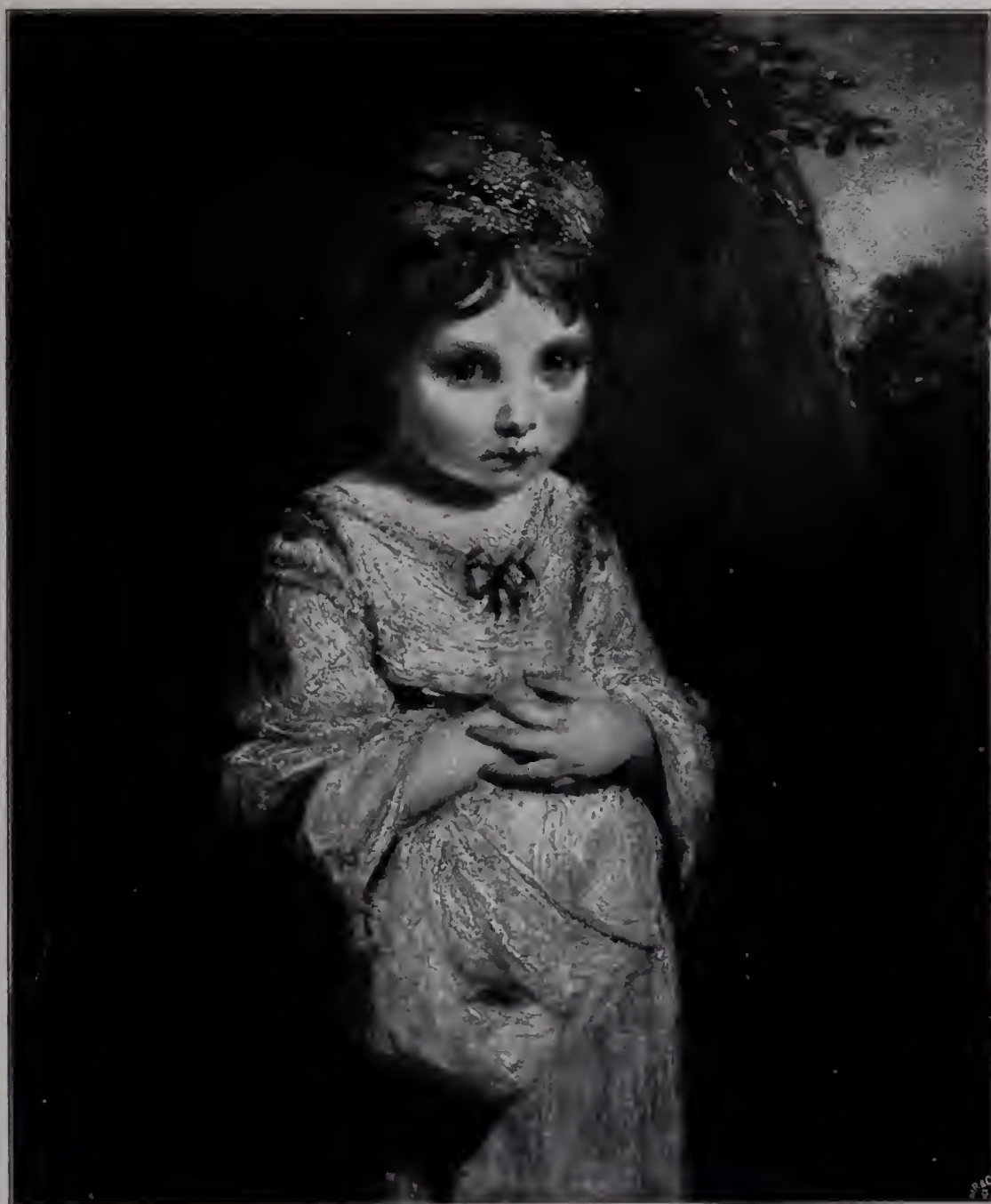
Abb. 78. Das Erdbeermädchen. 1771/72. Wallace-Collection. (Zu Seite 120.)

Spitze anwies, als den Platz, der ihm ohne weiteres gebührte. Die Revision der modernen Ästhetiker hat diese alte Rangordnung aufgehoben und die einstige Gleichstellung der drei wiederhergestellt, die schon ihre Zeitgenossen dunkel empfanden, wenn sie sich das auch der Respektsperson des „Präsidenten“ gegenüber nicht offen einzugestehen wagten. Wir Dentigen sind nicht mehr im Zweifel darüber, daß Romney mit seinem breiten, freien Vortrag und der Frische und Delikatesse seines Kolorits als Maler — sofern Malerei im Grunde und vor allem die Kunst des farbigen Ausdrucks ist — den Vergleich mit Reynolds ruhig aufnehmen kann, wenn er ihn auch als Persönlichkeit, als Kulturfaktor und intellektuelle Potenz gewiß nicht erreicht. Auch die Londoner Gesellschaft schätzte jene