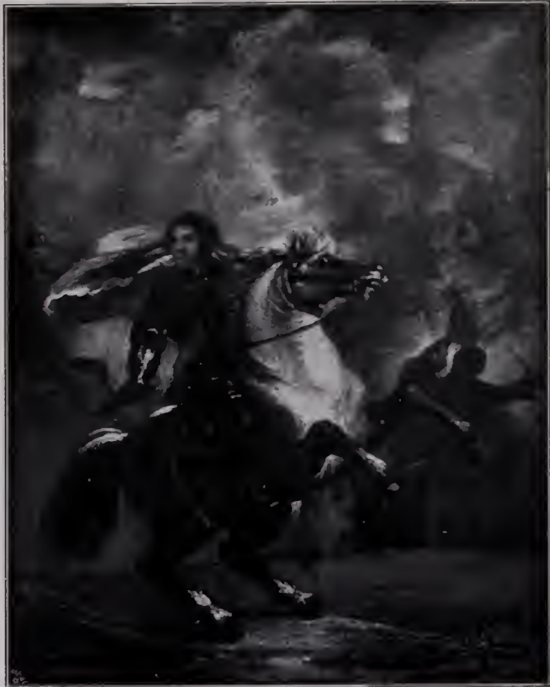
Abb. 33. Schlachtenbild (Reiterporträt eines Generals). Ludwick Gallery. (Zu Seite 116.)

Die Stellung, die Reynolds zu den italienischen Meistern einnahm, mit deren Studium er nun begann, ist so merkwürdig bezeichnend für seine ganze Art und Kunst, für den Maler wie für den Menschen in ihm und für seine spätere Entwicklung, daß wir ein wenig ausführlicher dabei verweilen müssen. Wieder erhebt sich das große Rätsel des eigentümlichen Zwiespalts, der sich durch sein ganzes Leben hindurchzieht: daß er als Schaffender und als Denkender ein völlig verschiedenes Antlitz zeigt, weil er sich selbst