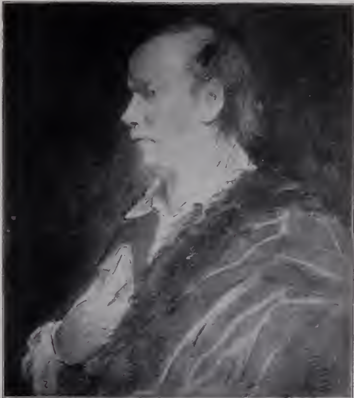
Abb. 96. Oliver Goldsmith. Feder und Tusche. British Museum. (Zu Seite 121.)