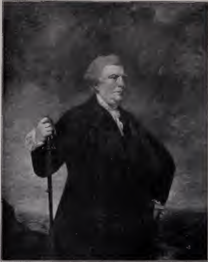
Abb. 8. Admiral Keppel. 1759. London, Nationalgalerie. (Zu Seite 55.)

Epoche durchaus begründet auf dem realistischen Fundament der Landschaft, des Tierbildes, des Sittenstückes, des Porträts. Die Engländer des achtzehnten Jahrhunderts wurden hierdurch die Rechtsnachfolger der Holländer des siebzehnten und die Bewahrer der deutschen Traditionen des sechzehnten Jahrhunderts. Die Bewahrer des germanisch-realistischen Elementes, das im Verlauf dieser Jahrhunderte in Gegensatz zu den romanischen Stilgedanken getreten war. Wie in der Literatur, so erscheinen die Engländer auch in der bildenden Kunst zur Rokoko-Epoche als die großen Vertreter dieses germanischen Prinzips, das sie dann, im Zeitalter der Revolution, an das Festland zurückgaben.