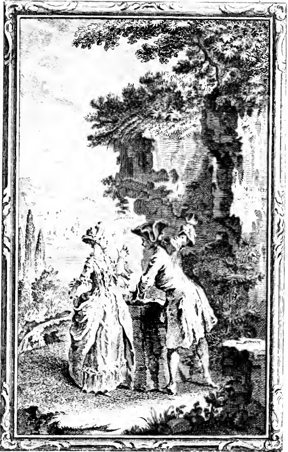
Les mommens des anciennes amours.