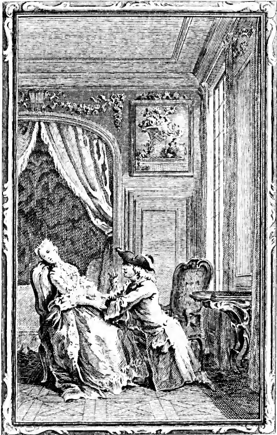
La force Paternelle