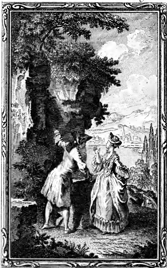
Les mouvemens des anciennes amours.