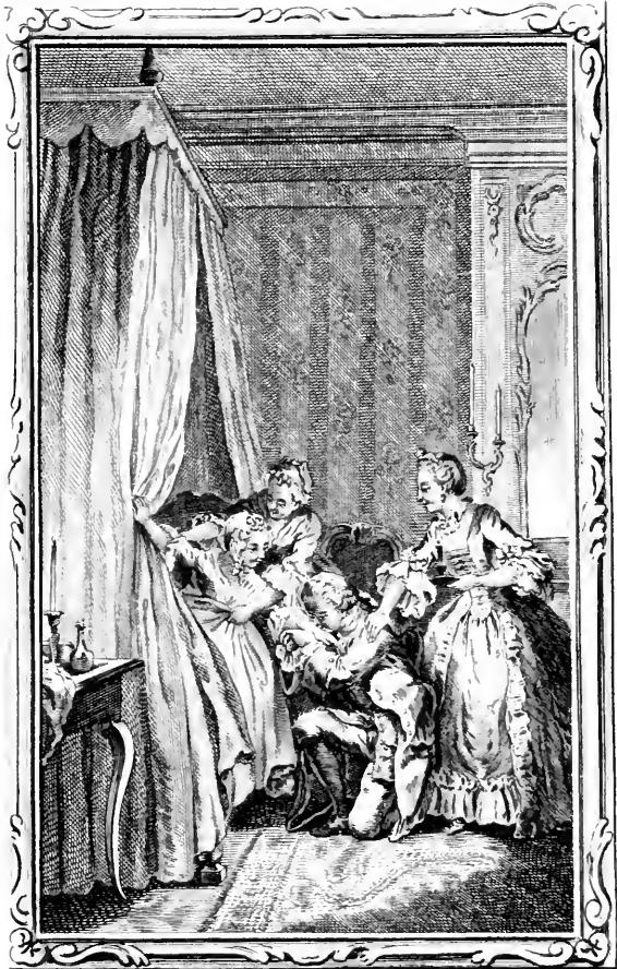
L'Inoculation de l'amour