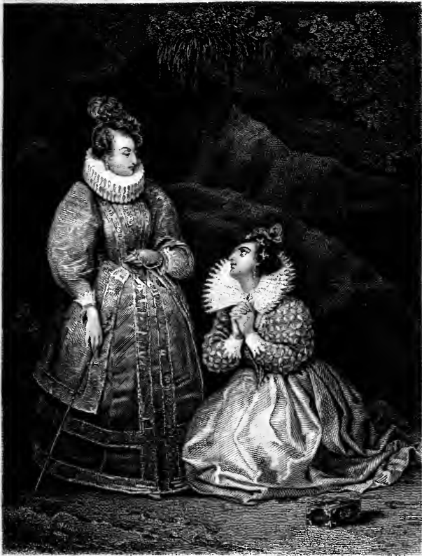
A. Johannot pinx.