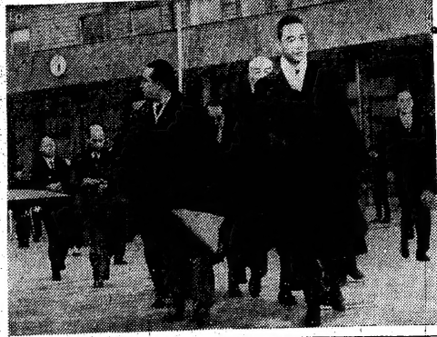
汪主席を讃ふ 汪主席の宣戦を熱烈に歓迎する人々の様子。

米英宣戦に汪主席を讃ふ 汪主席の宣戦は、我が國の命運を左右する重大な決意である。この宣戦は、我が國の自由と主権を守るためのものである。我々國民は、この宣戦を熱烈に歓迎し、我が國の勝利を確信する。