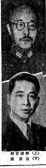
（左）首相東條 （右）外相廣田

情報局發表（九日午後零時）本日中華民國政府は米英兩國に對して宣戰を布告し、ついで午前十一時國民政府大禮堂において重光特命全權大使、汪行政院長の間、「戰爭完遂」についての協力を請うる日華共同宣言」および「租界還附および治外法權撤廢」などに關する日本國、中華民國間に協定調印を見た、右に關し帝國政府において聲明を行ひ、また東條内閣總理大臣の談話が發表せられた。