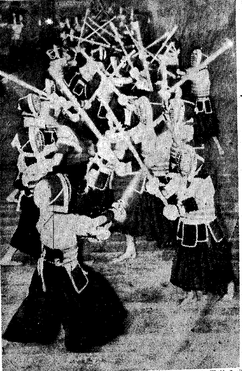
本格的に鹿麻糬を飼育... (Caption for the group photo)

見本進呈... (Additional text about the presentation)