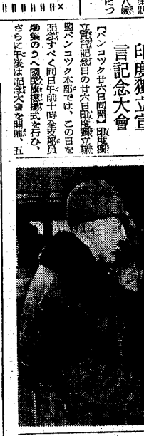
印度獨立宣言記念大會