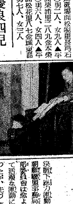
日出版表形式... (Caption for the photograph of the award recipients.)

十八家庭 紀元の佳節に晴の表彰 本邦各地に於ける佳節に晴の表彰... (Text describing the award ceremony for the 'Shan Peninsula Children's Treasure Trove' unit, mentioning 18 families and the occasion of a festival.)