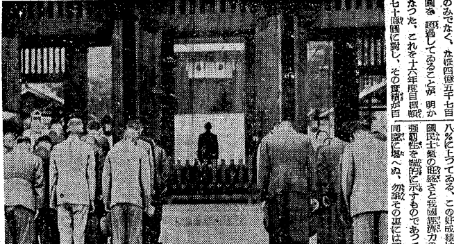
日銀理事 荒川昌二氏談

加藤三和銀行常務談 昨年年度は、銀行界は、戦時下の特殊な環境の中で、経済力の強靱性を発揮した。加藤氏は、銀行界は、戦時下の特殊な環境の中で、経済力の強靱性を発揮したと述べた。また、銀行界は、戦時下の特殊な環境の中で、経済力の強靱性を発揮したと述べた。