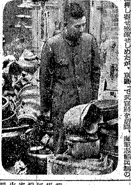
Caption for the group photo

【東京二十一日】... (Main text of the dramatic scene report)