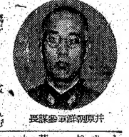
井原朝鮮軍參謀長