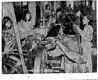
六港に船員診療所開設

六港に船員診療所開設 六港に船員診療所開設。六港に船員診療所開設。六港に船員診療所開設。