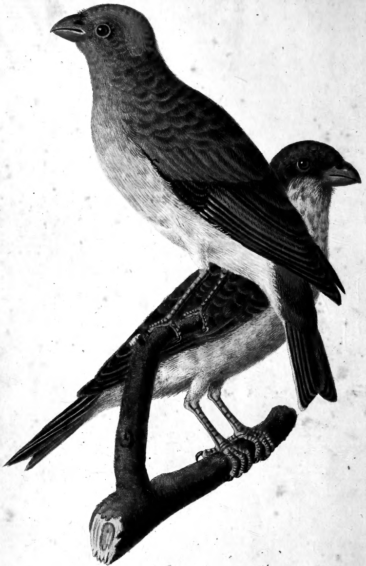
Fringilla erythrina Meyeri.