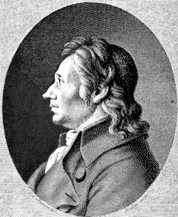
Asmus Jakob Carstens.