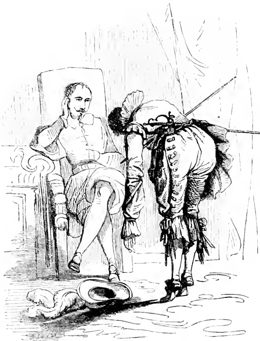
Le maître à danser.

Le comte-luc, qui prenait encore plus de part que je ne croyais au début de cette actrice, était à la comédie ce soir-là. Je le vis sortir sur la fin de la pièce, fort satisfait, à ce qu'il me parut, de nos deux comédiennes. Curieux de savoir s'il en était véritablement affecté, je le suivis chez lui, et, m'introduisant dans son cabinet, où il venait d'entrer, Eh bien! monseigneur, lui dis je, Votre Excellence est-elle contente de la petite Marialva? Mon Excellence, répondit-il en souriant, serait bien difficile, si elle refusait de joindre son suffrage à celui du public. Oui, mon enfant, ton voyage de Tolède a été heureux. Je suis charmé