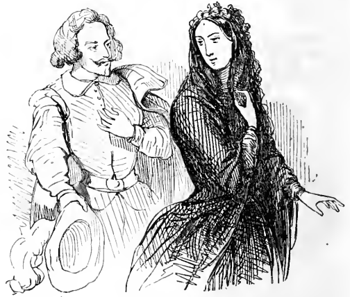
La pudeur de la veuve.

cela vraiment que s'amuse les intendants de ces sortes de maisons ! Ils songent plutôt à profiter du dérangement des affaires qu'à y mettre ordre. Ce n'est donc pas un intendant que vous voyez, c'est un auteur ; le marquis le loge dans son hôtel pour se donner un air de protecteur des gens