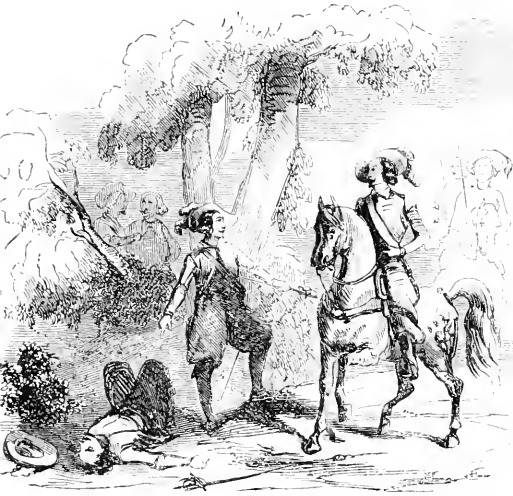
Arrestation de Ribagore.

mante. Je ne m'étonne plus, disais-je en moi-même, que cette beauté ait fait tant de bruit à Saragosse; dans quel endroit du monde où il y a des hommes ne serait-elle point admirée? Vraiment, je n'ai jamais rien vu de si ravissant que cette dame. Aussi j'eus toujours les yeux sur elle pendant qu'elle fut à la fenêtre, et, vous le dirai-je, messieurs, ajouta-t-il, la friponne, en se retirant, emporta mon cœur avec elle.