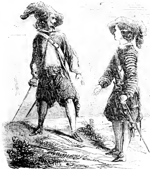
Gil Blas et le barbare.

Je remarquai dans la salle une espèce de vieux moine vêtu de bure grise, qui soupait tout seul dans un coin. J'allai par curiosité m'asseoir vis-à-vis de lui; je le saluai fort civilement, et il ne se montra pas moins poli que moi. On m'apporta un platier, que je commençai à expédier, avec beaucoup d'appétit. Pendant que je mangeais sans dire mot, je regardais souvent ce personnage, dont je trouvais toujours les yeux attachés sur moi. Fatigué de son attention opiniâtre à me regarder, je lui adressai ainsi la parole : Père, nous serions-nous vus par hasard ailleurs qu'ici? Vous m'observez comme un homme qui ne vous serait pas entièrement inconnu.