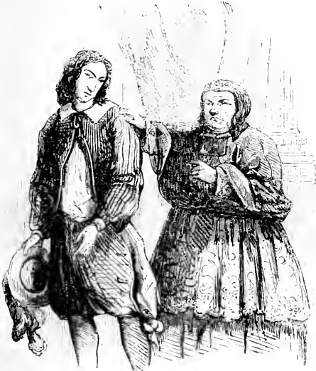
L'Archevêque et Grenie chassé Gil Blas.

De là passant aux conséquences, je me représentai que je jouais gros jeu, en trompant un homme de condition qui, pour mes péchés, peut-être, ne tarderait guère à découvrir la fourberie. Une si judicieuse réflexion jeta quelque terreur dans mon esprit, mais des idées de plaisir et d'intérêt l'enrent bientôt dissipée. D'ailleurs la prophétie de l'homme à l'élixir aurait suffi pour me rassurer. Je me livrai donc à des images tout agréables. Je me mis à faire des règles d'arithmétique, à compter en moi-même la somme que feraient mes gages au bout de dix années de service. J'ajoutais à cela les gratifications que je recevrais de mon maître ; et, les mesurant à son humeur libérale, ou plutôt à mes desirs, j'avais une intempérance d'imagination, si l'on peut parler ainsi, qui ne mettait point de bornes à ma fortune. Tant de bien peu à peu m'assoupit, et je m'endormis en bâtissant des châteaux en Espagne.