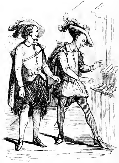
Le belléier de la pantoufle.

faisait pas trop bien ses affaires à Barcelone, il résolut d'aller s'établir à Carthagène, dans la pensée qu'en changeant de lieu il deviendrait plus heureux qu'il n'était. Il s'embarqua donc pour Carthagène avec sa mère; mais ils rencontrèrent un pirate d'Alger qui les prit, et les amena dans cette ville. Ils furent vendus, sa mère à un Maure, et lui à un Turc qui le maltraita si fort, qu'il embrassa le mahométisme pour finir son cruel esclavage, comme aussi pour procurer la liberté à sa mère, qu'il voyait traitée avec beaucoup de rigueur chez le Maure son patron. En effet, s'étant mis à la solde du bacha, il alla plusieurs fois en course, et amassa quatre cents patagons: il en employa une partie au rachat de sa mère; et, pour faire valoir le reste, il se mit en tête d'écumer la mer pour son compte.