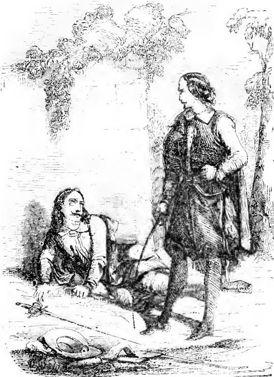
Confession de don Héctor.

M. le greffier, qui déjà tenait à la main son papier et son écriture, s'assit à une table, et se prépara, de l'air du monde le plus sérieux, à écrire la déposition de l'hôte, qui de son côté protesta qu'il ne trahirait point la vérité. Cela étant, lui dit le commissaire inquisiteur, nous n'avons qu'à commencer. Répondez seulement à mes questions, je ne vous en demande pas davantage. Voyez-vous Samuel fréquenter les églises? C'est à quoi je n'ai pas pris garde, répondit le cabaretier; je ne me souviens pas de l'avoir vu à l'église. Bon! s'écria l'inquisiteur, écrivez qu'on ne le voit jamais dans les églises. Je ne dis pas cela, monsieur, répliqua l'hôte; je dis seulement que je ne l'y ai point vu. Il peut être dans une église où je serai, sans que je l'aperçoive. Mon ami, reprit Lamela, vous oubliez qu'il ne faut point, dans votre interrogatoire, excuser Samuel Simon; je vous en ai dit les conséquences. Vous ne devez dire que des choses qui soient contre lui, et pas un seul mot en sa faveur. Sur ce pied-là, seigneur licencié, reparti l'hôte, vous ne tirerez pas grand fruit de ma déposition. Je ne connais point le marchand dont il s'agit, je n'en puis dire ni bien ni mal; mais si vous voulez savoir comment il vit dans son domestique, je vais faire venir ici Gaspard,