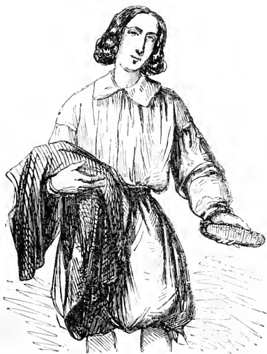
Gil Blas domestique chez don Bernard.

Comme mon aventure n'était ignorée de personne, et que je ne passais pas pour un lâche, tout le monde s'étonnait de me voir aussi tranquille que si je n'eusse pas reçu un affront, car je ne disais pas ce que je pensais, et je semblais n'avoir aucun ressentiment. On ne savait que s'imaginer de ma fausse insensibilité. Les uns croyaient, malgré mon courage, le rang de l'offenseur me tenait en respect et m'obligeait à dévorer l'offense ; les autres, avec plus de raison, se défilèrent de mon silence, et regardaient comme un calme trompeur la situation paisible où je paraissais être. Le roi jugea, comme ces derniers, que je n'étais pas homme à laisser un outrage impuni, et que je ne manquerais pas de me venger sitôt que l'en trouverais une occasion favorable. Pour savoir s'il devenait ma pensée, il me fit entrer un jour dans son cabinet, où il me dit : Don Pompeyo, je sais l'accident qui vous est arrivé, et je suis surpris, je l'avoue, de votre tranquillité : vous dissimulez certainement. Sire, lui répondis-je, j'ignore qui peut être l'offenseur ; j'ai été attaqué la nuit par des gens inconnus ; c'est un malheur dont il faut bien que je