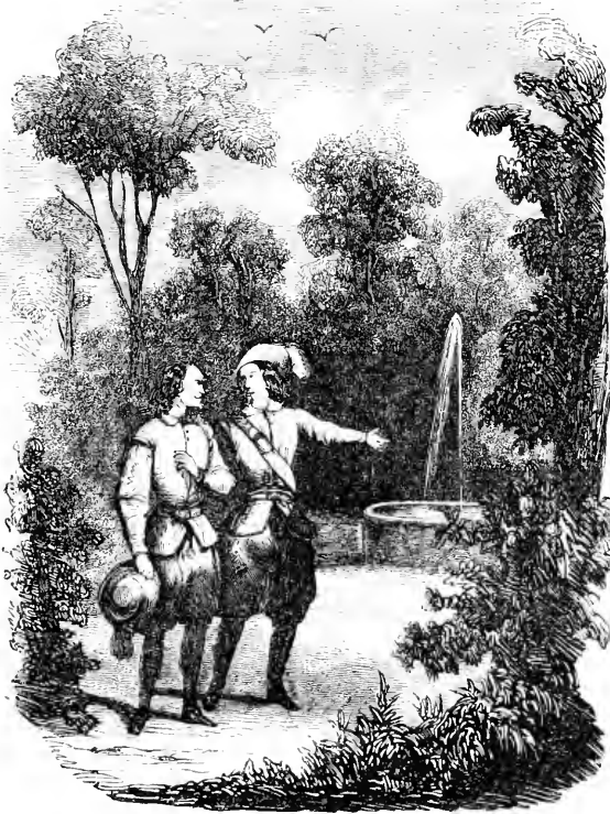
Le jardin de Liras.

Don Anastasio de Rada, gentilhomme grenadin, vivait heureux dans la ville d'Antequerra avec dona Estephania, son épouse, qui joignait à une vertu solide un esprit doux et une extrême beauté. Si elle aimait tendrement son mari, elle en était aimée également. Il était de son naturel fort porté à la jalousie; et quoiqu'il n'eût aucun sujet de douter de la fidélité de sa femme, il ne laissait pas d'avoir de l'inquiétude. Il appréhendait que quelque secret ennemi de son repos n'attendât à son honneur. Il se défiait de tous ses amis, excepté de don Huberto de Bordesales, qui venait librement dans sa maison en qualité de cousin d'Estephania, et qui était le seul homme dont il dût se défier.