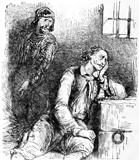
Gil Blas dans la tour de Segovie.

d'aller à Xelva faire cette restitution: tant pis pour Samuel s'il a été capable de toucher cette somme après avoir été remboursé de tout par le seigneur de Santillane! Mais, leur dis-je, vos quinze cents ducats lui ont-ils été fidèlement remis? Sans doute, s'écria don Raphaël; je répondrais de l'intégrité de l'ecclésiastique comme de la mienne. J'en serais aussi la caution, dit Lamela: c'est un saint prêtre accoutumé à ces sortes de commissions, et qui a eu, pour des dépôts à lui confiés, deux ou trois procès qu'il a gagnés avec dépens. Cela étant, repris-je, il ne faut pas douter que la restitution n'ait été faite avec une scrupuleuse fidélité.