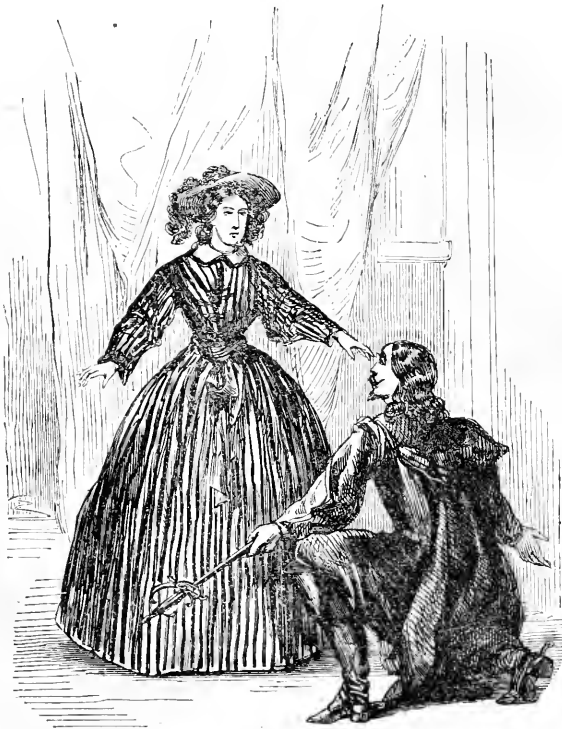
Don Alphonse aux pieds de Séraphine.