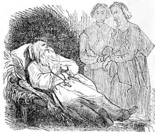
Mort du frère don Juan.

Après avoir fait ma provision de pain, poursuivit-il, je suis entré chez un rôtisseur, où j'ai ordonné qu'on mit à la broche six perdrix, autant de poudets et de lapereaux. Tandis que ces viandes cuisent, il arrive un homme en colère, et qui, se plaignant hautement des manières d'un marchand de la ville à son égard, dit au rôtisseur: Par saint Jacques, Samuel Simon est le marchand de Xelva le plus ridicule; il vient de me faire un affront en pleine boutique. Le ladre n'a pas voulu me faire crédit de six aunes de drap; cependant il sait bien que je suis un artisan solvable, et qu'il n'y a rien à perdre avec moi. N'admirez-vous pas cet animal? Il vend volontiers à crédit aux hommes de qualité; il aime mieux hasarder avec eux que d'obliger un honnête bourgeois sans rien risquer. Quelle manie! le maudit juif! puisse-t-il être attrapé! Mes souhaits seront accomplis quelque jour; il y a bien des marchands qui m'en répondraient.