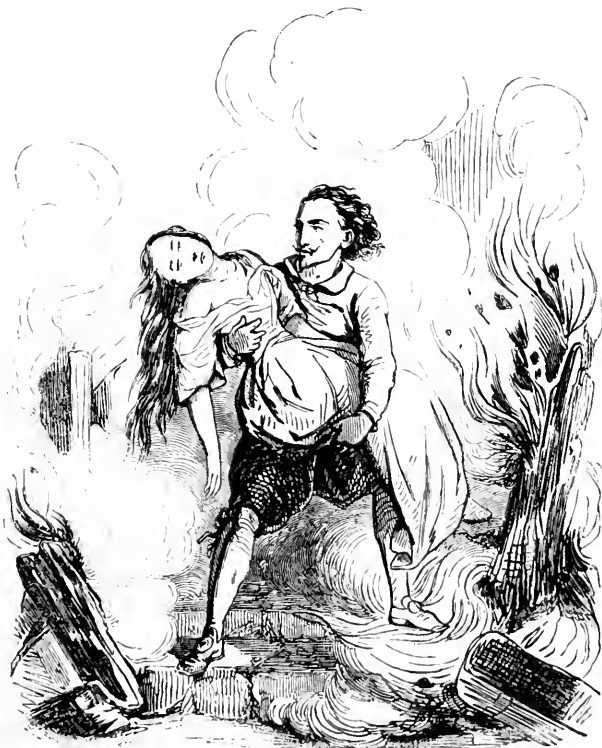
Asmodée sauve Scraphine des flammes.

Il n'eut pas sitôt dit ces paroles, qu'empruntant la figure de Leandro Perez, au grand étonnement de cet écolier, il se glissa parmi le peuple, traversa la presse, et se lança dans le feu, comme dans son élément, à la vue des spectateurs, qui furent effrayés de cette action, et qui la blâmaient par un cri général. Quel extravagant ! disait l'un ; comment l'intérêt a-t-il pu l'aveugler jusque-là ? S'il n'était pas entièrement fou, la récompense