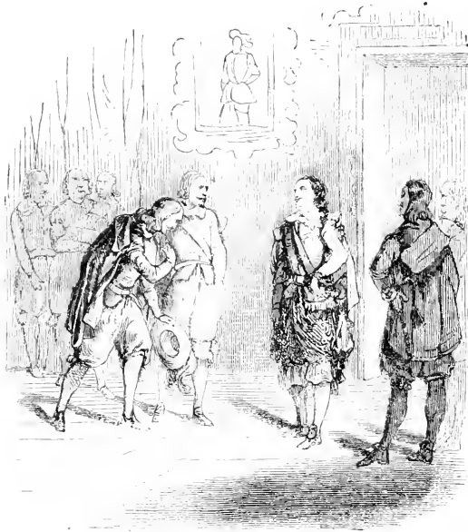
Gil Blas présente au duc de Lerme.

Atalmue. C'est, répondit Zéangir, qu'un derviche cabalistique m'a enseigné la langue des oiseaux. Si vous le souhaitez, j'en conterai ceux-ci, et je vous répéterai mot pour mot ce que je leur aurai entendu dire.