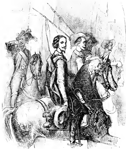
Entrée du vice-roi à Saragosse.

Je soutins, continua-t-elle, au marquis de Marialva que tu étais mon