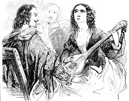
Le prince d'Espagne chez Géralda.

contre, pour lui épargner la moitié du chemin. Nous nous joignons bientôt. C'était mon rival. Chevalier, me dit-il insolemment, c'est à regret que j'en viens aux mains une seconde fois avec vous; mais c'est votre faute. Après l'aventure de la sérénade, vous auriez dû renoncer de bonne grâce à la fille de don Georges, ou bien vous tenir pour dit que vous n'en seriez pas quitte pour cela si vous persistiez dans le dessein de lui plaire. Vous êtes trop fier, lui répondis-je, d'un avantage que vous devez peut-être moins à votre adresse qu'à l'obscurité de la nuit. Vous ne songez pas que les armes sont journalières. Elles ne le sont pas pour moi, répliqua-t-il d'un air arrogant; et je vais vous faire voir que le jour comme la nuit je sais punir les chevaliers audacieux qui vont sur mes brisées.