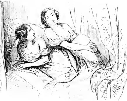
Les deux sœurs.

Où, mon cher Francisque, s'écria don Juan transporté de l'espérance que l'esclave navarrois lui donnait, vous pouvez tout promettre à ce renégat; vous et lui soyez sûrs d'être bien récompensés. Mais croyez-vous que ce projet s'exécute de la manière que vous le concevez? Il peut y avoir des difficultés qui ne s'offrent point à mon esprit, repartit Fran-