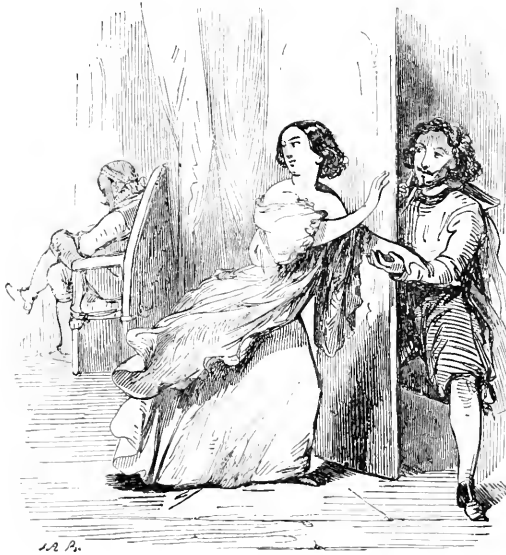
Le galant et sa dame.

Tournons-nous d'un autre côté, poursuivait Asmodée : parcourons de nouveaux objets. Laissez tomber vos regards sur l'hôtel qui est directement au-dessous de nous, vous y verrez une chose assez rare. C'est un homme chargé de dettes qui dort d'un profond sommeil. Il faut donc que ce soit une personne de qualité ? dit Leandro. Justement, répondit le démon. C'est un marquis de cent mille ducats de rente, et dont pourtant la dépense excède le revenu. Sa table et ses maîtresses le mettent dans la nécessité de s'endetter ; mais cela ne trouble point son repos ; au contraire, quand il veut bien devoir à un marchand, il s'imagine que ce marchand lui a beaucoup d'obligation. C'est chez vous, disait-il l'autre jour à un drapier, c'est chez vous que je veux désormais prendre à crédit : je vous donne la préférence.