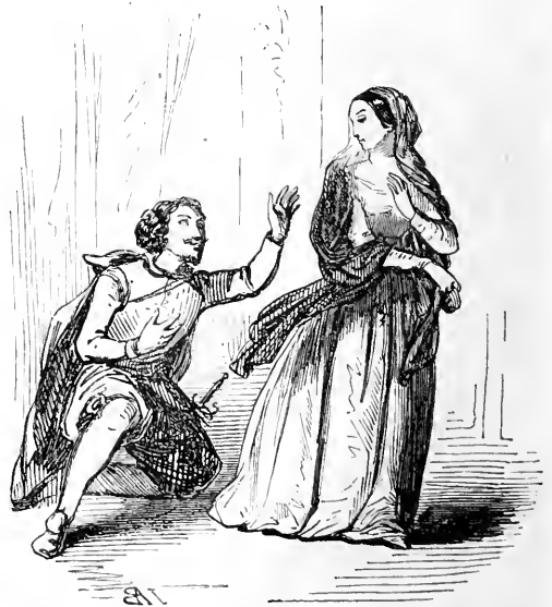
Le comte de Bellor aux pieds de Léonor

de lettres. Cet auteur, répliqua don Cleophas, est apparemment un grand sujet. Vous en allez juger, répartit le démon. Il est entouré de mille volumes, et il en compose un où il ne met rien du sien. Il pille dans ces livres et ces manuscrits ; et quoiqu'il ne fasse qu'arranger et lier ses larcins, il a plus de vanité qu'un véritable auteur.