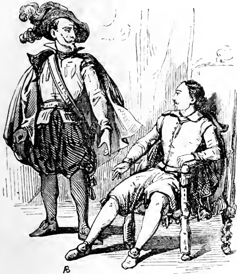
Don Luis chez le comte de Bilibor.

ravi de la voir, dit Leandro. Cette bonne personne, si utile à la jeunesse, est sans doute une de ces deux vieilles que j'aperçois dans ma salle basse. L'une a les deux coudes appuyés sur une table, et regarde attentivement l'autre, qui compte de l'argent. Laquelle des deux est la Chichona? C'est, dit le démon, celle qui ne compte point. L'autre, nommée la Pehrada, est une honorable dame de la même profession : elles sont associées, et elles partagent en ce moment les fruits d'une aventure qu'elles viennent de mettre à fin.