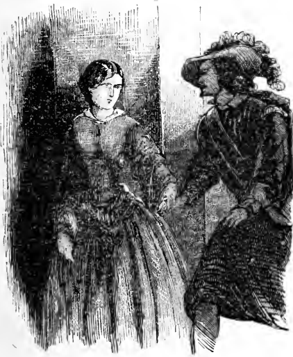
Gil Blas introduit chez la senora Verena.

Tandis que, loin de mon Hélène, je me disposais à tromper, autant qu'il me serait possible, mon amour et mes ennemis, cette dame à Coria pleurait en secret mon absence. Au lieu d'applaudir aux poursuites que sa famille faisait contre moi au sujet de la mort d'Oliguera, elle souhaitait au contraire qu'un prompt accommodement les fit cesser et hâtât mon retour. Six mois s'étaient déjà écoulés depuis qu'elle m'avait perdu, et je crois que sa constance aurait toujours triomphé du temps, si elle n'eût eu que le temps à combattre; mais elle eut des ennemis encore plus puissants. Don Blas de Combados, gentilhomme de la côte occiden-