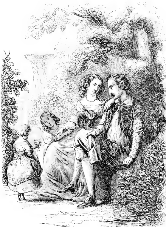
Gil Blas et sa famille.

Deux jours après mon retour de Valence à Lirias, Basile le laboureur, mon fermier, vint à mon lever me demander la permission de me présenter Antonia sa fille, qui souhaitait, disait-il, avoir l'honneur de saluer son nouveau maître. Je lui répondis que cela me ferait plaisir. Il