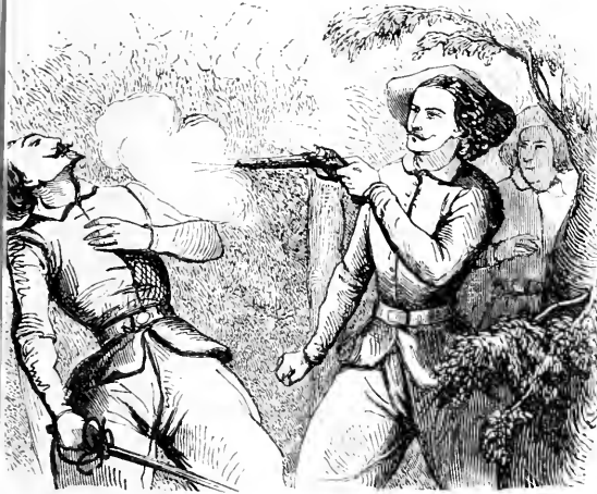
Mort de Peralte.

dans cet endroit, à l'issue de son dîner, faire la sieste avec Rosaura, sa suivante favorite, qui joue du luth et chante à ravir. Elles y passent ordinairement deux ou trois heures à s'entretenir. Vous pourriez non-seulement les voir, mais même les entendre en vous cachant derrière le cabinet : ce qui parut effectivement au comte et à Melchior une chose très-facile. Comme la nuit approchait, le jardinier les reconduisit à sa maison, et les mit dans une petite chambre, où il les laissa reposer après les avoir fait souper fort frugalement.