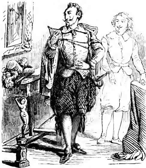
Le seigneur don Côme.

En même temps ils se sont tous deux pris à la gorge et aux cheveux, et les coups de poing et de pied n'ont pas été épargnés de part et d'autre. Un Italien, couché dans la chambre voisine, a entendu tout ce dialogue ; et au bruit que les auteurs faisaient en se battant, il a jugé qu'ils étaient aux prises. Il s'est levé, et, par compassion pour ces Français, quoique Italien, il a appelé du monde. Un Flamand et deux Allemands, qui sont ces personnes que vous voyez, viennent avec l'Italien séparer les combattants.