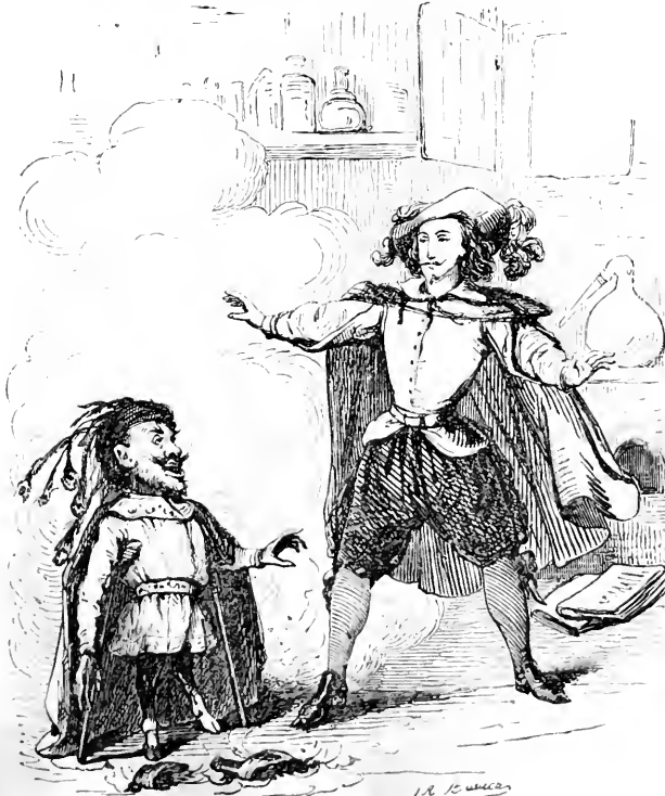
Zambullo et le Diable boîteux.

Il rêvait au péril que son bonheur lui avait fait éviter, et délibérait en lui-même s'il demeurerait là jusqu'au lendemain, ou s'il prendrait un autre parti, quand il entendit pousser un long soupir auprès de lui. Il s'imagina d'abord que c'était quelque fantôme de son esprit agité, une illusion de la nuit; c'est pourquoi, sans s'y arrêter, il continua ses réflexions.