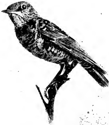
Pétrocinèle de roche (femelle).

comme capturée dans le pays, la femelle prise à Jambes en précisant qu'elle fait partie de la Collection Frin, mais ne parle pas du tout d'un sujet pris en Belgique et qui aurait fait partie de sa collection! Il y a là donc de quoi être per-