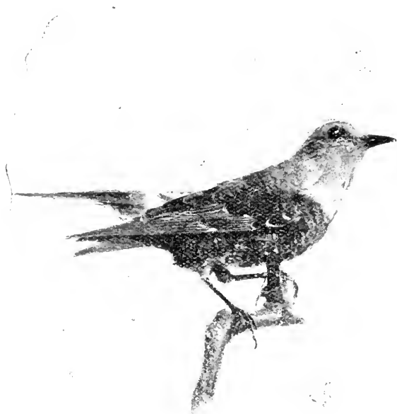
PétrocinCLE de roche (mâle).

Cette mention « Belgique » veut-elle dire que ces sujets aient été recueillis en notre pays, ou bien, comme malheu-