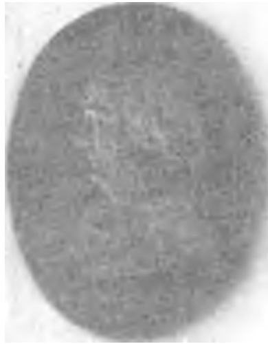
LE GÉNÉRAL CHODERLOS DE LACLOS d'après un camée de Bouzanigüe