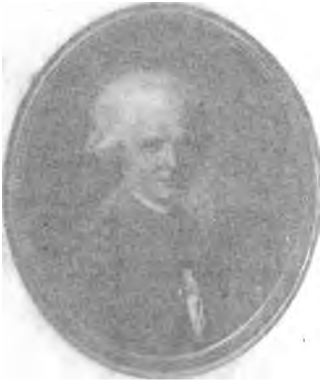
CHODERLOS DE LACLOS d'après un pastel original appartenant à Madame Louis de Chauvigny