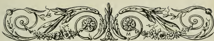
TABLE DES CHAPITRES