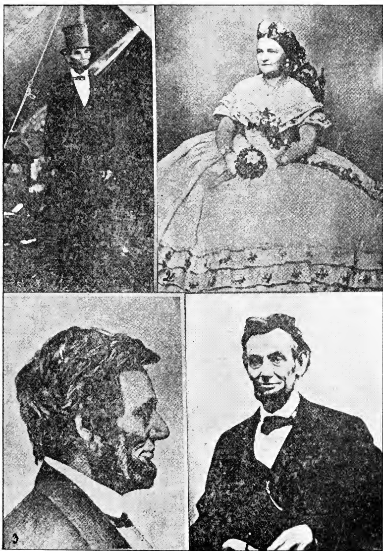
1—Lincoln framför gen. McClellans tält den 3 okt. 1862.