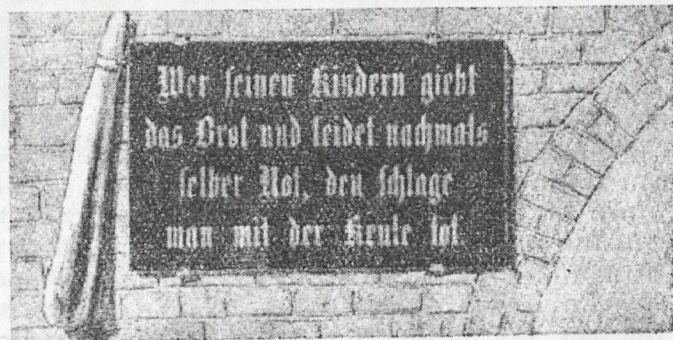
Am Dammtor in Fütterbog.

Nach Bartsch (Sagen, I, Nr. 640) war an dem um 1740 niedergerissenen